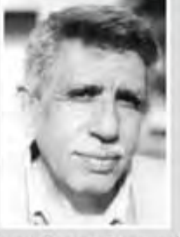
فوز محمد خضير وحسب الشيخ جعفر بجائزة العويس الثقافية

اعلنت مؤسسة سلطان بن علي العويس الثقافية نتائج جوائزها للامعة الثامنة وقد اسفرت عن فوز عر قبين ومصريين بجوائز الاربعة ويبتسئ اسمه الفائزة بجائزة التجاز الثقافي منها واربعا يعلن عنه في حفل توزيع الجوائز في فبراير القادم. وقد فاز حسب الشيخ جعفر في مجال الشعر، ولقاص محمد خضير في مجال النصة والرواية والنس حية. وللناقد مصطفى لاصف في مجال الدراسات الادبية والنقد. وللفكر محمود امين العامل في مجال الدراسات الانسانية والاستقبلية.