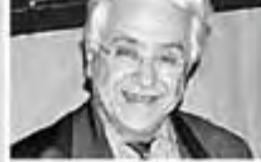
محمد أركون يفوز بجائزة ابن رشد

تقلير المسببه نحو طريق التعاليف الفلسفي للتألفات والادب، منححت مؤسسة ابن رشد لجر جوائزها لهذا العام لفكر لجر لجر محمد أركون. بسبب دوره الريادي في البحث عن جذور عرسية اصلية في الثقاف والعتالفة والتنوير. وتهدف مؤسسة ابن رشد الى اختصارها لشرح جو لرها الى مسئلة حرية التعبير والديمقراطية في العالم العربي. ومن هنا ياتي منحسها جائزة هذا العام لفيلسوف مستقل قدم اصلا لامية للجماعات العربية من اجل العتالفة والتنوير، وازكون الفائق بجائزة احد