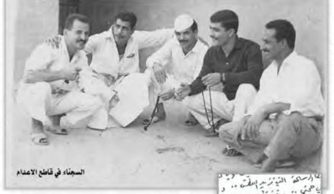
السجناء في قاطع الاعدام

الانهيار الذي تذكره الرواية، ما مدى قربه من الوقع؟ - ان هذا الكلام غير صحيح لاني نطقعت عن رفاقي في اليوم الثالث من عملية للسيطرة على الخضر وبالصبط بعد اسطد اسنا بالكامين الاول الذي نصبته لناقوة من الشرطة وقبل مجيء قوات الجيش التي حسمت العركة بعد يومين. وان نقطاعني عن لجموعه كان بسبب ذهاسي لجلب بعض الاسلحة من لزويقي التي استعدنا عنها بسعد ان استد الرمي علينا من قبل الشرطة. وحينما تأخرت. غير الرفاق ماكنهم ظناً منهم اني اسرت او جرحت وحيث عدت ال المكان لم اجدهم ولهدالم تستر كمهم في العركة