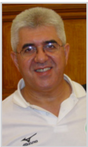
عادل فاضل الاولمبية الدولية جاك روغ ابدى ارتياحه الكبير على البرامج التي تعدها الاولمبية العراقية ومنها السلم والرياضة و(المرأة والرياضة) والعلوم والرياضة وموضوع التسويق الرياضي وتطوير كفاءة اللاعبين والمدربين والدعم المالي من الاولمبية الدولية الى الاولمبية العراقية.

اختتم رعد حمودي رئيس اللجنة الاولمبية الوطنية العراقية الدكتورعادل فاضل الامين العام للجنة اجتماعاتها في لوزان بقاء جاك روغ رئيس اللجنة الاولمبية الدولية بعد ان تم عقد سلسلة من اللقاءات مع المختصين في اللجنة. وقال الدكتور عادل فاضل في بيان المكتب الاعلامي للجنة الاولمبية تلت (المدى) نسخة منه: ان الزيارة كانت ناجحة بكل المقاييس وليست لها اية صلة بموضوع حل الاتحاد العراقي المركزي لكرة القدم ان لم يتم التطرق الى الموضوع من قبل الجميع لا من قريب ولا من بعيد ومع جميع من تم عقد الاجتماعات معهم او حتى من قبل الوفد الاولمبي العراقي اذ ان هذه الزيارة هي زيارة بروتوكولية لاطلاع على كل ما هو قيد في الموضوعات المتعلقة باللجنة مفيد في البرامج الخاصة باللجنة الدولية وهي ضمن برنامج الاعمال والعلوم والرياضة وموضوع التسويق الرياضي وتطوير كفاءة اللاعبين والمدربين والدعم المالي من الاولمبية الدولية الى الاولمبية العراقية. و اضاف فاضل: ان رئيس اللجنة