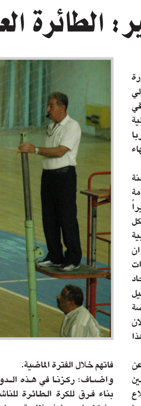
الكرة الطائرة بحاجة الى المال والدرّب الكفء اعمارهم وكيف نعدّ الخطط السنوية للمسابقات والتدريب. واكد المدرب المصري ان عودة العراق الى الساحة الدولية الرياضية مرتبطة بتخصيص

فاته خلال الفترة الماضية. وأضاف: ركزنا في هذه الدورة على كيفية بناء فرق للكرة الطائرة للناشئين والصغار وتركز على معارف نظرية وعملية عن التدريب