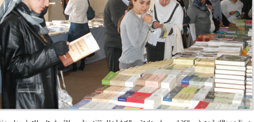
وسنقوم بإقامة معرض للكتاب في مطلع شباط المقبل في المجلس نهاية شهر شباط القادم. البلدي لقاطع الأعظمية، ومعرضين