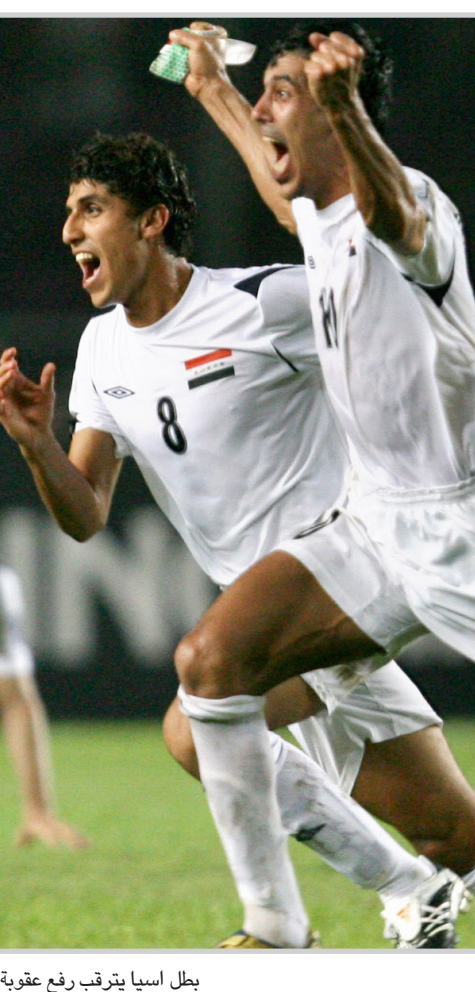
بطل اسيا يتربّع رفع عقوية التجميد