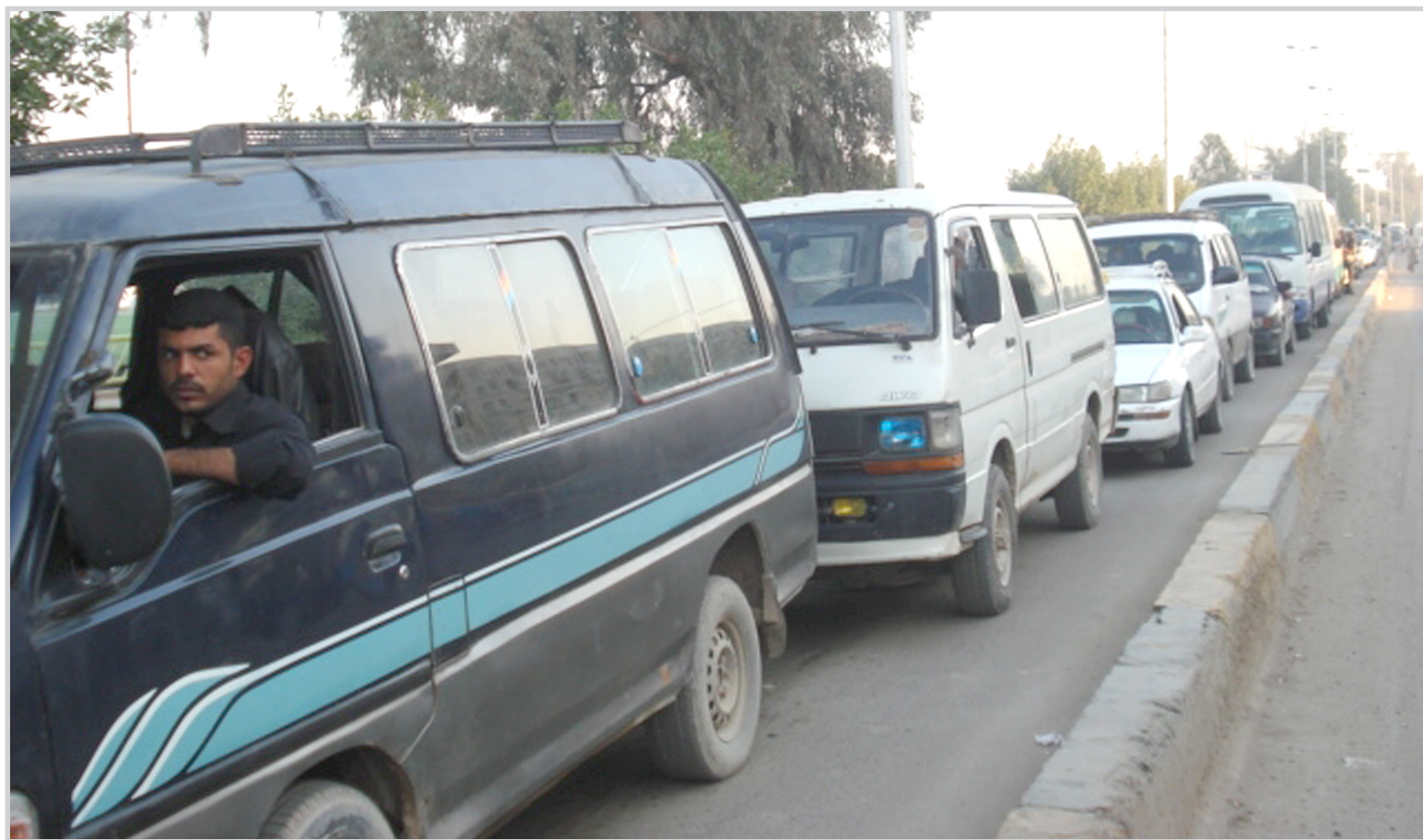
ساعات من الانتظار!

إذ ما أردت العبور الى منطقة (التنومة) فأمامك أحد الخيارين: إما عبور الجسر الوحيد الرابط بين العشار وقضاء شط العرب المعروف بـ(جسر التنومة) سيرا على الأقدام وهذا ما يفعله معظم الشباب ممن لا يستطيعون تحمل ساعات الانتظار المملة، أو البقاء في الحافلة الى أن تحين الفرصة للعبور من على الجسر كما هو الحال بالنسبة للشيوخ والعجائز والمرضى، أما أصحاب المركبات فإنهم على ما يبدو اعتادوا على الإزدحامات ومن ثم الانتظار ساعات، الأحيان أربع ساعات!،