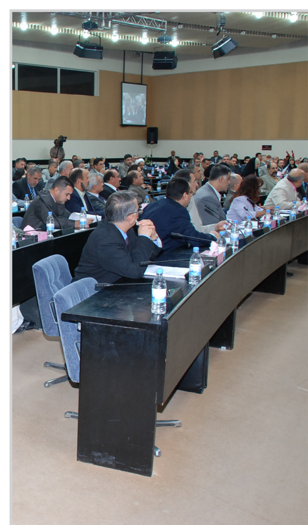
جلسة في مجلس النواب

ب (لا يعمل بأي قانون يتعارض وأحكام هذا القانون) أي أن هيئة اجتثاث البحث لم تعد هيئة قائمة وقد توقف العمل بها نهائياً ولا يجوز لها إصدار قرارات المواطن من جراء عمليات الإجراء بحق الشعب من قتل وتشريد وجوع وحرمان ويستمر الفساد المستشري في كافة مفاصل الحياة اليومية وكل مفاصل الدولة العراقية ويبقى العراق مهاندا ذليلا عرضة للنهب لمن هب ودب ويبقى خارج محيطه العربي أسيرا لقرارات النظام الإيراني ورغباته . خامساً : - أن المادة (٢٩) من قانون المسائلة والعدالة نصت