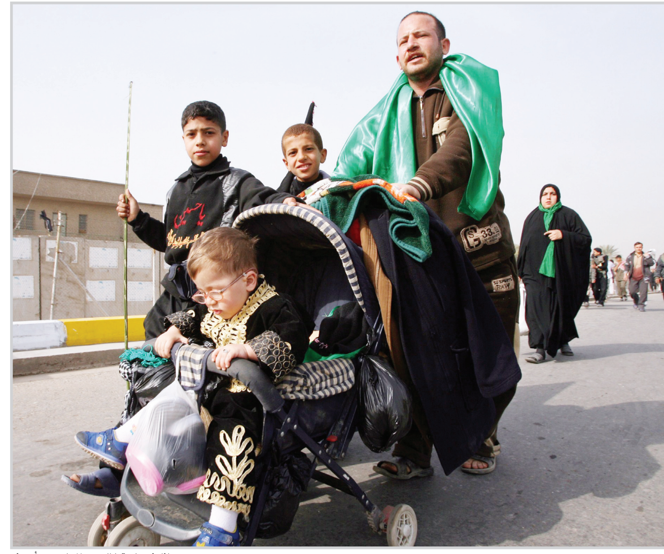
عوائل في طريقها الى كربلاء امس

أكدت المفوضية العليا المستقلة للانتخابات استكمال مستلزمات عملية الاقتراع في نهاية شهر شباط المقبل ، وتعلن عن تدارسها لموعد اقتراع عراقيي الخارج . وقال عضو مجلس المفوضين كريم التميمي في تصريح لـ (المدى) ان "الاحتياجات الضرورية لعملية الاقتراع تستكمل تباعاً بعد يوم ١٥ شباط المقبل وتكون بشكل وجبات وتكمل المستلزمات في نهاية شهر شباط ، مشيراً الى توزيعها على مكاتب المفوضية في المحافظات إضافة الى إقليم كردستان بعد اكتمال وصول جميع الوجبات الى العراق ، وأوضح التميمي ان "المستلزمات تتضمن صناديق الاقتراع ، والاصحار التي تستخدم لتلوين اصابع المنتخبين ، إضافة الى استمارات الاقتراع ، كما اعلن التميمي عن موافقة جميع الدول التي فاتحتها المفوضية بشأن افتتاح مراكز اقتراع للعراقيين المقيمين . موضحاً ان ١٦ دولة كانت فاتحتها المفوضية بغية افتتاح مراكز اقتراع لضمان تصويت العراقيين المقيمين فيها ضمن الدورة الانتخابية المقبلة ، مشيراً الى ان الدول أبدت موافقتها . وكشف التميمي ان ايام الاقتراع لناخبي الخارج ستكون قبل يوم او يومين من الاقتراع في داخل البلاد ، مبيناً ان المفوضية تدرس موعد اقتراع الخارج ، واضاف بدأنا بتجهيز مكاتبنا في ٦ دولة من ناحية الخطة الاعلامية وقوانين