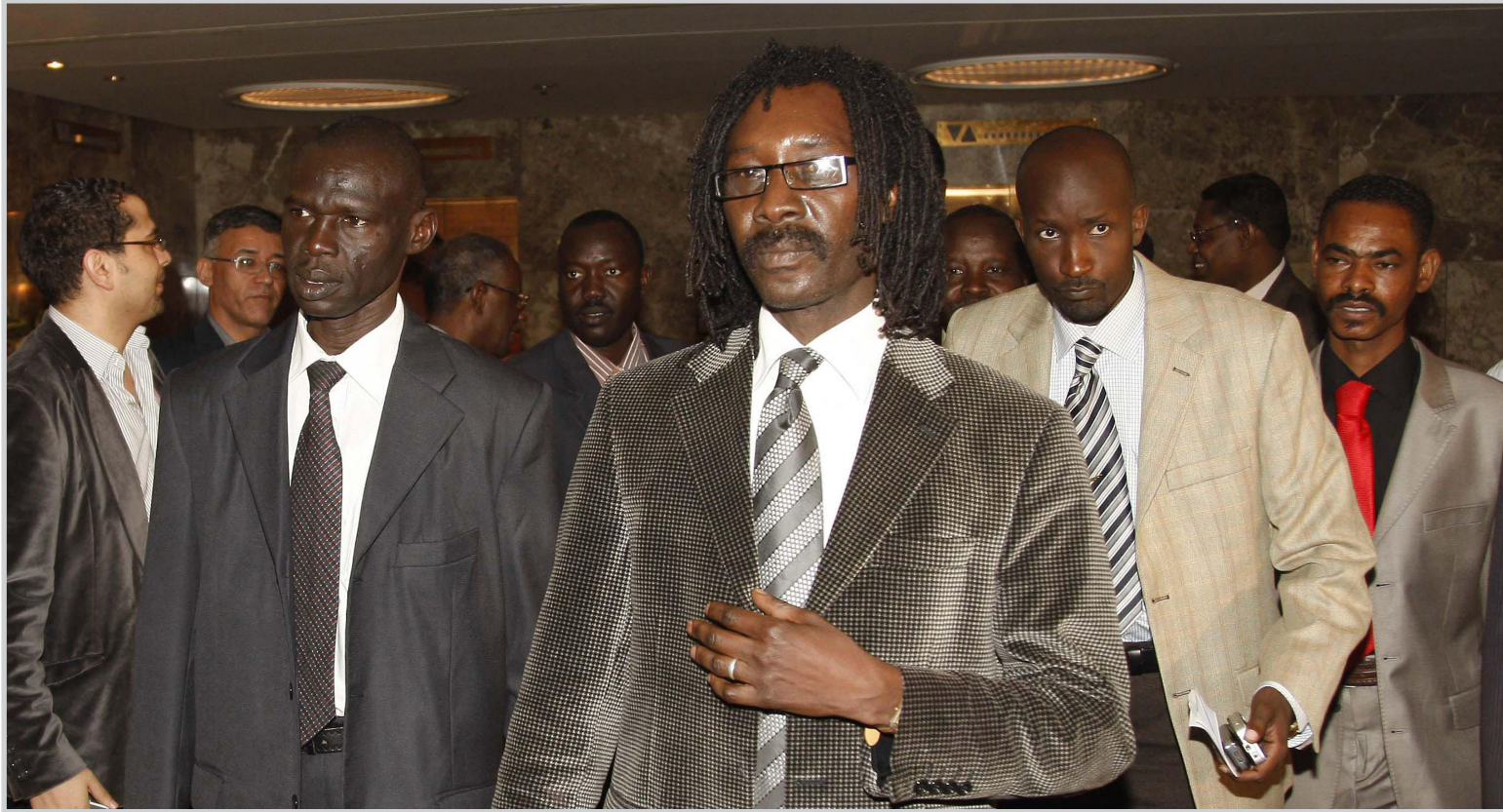
المعارضة السودانية في مفاوضات مع الحكومة