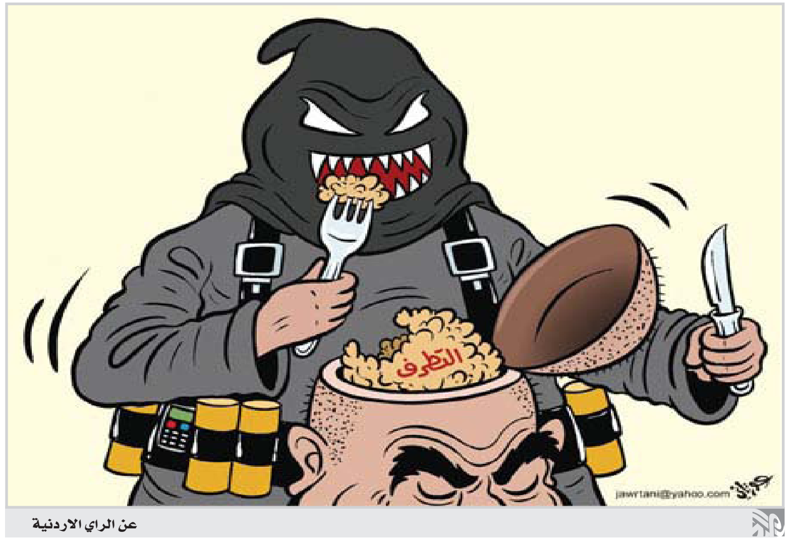
عن الراي الاردنية

الاراضي الخطينية وحزب الله في لبنان. وقال ان "التاريخ يظهر انه عندما تشعر الانظمة بالضغط، كما هو الحال في ايران داخليا حاليا وخارجيا في المستقبل القريب، فانها عادة ما تضرب من خلال اتباعها". وأشار الى التوترات السياسية الداخلية في ايران اضافة الى الضغوط على الجمهورية الاسلامية بسبب تطلعاتها النووية. ولن تراجع عن دعمها لتطلعات الفلسطينيين . وأشار الى الجولة المكوكية التي قام بها هذا الاسبوع المبعوث الاميركي الخاص الى الشرق الاوسط جورج ميتشل والتقى خلالها برئيس الوزراء الاسرائيلي بنيامين نتانياهو والرئيس الفلسطيني محمود عباس. وخرج جونز من ان ايران قد تصعد العنف في المنطقة من خلال حلفائها الاسلاميين وهم حركة حماس في