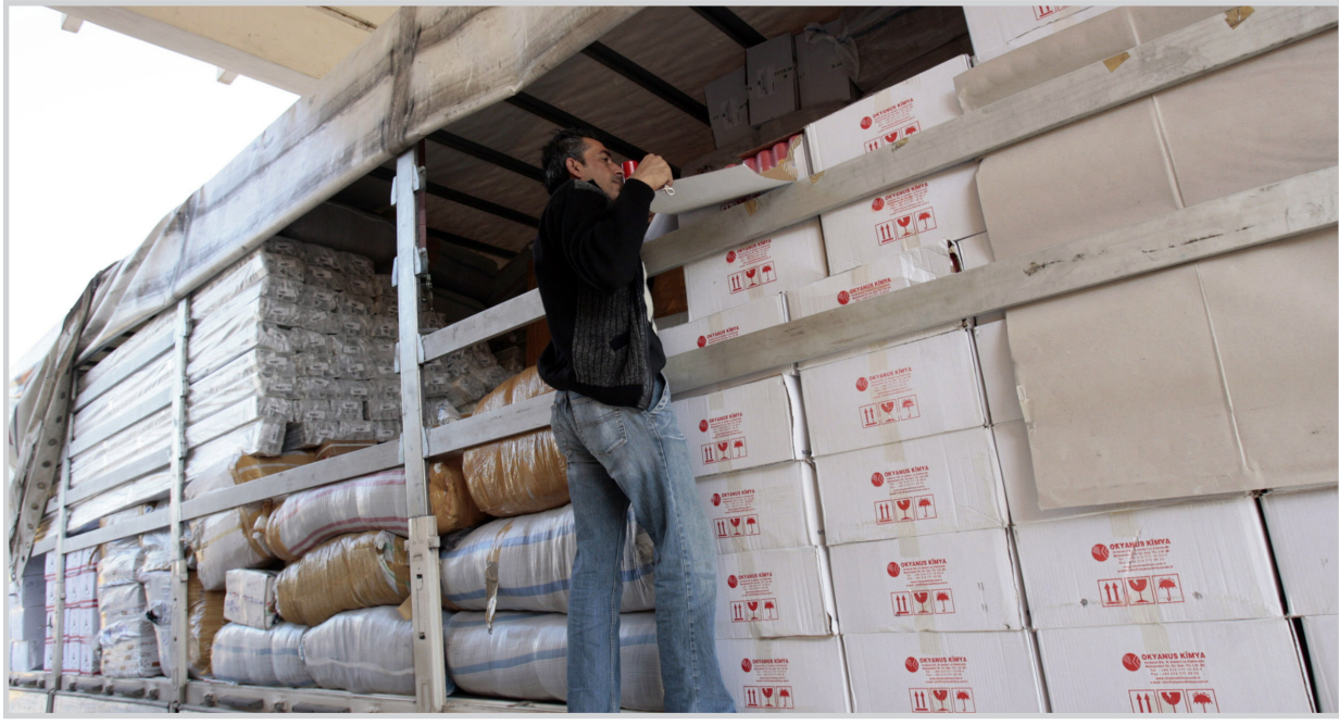
مواد مسودة للدولة عن طريق القطاع الخاص

بغداد / المدى فرمجلس الوزراء تحويل لجان فرعية في كل وزارة بتدقيق مستحقات القطاع الخاص أفرادا وشركات، وأوضح الناطق باسم الحكومة الدكتور علي الدباغ بحسب بيان مكتبه تلقت المدى نسخة منه: ان اللجان ستقوم ببيان قيمة الديون وجداول تتضمن مطالبات كل دائن ورفعها إلى امانة العامة لمجلس الوزراء، تمهيدا لعرضها على لجنة مركزية مختصة ثم عرضها على مجلس الوزراء، لاتخاذ قرار لاحق في الموضوع، بشأن تسوية هذه الديون، وأشار الناطق إلى ان الموافقة على تحويل لجان فرعية في كل وزارة لتدقيق مستحقات القطاع الخاص، تأتي لغرض تحقيق التوازن بين الحفاظ على المال العام والوفاء بديون الحكومة الثابتة استحقاقها حفاظا على الثقة العامة، وعدم الإضرار بحقوق غيرهم حيث وضعت ضوابط مشتركة لصفحة