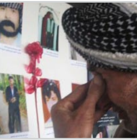
احد ذوي الضحايا يستذكر الشهداء

اربييل / PUKmedia أعلنت مديرية متابعة العنف ضد المرأة في وزارة الداخلية بحكومة إقليم كردستان، امس الأربعاء، خلال مؤتمر صحفي في اربيل، عن انخفاض نسبة العنف ضد المرأة خلال عام 2009 مقارنة بـ 2008 فضلا عن ارتفاع نسبة الشكاوى من النساء، وقال مسؤول مديرية متابعة العنف ضد المرأة أري رفيق خلال المؤتمر انه وفقا لآليات وبرامج معدة من قبل المديرية الخاصة بالعنف ضد المرأة تمكنت من تخفيض نسبة قتل النساء إلى ٥٠٪، فضلا عن ارتفاع نسبة تقديم الشكاوى من قبل النساء التي يتعرضن للعنف إلى 20٠٪. وأضاف "تمكنت خلال سنتين من نشر أربعة تقارير خاصة بالعنف ضد المرأة حول جميع أنواع الحالات التي تتعرض لها المرأة فضلا عن إحصائيات وإستطلاعات "، مشيرا الى ان "التقرير الحالي يضم عدد الإحداث التي تعرضت لها المرأة خلال عام 2009، منها ( القتل، الحرق، حالات الشكاوى، التحرش الجنسي، الخنق الخ) . وأضاف ان "أربعة مديريات في الإقليم تعمل على متابعة العنف ضد المرأة منها في اربيل والسليمانية ودهوك ومنطقة كرميان، بالإضافة الى ستة مكاتب في ناكري وسوران ورائية وشارزور وناميدي وراحو، مبيتنا ان 4٠٠ موظفا يعملون في المديرات منهم 10٠ نساء".