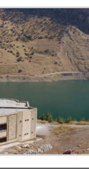
صورة أرشيفية لاحدسدود العراق