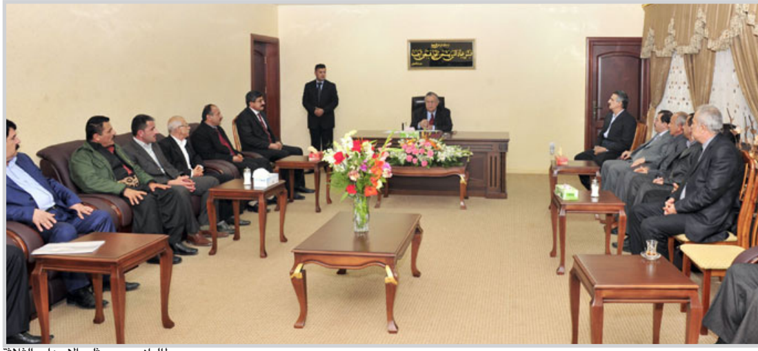
طالباني مع ممثلي الأحزاب الثلاثة

واصفاً هذا الدور بالمحوري، وأنه كان الجامع والمنسق بين الفرقاء السياسيين وعمل بفعالية من أجل تعزيز التوافق بين القوى العراقية المختلفة.