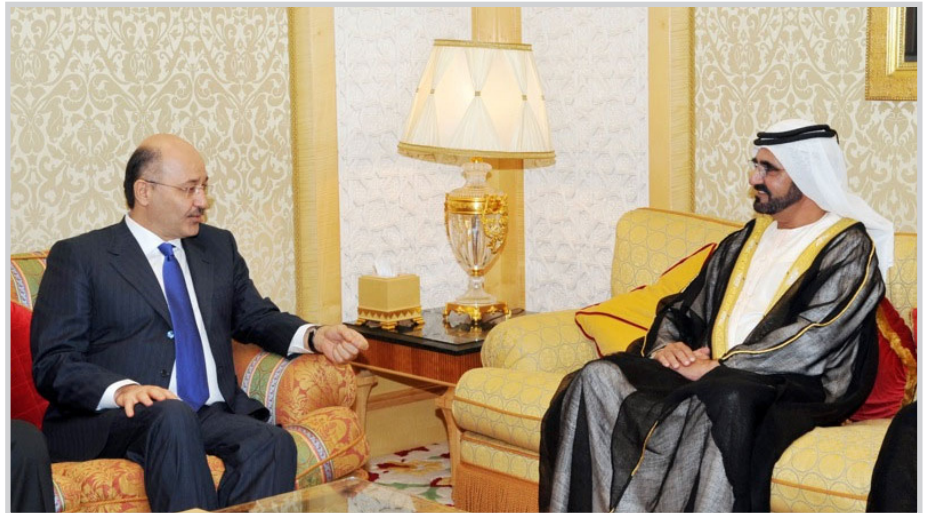
صالح في ضيافة دولة الإمارات

من تجار ورجال الأعمال في إقليم كردستان، إلى دولة الإمارات العربية المتحدة لتلبية لدعوة من الحكومة الاماراتية، حيث استقبله هناك نائب رئيس دولة الإمارات العربية المتحدة، ورئيس مجلس الوزراء حاكم دبي الشيخ محمد بن راشد آل مكتوم وعبد العزيز غرير رئيس مجلس الاتحاد الإماراتي. وجرى خلال اللقاء مناقشة آليات تعزيز العلاقات الثنائية بين إقليم كردستان ودولة الإمارات العربية المتحدة، حيث عبر الشيخ آل مكتوم عن سعاده لزيارة الدكتور برهم صالح والوفد المرافق له إلى دولة الإمارات، مشيداً بالدور الذي يلعبه الإقليم في تحسين العلاقات بين الإمارات والعراق.