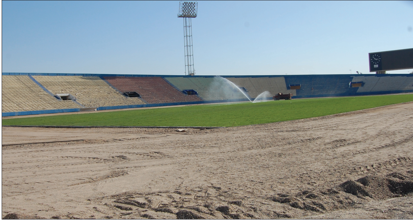
ملعب الشعب بعد تجديد نجيله

من هنا لا بد من ان يكون لوزارة الشباب والرياضة الرأي والمشورة بل والسيطرة من اجل ان تكون منظومة البناء تحت اشرافها ووفق رؤيتها وتوجهاتها التي تصب في تشييد متكامل يحقق امرين: الاول تغطية حاجة المحافظات بالتنسيق مع الادارات المحلية والثاني فرض آلية عمل متطورة بعيد عن العشوائية والتنوع بالتوزيع كمرحلة اولى حتى تكون المنشآت جزءاً من الخزين الوطني. وبذلك تضمن الحداثة في البناء والفائدة وارضاء كل الجماهير وعودة الاحساس بان اي جزء يتم تشييده في البلد انما هو ملك له ان كان في محافظته او في ابعد نقطة من العراق.