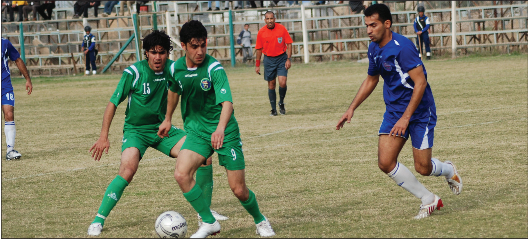
دوري الكرة هذا الموسم يثير جدلا واسعا بين الاندية