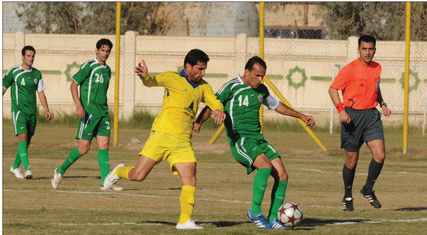
الهيئة المؤقتة تؤكد على اللعب النظيف في منافسات الدوري

وعن التغييرات التي طرأت على جداول المباريات في الادوار التسعة اشار جمال الى ان ذلك يحصل لاسباب فنية بحتة وعدم وجود ملاعب لجميع الفرق التي تلعب في الدرجة الممتازة والدليل على ذلك قرار بتأجيل مباراة النجم والميناء الاخيرة من يوم السبت الى يوم الاثنين الماضيين نتيجة عدم وجود حجوزات للفريق الزائر الميناء في فنادق مدينة النجم لتزامن موعد المباراة مع