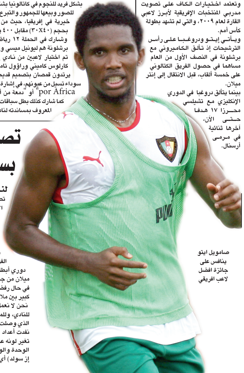
سامويل إيتو ينافس على جائزة أفضل لاعب إفريقي

يذكر أن خوليت فاز مع منتخب هولندا بكأس الأمم الأوروبية بألمانيا عام ١٩٨٨ ويعد تعيينه لقيادة حملة الدعاية بمثابة دفعة كبرى لاستضافة البطولة في هولندا وبلجيكا. وكان خوليت ينتمي إلى جيل العمالقة في منتخب هولندا في حقبة الثمانينيات من القرن الماضي مع فان باستن وريكارد.