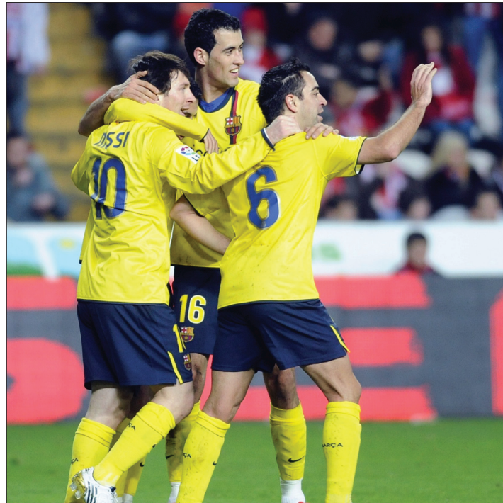
نجم برشلونة ميسي اسهم في مباراة خيرية

كما شارك كذلك بطل سباقات الدراجات النارية خورخي لورينزو المعروف بمساندته لنادي برشلونة.