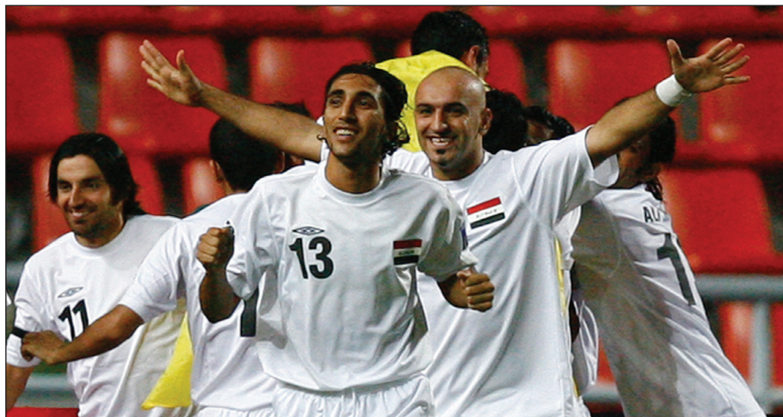
ابطال امم اسيا لحظة الفوز باللقب الاعلى

رب سائل يسأل : لماذا تؤخذ في الاعتبار النيات السيئة وليس النيات الطيبة في هكذا مبادرات غامضة لن يكون الوطن مكاناً لها ولم يكن لأصحاب المبادرة أي موقف متفاعل ولو بكلمة (نحن معكم) في كثير من الأزمات التي اكتفوا بالتفرج وتصيدوا الوقت المناسب لاحقا للتعبير عن التأسى والمشاطرة