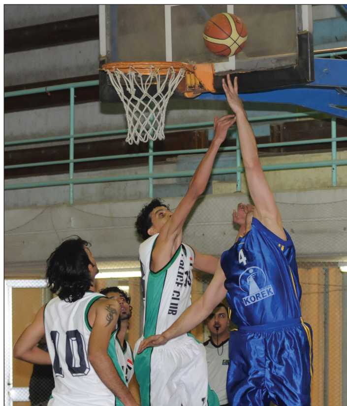
سلة دهوك تكشف استعداداتها لبطولة غرب آسيا

التجنيس سيكون لصالح الفرق الاردنية واللبنانية وهو عامل ضغط سلبي علينا في البطولة لكننا في الوقت نفسه سنعمل على ان تكون مشاركتنا اكثر ايجابية، حيث سبق ان شاركنا كمدرسين في بطولة الأندية العربية قبل موسمين ونتمنى ان تكون مشاركتنا