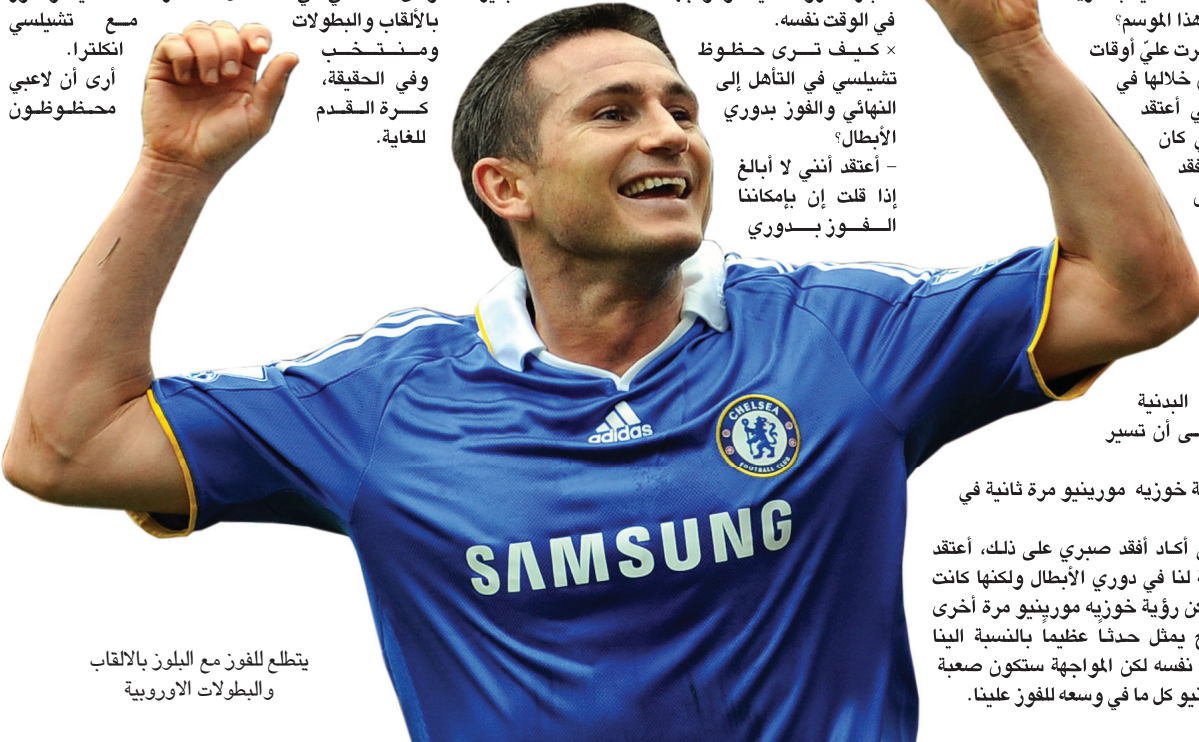
يتطلع للفوز مع البلوز بالألقاب والبطولات الأوروبية

– بكل تأكيد، برغم أنني كنت لا أحبذ الحديث عن هذا الامر،