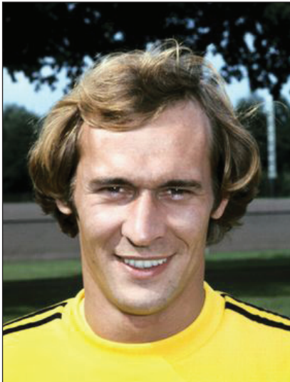
الحارس الهولندي بيفرن

أيضا هو انه بعد تلاعبه بلاعبى الفريق الخصم يفاجئهم وحارس المرمى وكذلك الجمهور الحاضر بقدراته ، إذ لا يدع لهم المجال لمعرفة متى يركل الكرة وفي أي قدم من قدميه ! إنما الذي يشاهده الجمهور طيران حامي الهدف الهولندي بيفرن بسرعة فائقة باتجاه احد القائمين فيعرف ان الكرة قد سدت الى ذلك الاتجاه .