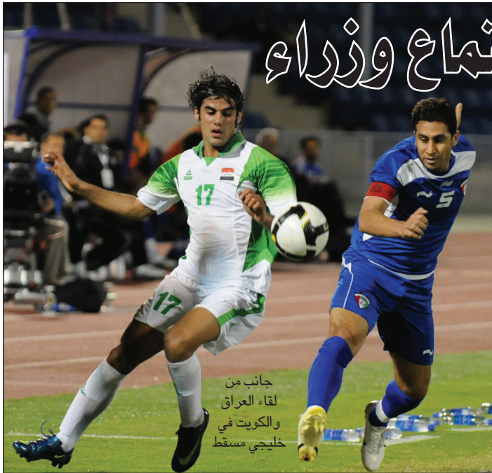
جانب من لقاء العراق والكويت في خليجي مسقط