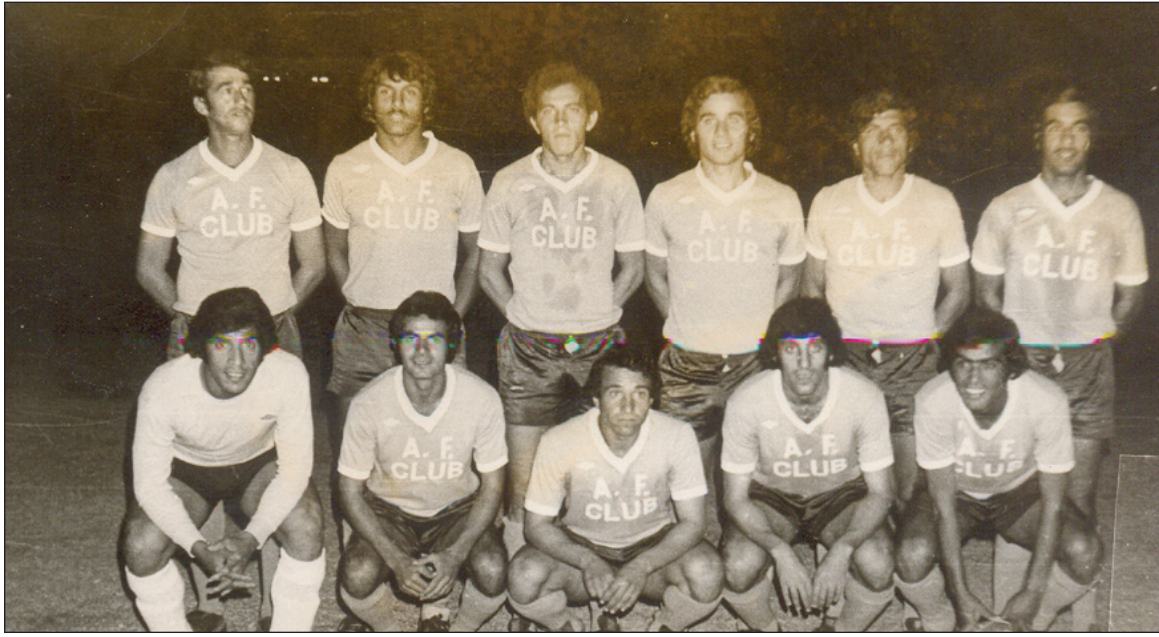
كاظم شبيب والطيران علاقة وطيدة وثاقها الوفاء

هناك نجوم قلائل يصمدون في ذاكرة الناس على مدى طويل من الزمن، لكونهم يتركون أثرا طيبا خلفهم من خلال البصمات العديدة التي يقدمونها فوق المستطيل الأخضر الذي كافأهم بالخلود الطويل في ذاكرة الجمهور الرياضي. في زاوية (نجوم في الذاكرة) سنحاول الغور في مسيرة أحد نجوم المنتخبات العراقية السابقين الذين ترفض ذاكرة جمهورنا مغادرتهم لها، حيث صمدوا في البقاء فيها برغم مرور عقود عدة على اعتزالهم اللعب وحتى قسم منهم ابتعدوا عن الرياضة برمتها أو غادروا العراق إلى بلدان أخرى.