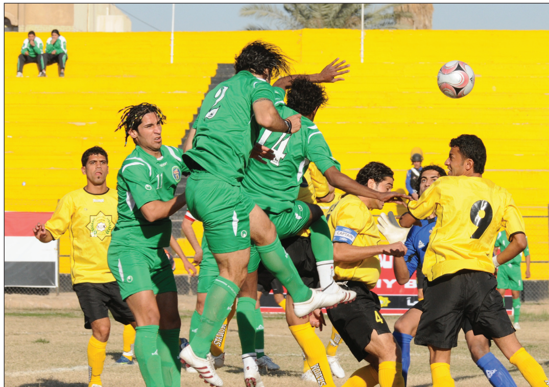
تنفيذ الضربة الحرة المباشرة بحاجة الى التركيز