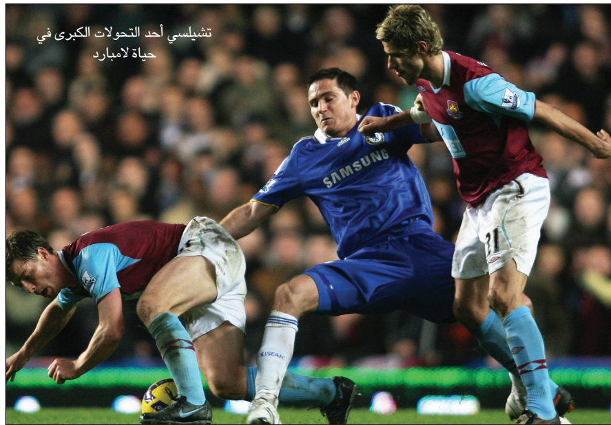
تشيلسي أحد التحولات الكبرى في حياة لامبارد

– أتمنى ذلك، فعمري الآن ٣١ عاماً، أي أنني تجاوزت نصف عمري في الملاعب، لكنني أرغب في الاستمرار في لعب كرة القدم أطول وقت ممكن، وهذا يجعلني أستمتع بكل مباراة وبكل حصة تدريبية وأود في النهاية أن أعرب عن سعادتني البالغة بحصولي على جائزة جمعية كتاب كرة القدم، وعن تطعاتي في استغلال الفرصة الحالية والفوز بالألقاب والبطولات ومنتخب تشيلسي مع تشيلسي وفي الحقيقة، كرة القدم للغاية.