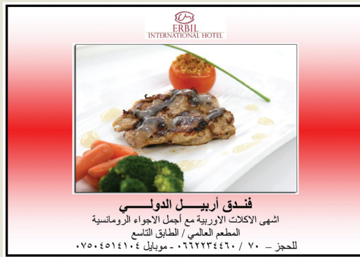
فندق أرييسل الدولي الشي الاكلات الأرييسل مع أجل الإجراء الأرييسل الطعم العظمي / الطبق الفاتح للحجز - ٧٠ / ٠٦٦٢٢٢٤٤٦٠ - ٠٧٠٤٤١٤١٠٤