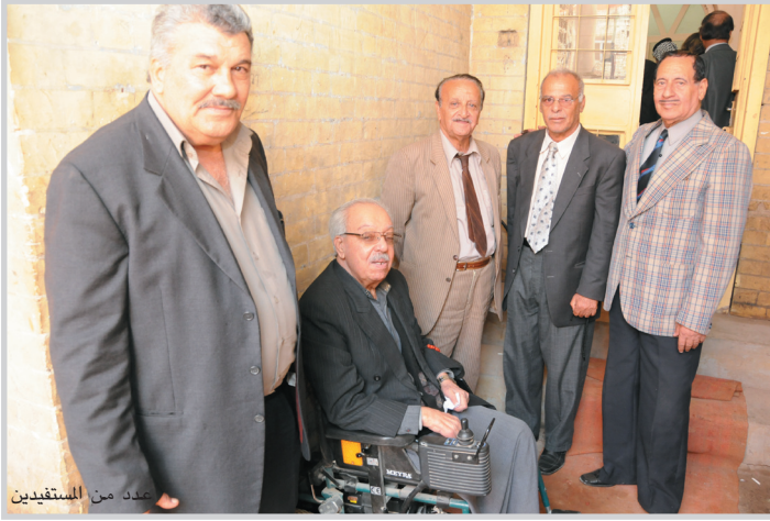
عضد من المستفيدين