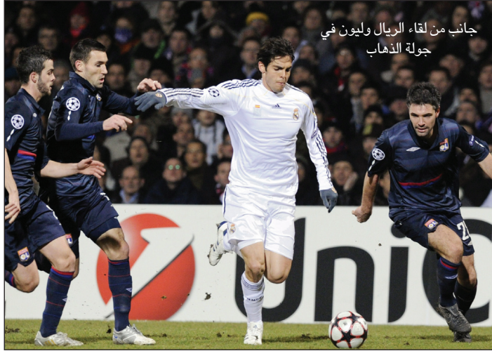
جانب من لقاء الريال وليون في جولة الذهاب

وقال رونالدو: أهدأ لاعبي الفريق هو كاكاء.. إنه أحد أفضل اللاعبين في العالم ولا يتوقف عن تعلم أمور كثيرة من يوم لآخر، سيصل إلى مستوى جيد لأنه يجتهد كل يوم.