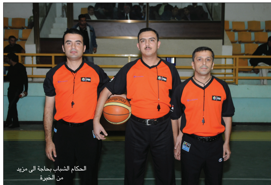
الحكام الشباب بحاجة الى مزيد من الخبرة

- ادرت مباريات كثيرة واهمها بين فريقي الكرخ والشرطة في موسم ١٩٩٢ - ١٩٩٣ مع الزميل حارت شاكر ، اما على المستوى الدولي فأنتي اعتز كثيرا بالمباراة التي جمعت فريقي الجيش السوري والجزيرة المصري في بطولة دمشق الدولية وكان معي الحكم الاردني احمد