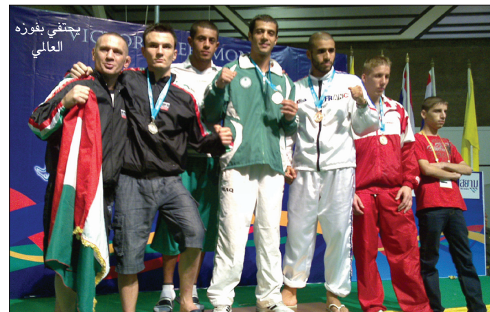
يحتفي بفوزه العالمي

- بصراحة وبكل فخر انا من دربت نفسي منذ ان دخلت عالم اللعبة الى الان حيث لا يوجد مدرب متخصص للعبة في البصرة وهي لعبة تمارس على نطاق محدود في الاندية البصرية ، كنت اتمرن صباحاً ومساءً الى ان اهلت نفسي لانتراع مقعد في المنتخب الوطني الذي من خلاله واصلت التدريب على ايدي مدرب اعترز به هو المدرب مصطفى جبار علك مدرب المنتخب الذي اضاف الكثير من الخبرات لي وطور امكانياتي، وقد استفدت ايضا من المعسكرات التي دخلتها مع المنتخب في تايلند.