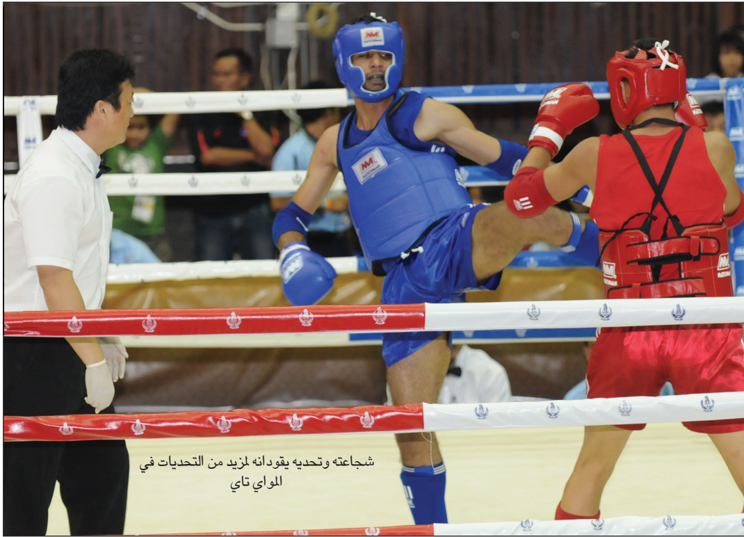
شجاعته وتحديه يقودانه لمزيد من التحديات في المواقف