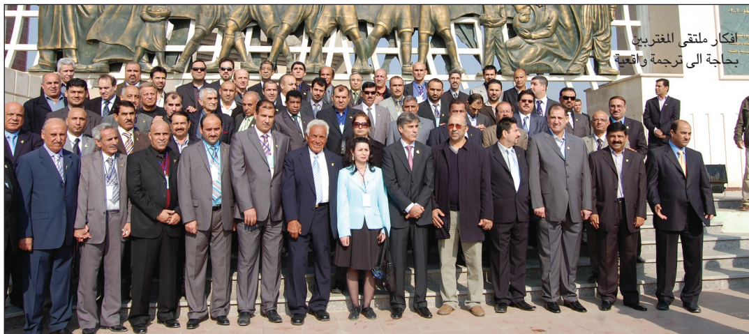
افكار ملتقى المغتربين بحاجة الى ترجمة واقعية

× وكيف نهتم بالرياضة المدرسية ؟ – العمل على تطوير الرياضة المدرسية يتم من خلال تقديم برنامج متكامل لتطوير المنهاج الرياضي في المدارس ولا بد من التعامل مع وزارة التربية لتفعيل الأنشطة الرياضية في