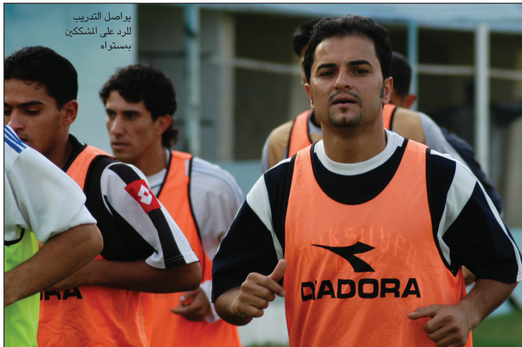
يوصل التدريب للرد على المشككين بمستواه