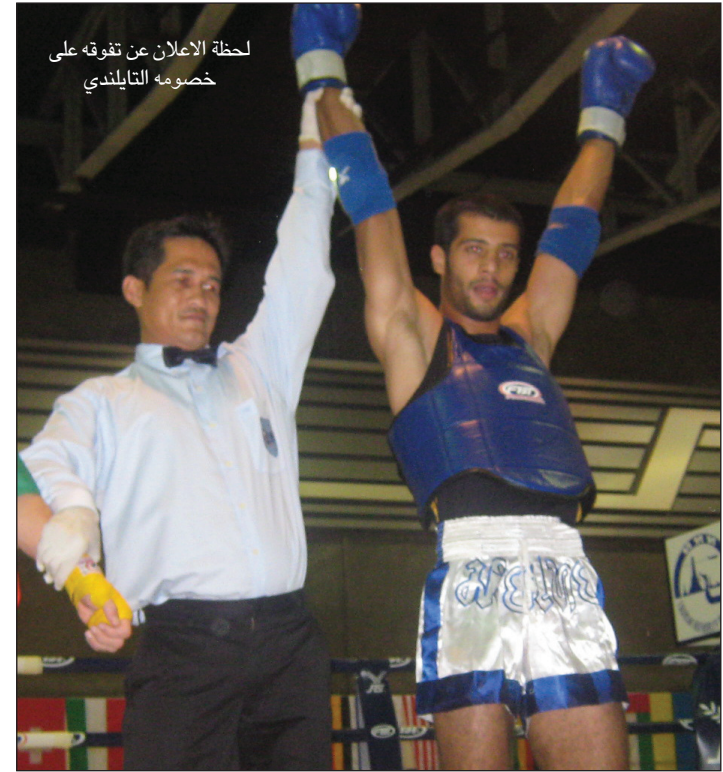
لحظة الاعلان عن تفوقه على خصومه التايكندي