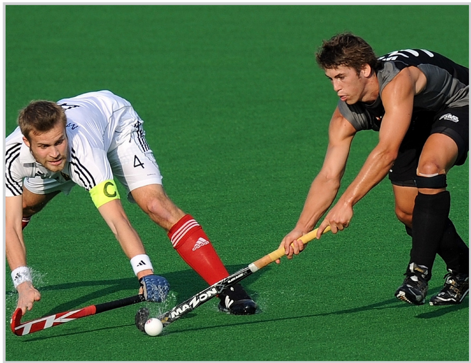
جانب من مباريات كأس العالم

برلين / وكالات يلتقي المنتخبان الألماني والأسترالي للمرة الثالثة على التوالي في نهائي بطولة كأس العالم للهوكي، حيث يأمل الفريق الأسترالي في تحقيق الفوز اليوم السبت على نظيره الألماني الفائز باللقب في البطولتين الماضيتين. وتغلب الفريق الألماني على نظيره الإنجليزي 1/4 في