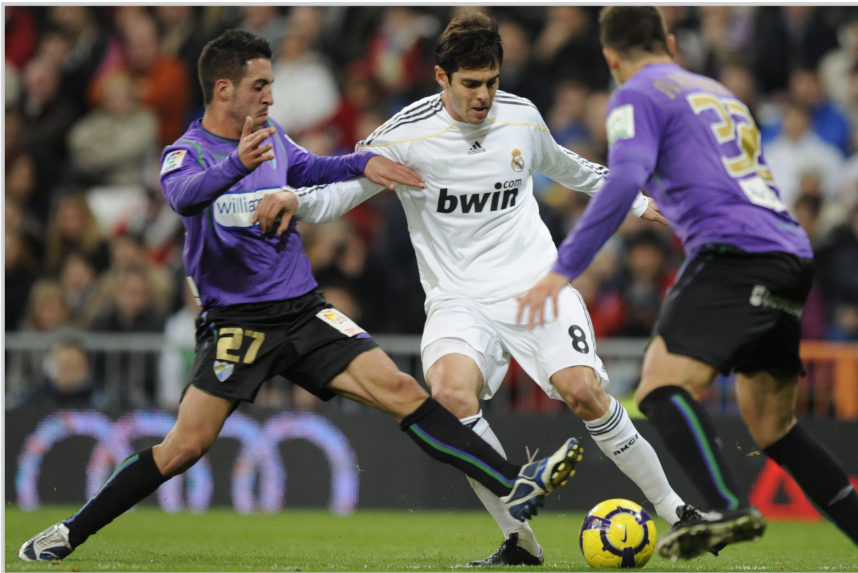
الريال يطمح بالتمسك بصدارة الليغا عبر بوابة بلد الوليد

نيقوسيا / (ا ف ب) يسعى ريال مدريد الى بلسمه جراحه محليا بعد خروجه الكارتي من دوري ابطال اوروبا على يد ليون الفرنسي منتصف الاسبوع الماضي وذلك عندما يحل ضيفا على بلد الوليد احد فرق النذل في المرحلة السادسة والعشرين من بطولة اسبانيا. وكان الفريق الملكي قد انتزع الصدارة بفارق الاهداف من غريمه التقليدي برشلونة الاسبوع الماضي، لكنه تعرض لضربة قوية منتصف الاسبوع بسقوطه في فخ التعادل مع ضيفه ليون 1-1 وخروجه المبكر من مسابقة دوري ابطال اوروبا للمرة السادسة على التوالي في الدور الثاني. ويستطيع ريال مدريد التركيز على الدوري المحلي حاليا، خصوصا بعد خروجه ايضا من مسابقة الكأس وقد نجح في الاسبوع الاخيرة في تنويع الفارق الذي كان يبلغ خمس نقاط قبل ان يزيح الفريق الكاتالوني عن الصدارة بفارق الاهداف. وتعرض ريال مدريد لحملة انتقادات واسعة اثر الخروج من المسابقة الاوروبية خصوصا انه انفق نحو 250 مليون يورو لتعزيز صفوفه مطلع الموسم الحالي بلاعبين من الطراز الرفيع ابرزهم البرتغالي