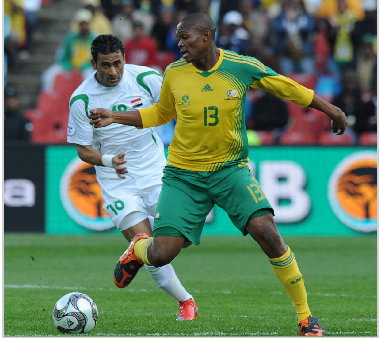
جنوب أفريقيا تحضر للمونديال في البرازيل

جوهانسبيرغ / وكالات بدأمنتخب جنوب أفريقيا الاسبوع الماضي مستعركه التدريبي في البرازيل استعدادا لنهائيات كأس العالم لكرة القدم التي تستضيفها بلاده صيف العام الجاري. ويبدو أن البرازيلي، باربرا المدير الفني لمنتخب «بافانا.. بافانا» (الأولاد) أراد البحث عن «غذاء الروح» في البرازيل الفائزة بالكأس العالمية خمس مرات. وقال باربرا أمام مجموعة من الصحفيين إن البرازيل هي «مهد الكرة العالمية» وأعرب عن رغبته في استلها لاعبي منتخب جنوب أفريقيا لهذه الروح قبل انطلاق المونديال. وافر باربرا أن منتخب الأولاد ليس له سماته الخاصة بسبب تعدد المدربين الذين تعاقبوا عليه. واختلاف مدارسهم الكروية. وأكد عزمه تعزيز أوضاع منتخب جنوب أفريقيا خلال المعسكر الذي يستمر لمدة شهر بمدينة تيرسبوليس التي تبعد حوالي 90 كيلومترا عن ريو دي جانيرو. وقرر المدير الفني اقامة مباريات تدريبية قوية مع أندية القمة في البرازيل مثل فلامينجو وسانتوس وبالميراس. بالإضافة إلى مباراة دولية مع باراجواي في الحادي والثلاثين من الشهر الجاري. وفي أعقاب المعسكر التدريبي البرازيلي، يتوجه منتخب جنوب أفريقيا في محطته التدريبية الثانية والتي تستمر ثلاثة أسابيع في ألمانيا. يلعب منتخب الأولاد في المجموعة الأولى التي تضم أيضا منتخبات أوروغواي وفرنسا والمكسيك.