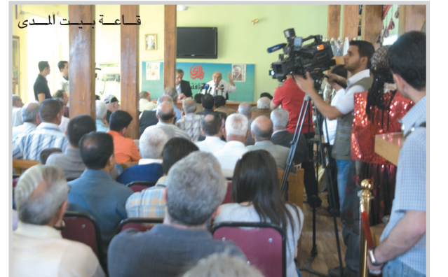
قاعة بيت المدى