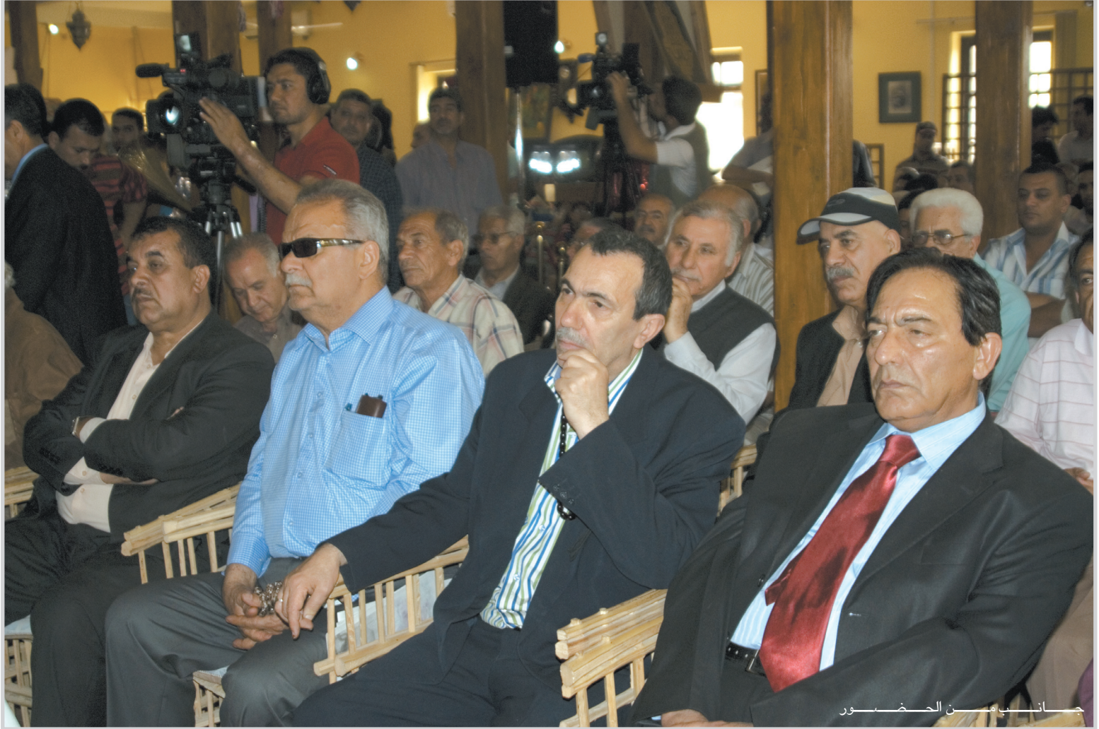
بلند الحيدري في الحضور