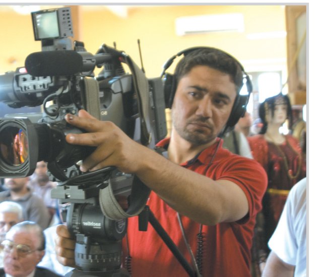
مصور تلفزيوني يتابع الحدث

بلند الحيدري قامه من قامات الشعر العراقي المجددة التي امتطت صهوة الحداثة مبكراً