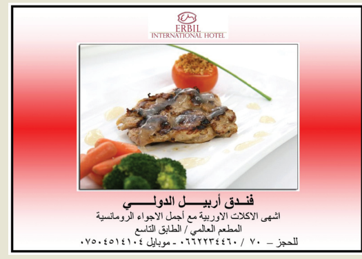
فندق أربيل للسياحة والسياحة الشي الكائنات الأثرية مع أهل الأجر الرومانية المعلم العالمي / الطابق التاسع للحجز - ٧٠ / ٠٦٦٢٢٤٤١٠ - موبيل ٠٧٥٠٤٥١٤١٠