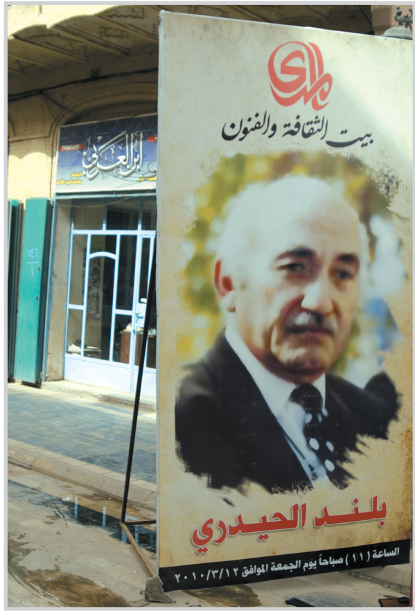
صورة بلند الحيدري في شارع المتنبي