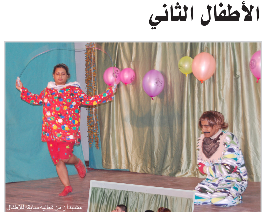
مشهدان من فعالية سابقة للأطفال