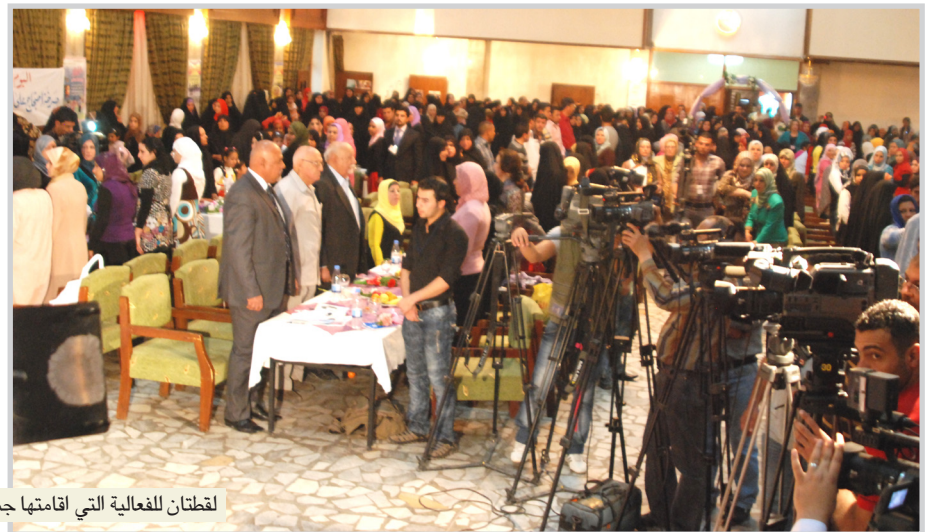
لقطان للغة التي اقامتها جمعية الثقافة للجميع

في أحد أركان القاعة جلست امرأة في العقد الخامس من عمرها، اقتربت