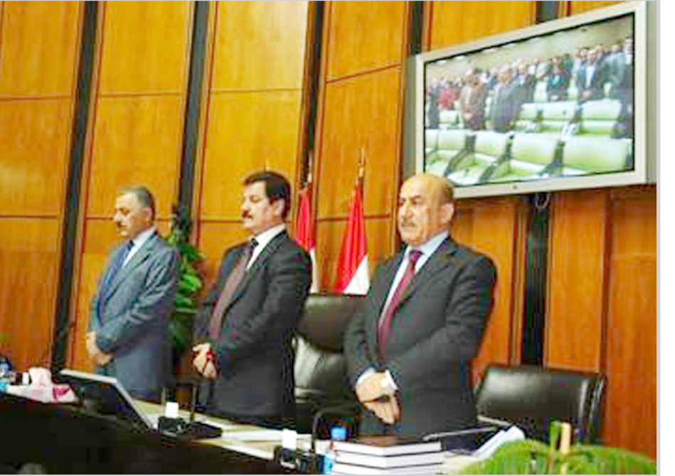
الجلسة الانتخابية للبرلمان

أربيل / سالي جودت افتتح برلمان كردستان برئاسة الدكتور كمال كركوكي رئيس البرلمان وحضور الدكتور أرسلان بايز نائب رئيس البرلمان وفرفت أحمد سكرتير البرلمان، الجلسة الافتتاحية للدورة الانعقادية الثانية للسنة الأولى من الدورة الانتخابية الثالثة التي استهلته بالوقوف دقيقة واحدة لإجلالاً لأرواح الطاهرة لشهداء كردستان العراق. بعد ها ألقى رئيس البرلمان كلمة أشار فيها الى نكريات أحداث شهر آذار السعيدة والمنامة، وانتخابات مجلس النواب مستعرضا عدد الجلسات التي عقدت خلال الدورة الانعقادية الأولى، والاعتدائية منها والاستثنائية، والقوانين التي سنت والقرارات التي أصدرت والمشاريع التي قرنت، فضلا عن التطرق الى مواضيع أخرى مهمة، متمنياً أن تسير المهام خلال الدورة الجديدة بشكل أفضل. وخاطب كركوكي أعضاء البرلمان قائلاً بحسب موقع البرلمان : نحن جميعا بحاجة الى بعضنا البعض، وإن ما يوجهنا نحو النجاح هو وحدة الصف والموقف، لذا فمن المهم والضروري أن ننقل ونتحمل بعضنا، وأن تكون صورتنا واسعة وتوجهاتنا السياسية حرة للغاية، وأن لا يسمح لأحد أو طرف منا لنفسه ان يوجه أصبعه الى أي شخص أو طرف بسبب حرية الرأي وأن نحترم جميعا القانون ونسعى في إقليم كردستان الى الالتزام به أكثر وتترسخ العملية الديمقراطية وتقدم أكثر. ويجب أن نتعامل مع الذين يعيشون معنا داخل إقليم كردستان مثل الأخوة التركمان والكلدان السريان الآشوريين والعرب