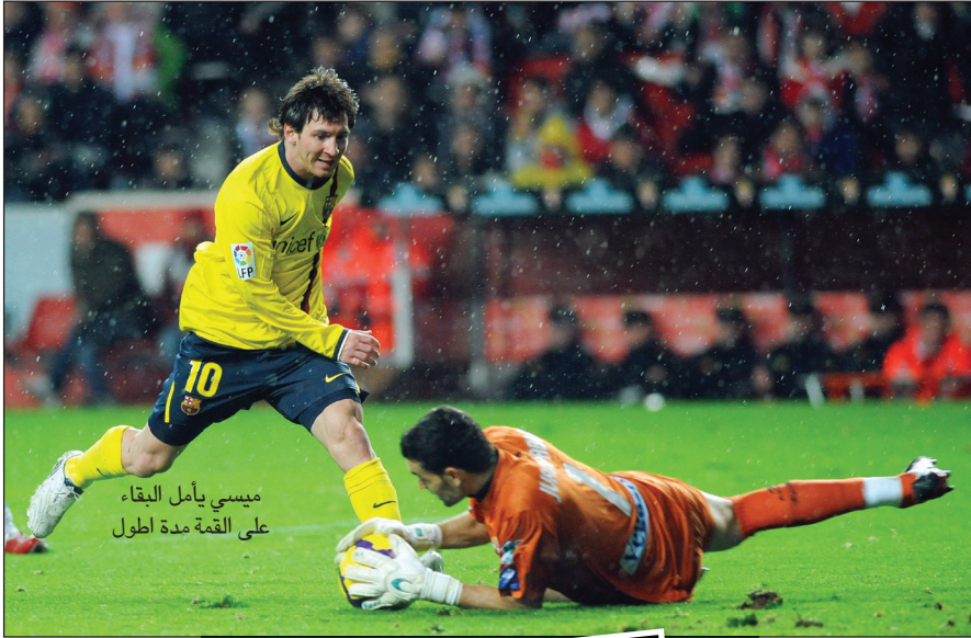
ميسي يأمل البقاء على القمة مدة أطول