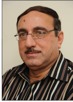
الدوحة / صفاء العبد