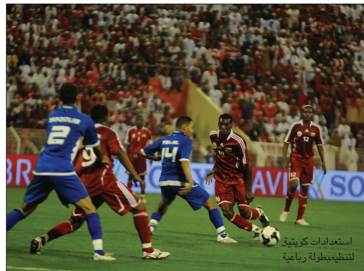
استعدادات كويتية لتتخطى بطولة رباعية