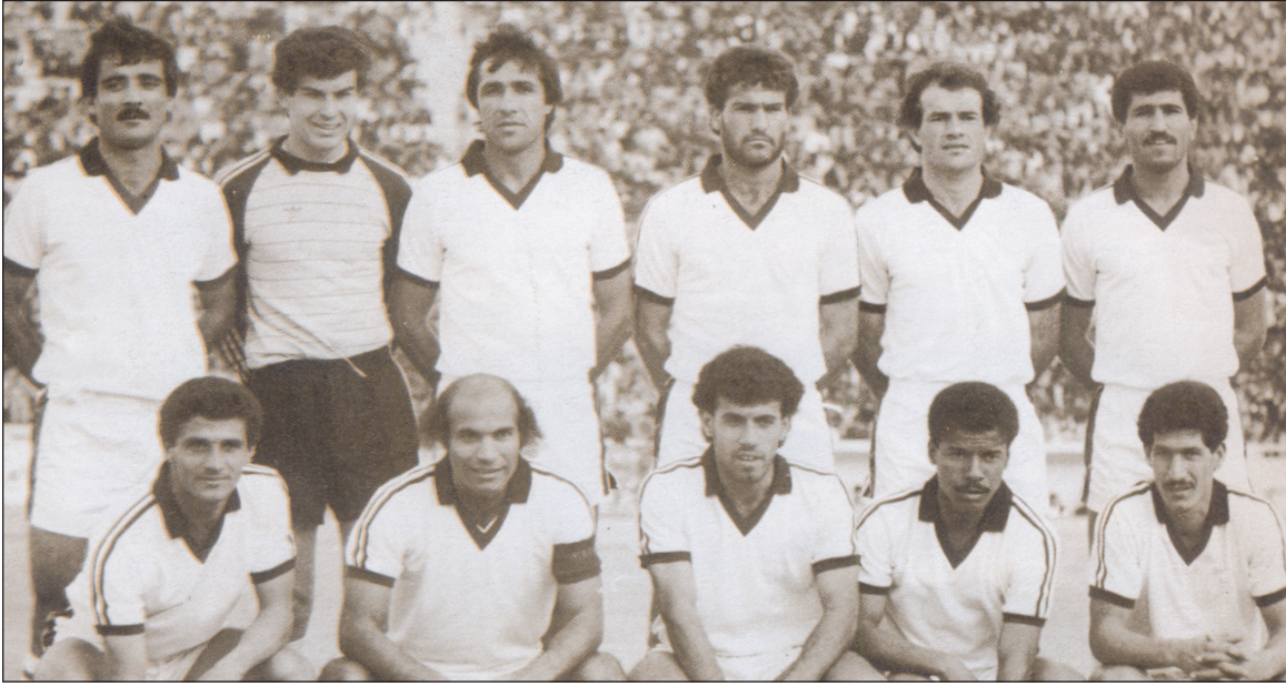
الثاني من اليسار وقوفاً مع كوكبة الزوراء الشبابية