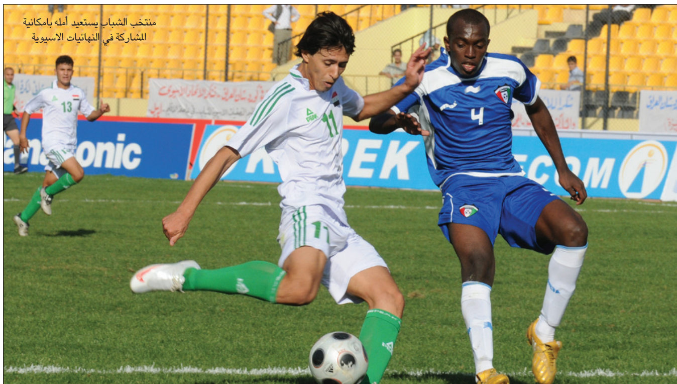
منتخب الشباب يستعيد أمله بإمكانية المشاركة في النهائيات الآسيوية