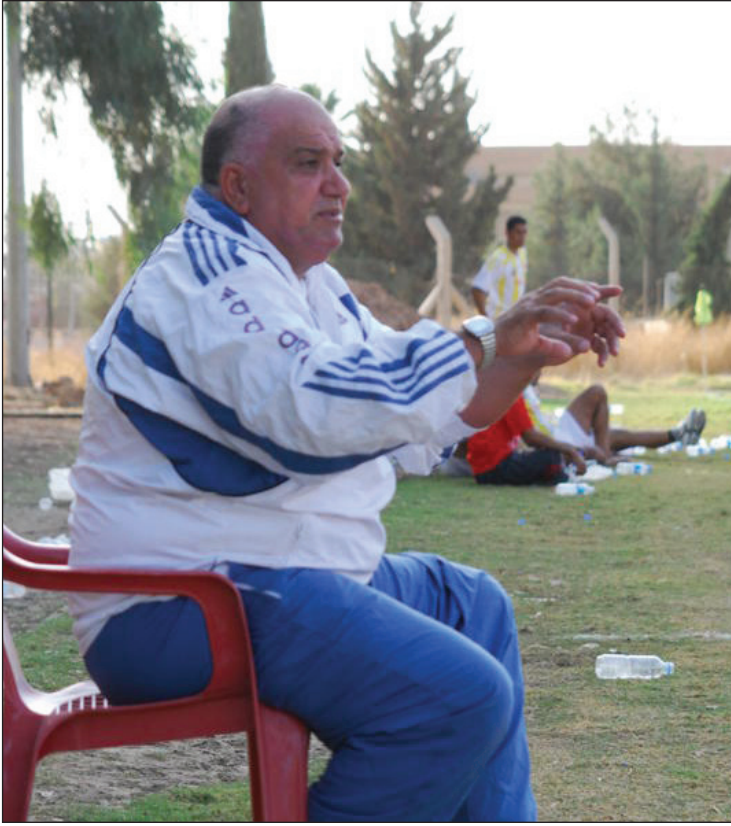
وهاب يطمح ببقاء صلاح الدين في الممتاز