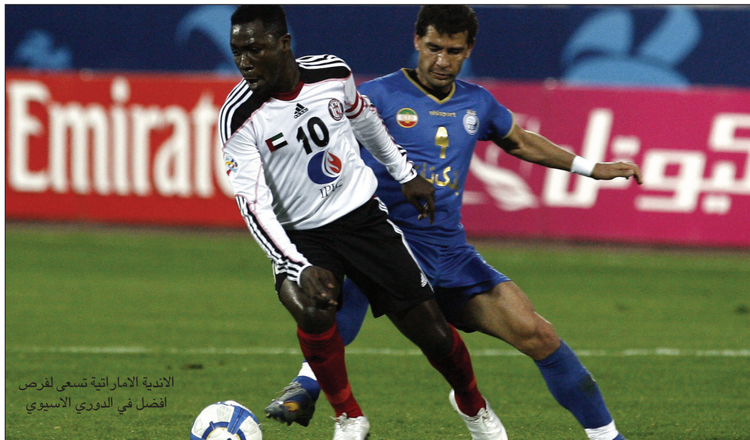
الاندية الاماراتية تسعى لفرص افضل في الدوري الآسيوي