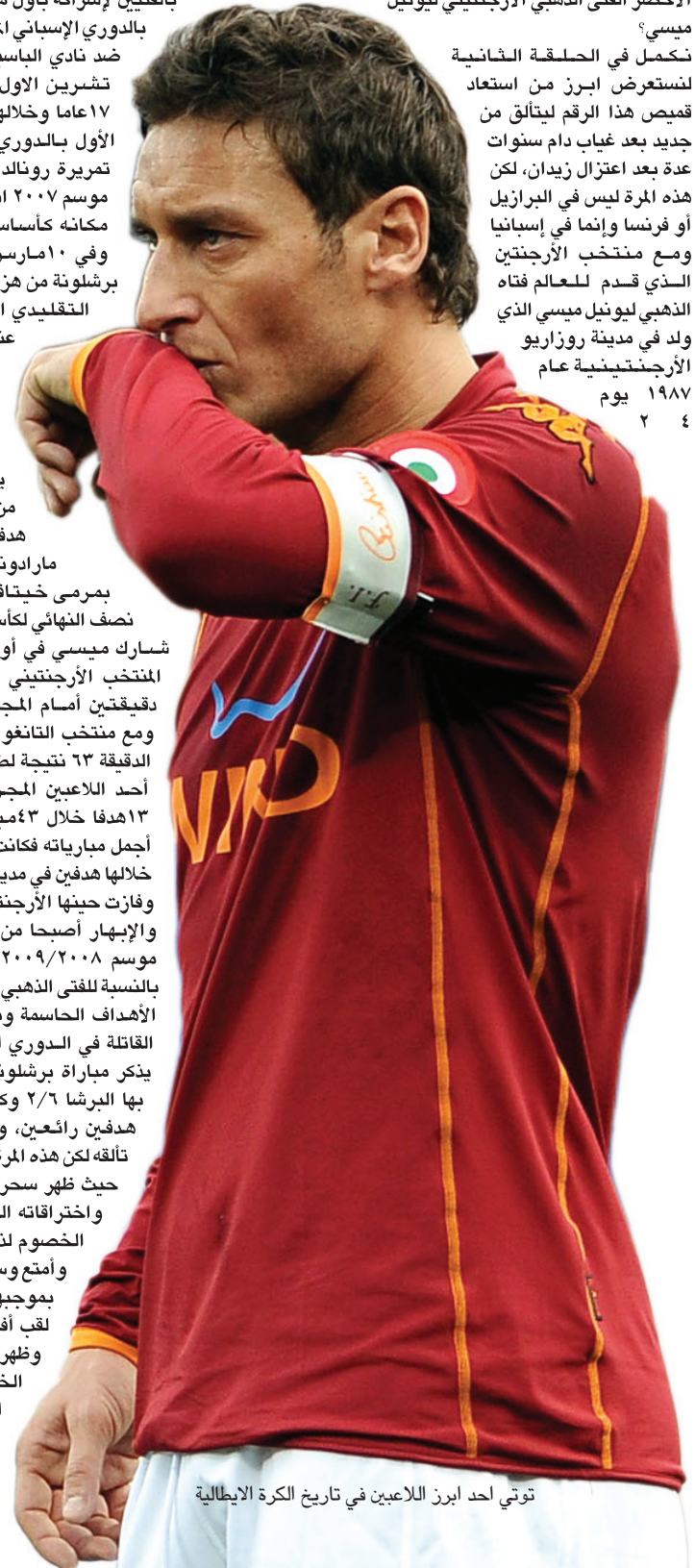
توتي أحد أبرز اللاعبين في تاريخ الكرة الإيطالية

تكمّل في الحلقة الثانية لنستعرض أبرز من استعاد قميص هذا الرقم ليتألق من جديد بعد غياب دام سنوات عدة بعد اعتزال زيدان، لكن هذه المرة ليس في البرازيل أو فرنسا وإنما في إسبانيا ومع منتخب الأرجنتين الذي قدم للعالم فتاه الذهبي ليونيل ميسي الذي ولد في مدينة روزاريو الأرجنتينية عام ١٩٨٧ يوم ٢٤