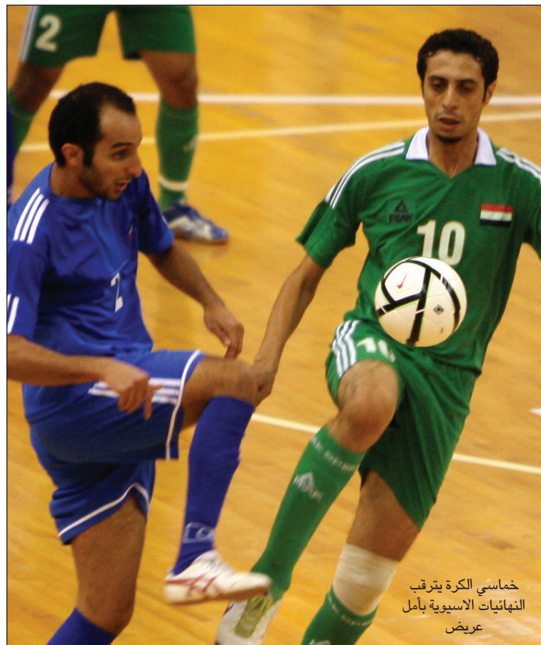
خماسي الكرة يترقب النهائيات الآسيوية بأمل عريض

ومرورا بنجوم فترة السبعينيات والثمانينيات التي وقف على مسرحها لاعبون مازال الجمهور يتذكرهم بكل احترام لأن اصحابها حققوا الكثير من الانجازات الكبيرة ومنهم الحارس رعد حمودي الذي يقود دفعة اللجنة الاولمبية حاليا..حسين سعيد رئيس الاتحاد العراقي لكرة القدم الحالي..الكابتن عدنان درجال..ناظم شاكر وفلاح حسن ومعهم (نخبة) من ابرز لاعبي الكرة العراقية الذين توزعت اسماءهم على مرافق العمل التدريبي أو الإداري وتمكنوا من تحقيق انجازات تفتخر بها اللعبة الشعبية الأولى في العراق..وانتهاء بلاعبي فترة التسعينيات التي يقف في صدارتهم الكابتن راضي شنيشل،أحمد راضي،علاء كاظم،نعيم صدام،حبيب جعفر وغيرهم من سحرة الكرة المستديرة وحتى يومنا الحاضر الذي يشهد كل يوم ولادة نجم جديد بكرة القدم العراقية!