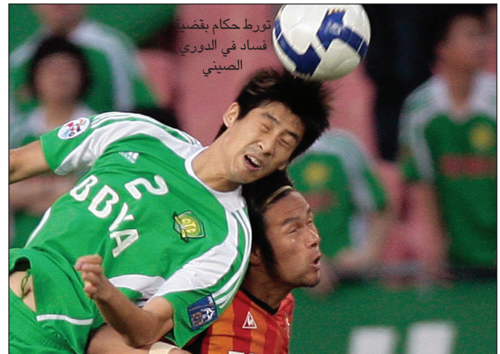
تورط حكام بقضية فساد في الدوري الصيني

يذكر أن (الحكم لو) أدار مباريات في نهائيات كأس العالم ٢٠٠٢ وحصل على لقب الصفارة الذهبية لقراراته التحكيمية النزيهة.