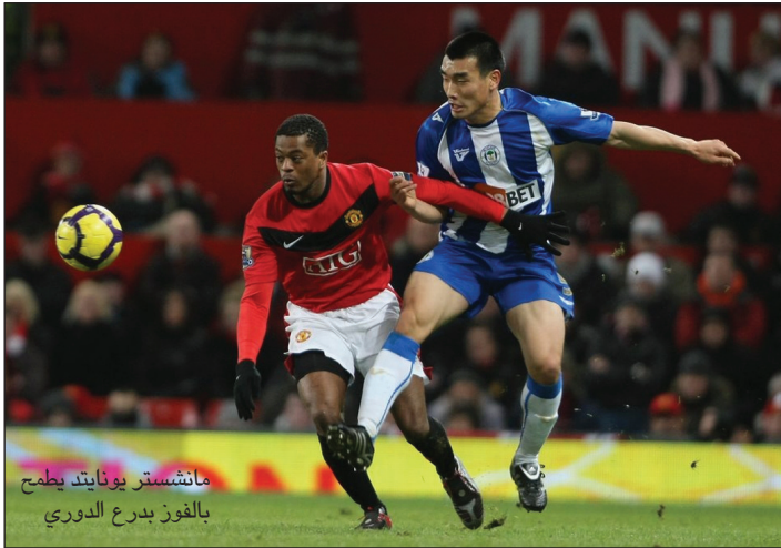
مانشستر يونايتد يطمح بالفوز بدرع الدوري

يتساءل الجميع عن السبب الحقيقي الكامن وراء ذلك المجهود الكبير الذي يبذله النجم باتريس إيفرا على أرض الملعب، والجواب أيضاً يوجد على أرضية المستطيل الأخضر، فالظهير الأيسر لمانشستر يونايتد والمنتخب الفرنسي يطوي من جهة كل تلك الكيلومترات لإيقاف لاعبي الأجنحة المنافسين، ومن جهة أخرى لمد يد العون لمهاجمي فريقه. ولا يسعى اللاعب السابق لنادي موناكو من وراء مجهوداته هذه لمزيد من النجاح والأعجاب، فقد فاز مع ناديه بجميع البطولات الكبرى، حيث توج بلقب دوري أبطال أوروبا، وكأس العالم للأندية، كما أنه لا يركض لئمال التقدير والعرفان، فقد سبق واختير أحسن ظهير أيسر في الدوري الإنكليزي موسم ٢٠٠٦-٢٠٠٧، وأيضاً أحسن ظهير في العالم سنة ٢٠٠٩. حسب الإستطلاع الذي أجرته FIFA/FIFPro World XI، الذي يتم فيه اختيار أحسن ١١ لاعباً في السنة.