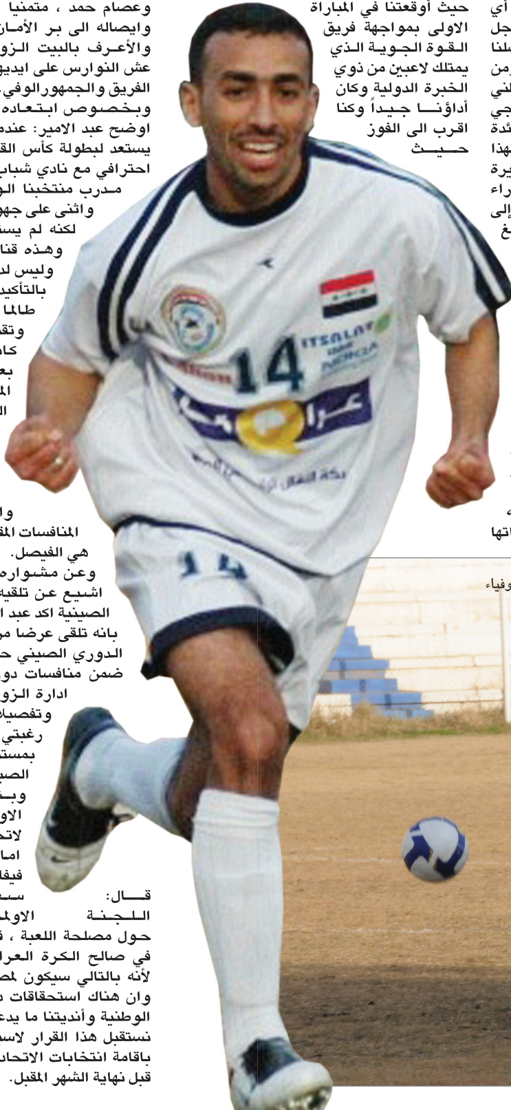
الزوراء يكمل مشواره بقيادة ابنائه الافياء

وبشأن قرار اللجنة الاولمبية بتعليق قرار حلها لاتحاد الكرة وفسح المجال امام الجهد التشاوري مع فيفا لإيجاد مخرج للالزمة سعدت كثيرا بالتفاته اللجنة الاولمبية الوطنية العراقية حول مصلحة اللعبة ، فانا مع أي قرار يصب في صالح الكرة العراقية ويخدمنا كلاعبين لأنه بالتالي سيكون لمصلحة العراق خصوصا وان هناك استحقاقات دولية تنتظر منتخباتنا الوطنية وأنديتنا ما يدعونا الى التفاؤل ونحن نستقبل هذا القرار لاسيما وان هناك ضمانات باقامة انتخابات الاتحاد العراقي المركزي للعبة قبل نهاية الشهر المقبل.