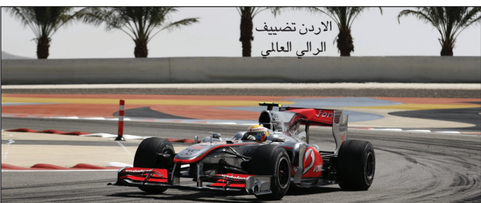
الاردن تضيف الرالي العالمي