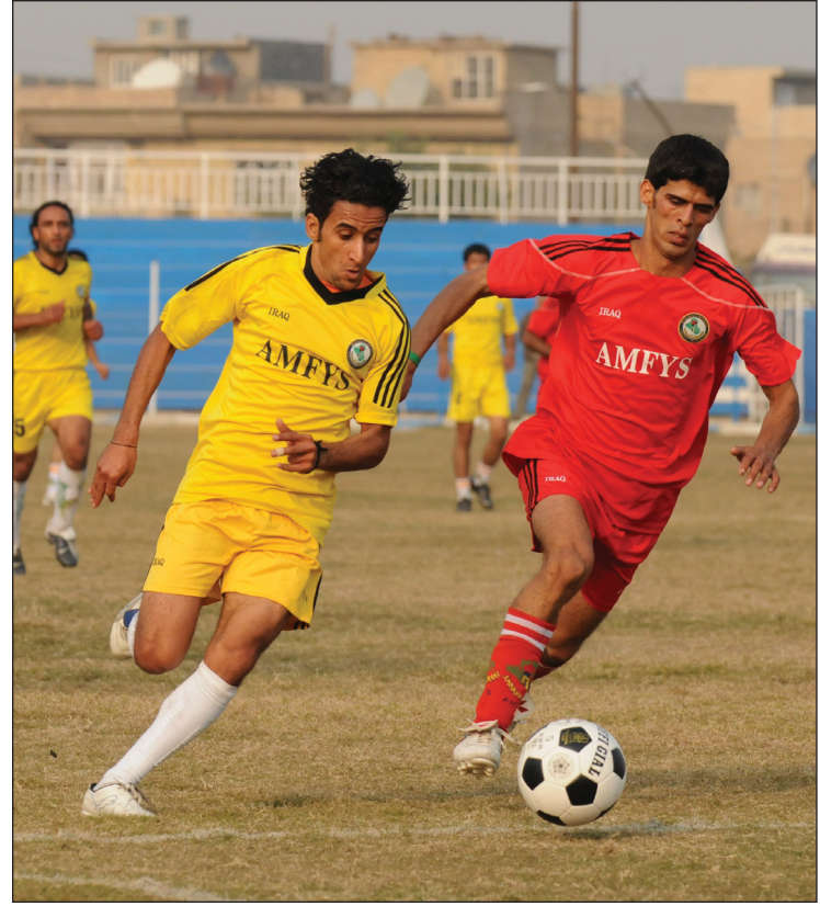
جانب من منافسات الفرق المغمورة في الدوري