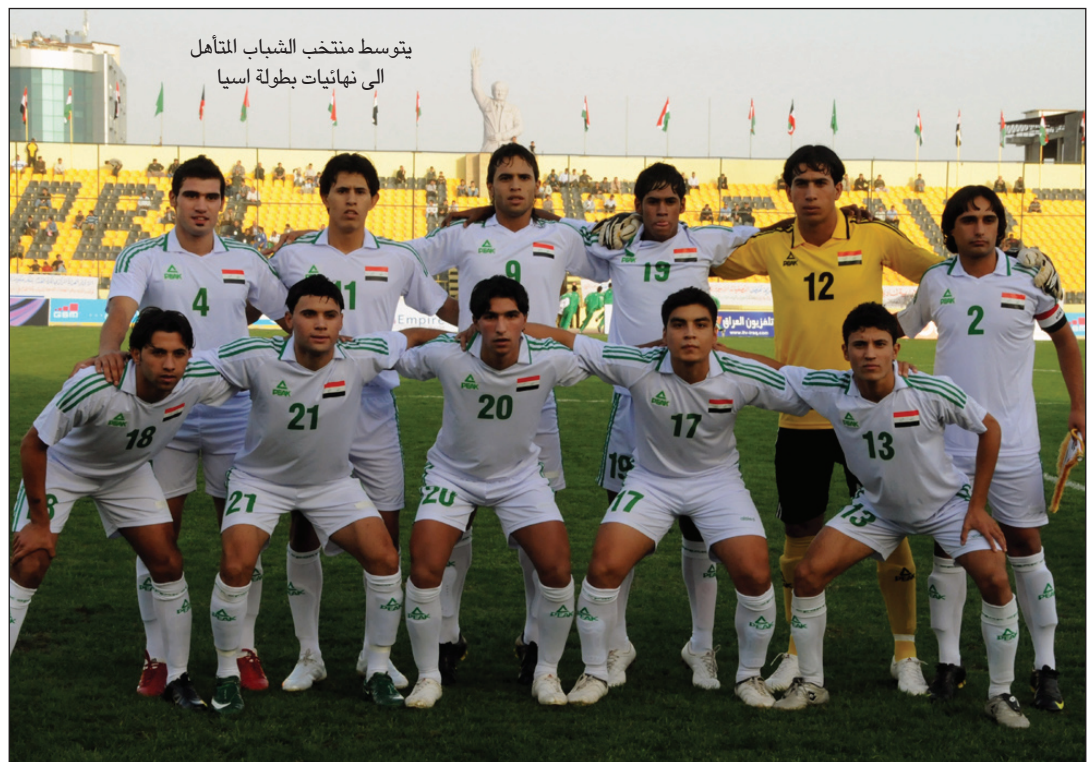
يتوسط منتخب الشباب التأهل الى نهائيات بطولة اسيا