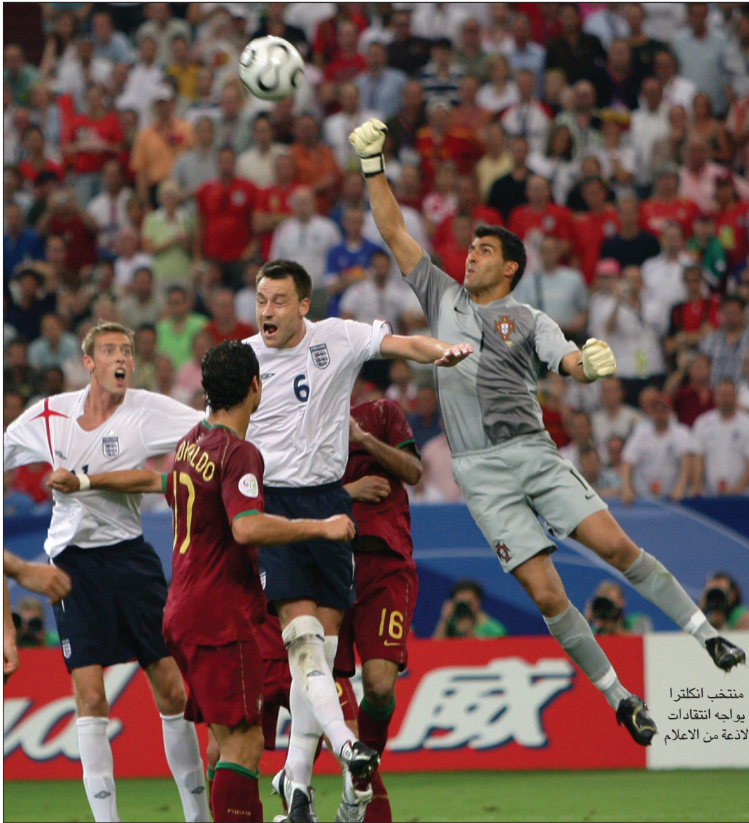
منتخب انكلترا يواجه انتقادات لاذعة من الاعلام

٢٠ ألف استرليني. ووضحت الصحيفة أنه يعيش الآن برفقة والديه في قصر مكون من خمس غرف نوم قيمته ٣ ملايين استرليني في منطقة هيميل همبستد. شمالي العاصمة البريطانية.