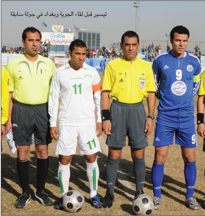
تيسير قبل لقاء الجوية وبغداد في جولة سابقة

الفرق تنظر لنا نظرة اعتيادية أو أقل من ذلك لتواضع مستوى الفريق الصاعد توا للأضواء بالمقارنة مع الفرق التي تخوض منافسات الدوري الممتاز منذ مواسم عدة فكننا بذلك متحررين من الشد العصبي وهذا يجعلنا نقدم مستوى رائعاً نتوج جهودنا فيه بحصيلة جيدة من الأهداف وتوضح ذلك جليا عندما حققنا الفوز على الفرق الجماهيرية الكبيرة وتميزنا بالتسجيل في الشوط الأول وحسم نتيجة المباراة لصالحنا لكن فطنت لنا أغلب الفرق في المرحلة الثانية وحسبت حساباتها بدقة ومع هذا لم نخسر سوى مباراة واحدة أمام فريق دهوك في تحديد المركزين الثالث والرابع .