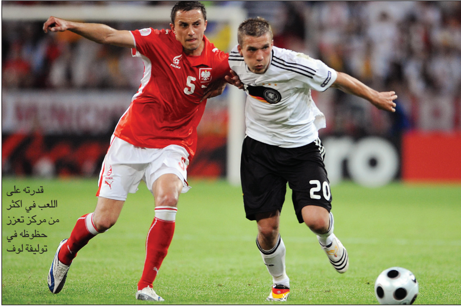
قدرته على اللعب في أكثر من مركز تعزز حظوظه في توليفة لوف