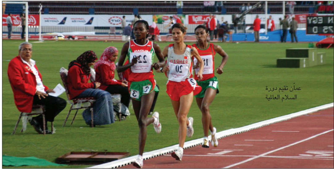
عمان تقيم دورة السلام العالمية