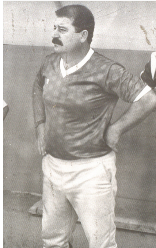
وظف مسيرته التدريبية في خدمة شباب الطيران