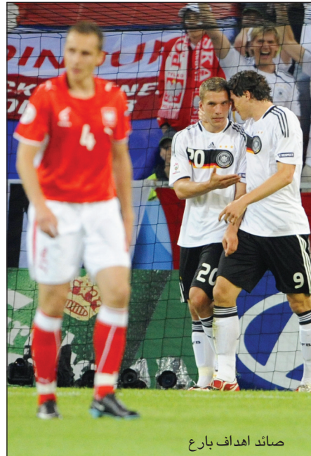
صائد أهداف بارع

«بصراحة، مسألة في أي مركز ألعب، لا تشغل بالي كثيراً، ففي صفوف المنتخب لعبت على الجهة اليسرى وفي مركز رأس الحربة، في مواجهة منتخبات عريقة، لدي ما يكفي من الخبرة لكي أتأقلم مع