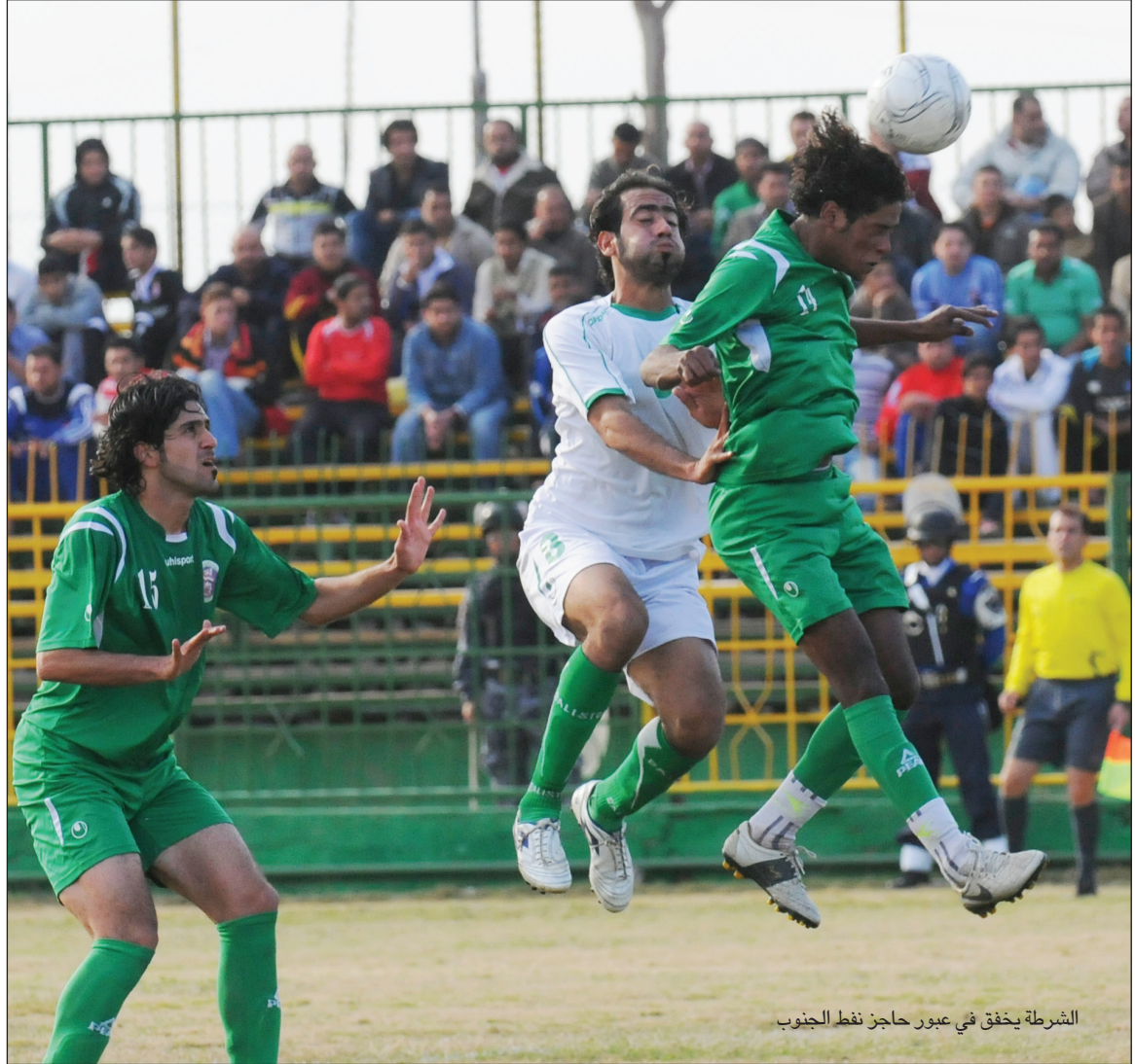
الشرطة يخفق في عبور حاجز نفط الجنوب