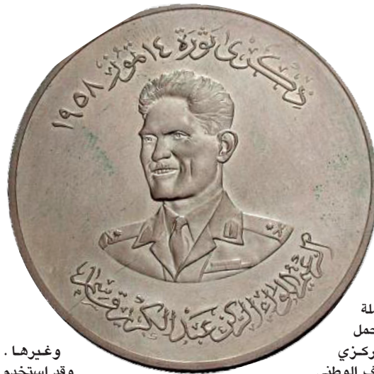
بإصدار عملة جديدة تحمل

فئة خمسة فلوس . كما الغيت المسكوكة النقدية من فئة ٢٠ فلسا (القران) واستبدلت بمسكوكة جديدة من فئة ٢٥ فلسا . ومن الطريف الذي يذكر في هذا المجال انه في احدي التظاهرات الجماهيرية التي حصلت بعد اصدار العملة الجديدة ارتفعت الاهازيج بالهتاف بالشعار التالي (عاش الزعيم الزيد العانة فلس) ، تعبيراً عن مظاهر التأييد لاجراءات الحكومة في اصدار العملة الجديدة . وبالإضافة الى ما سبق فقد تم تغيير شكل المسكوكة النقدية من فئة ١ فلس اذ اصبحت بشكل معشر ذي حافات مستوية بدلا من الشكل المدور القديم . وبالنسبة للتصميم فقد وضع الشعار الجمهوري على وجه المسكوكة ، اما في الظهر فقد وضعت عبارة (الجمهورية العراقية) في الاعلى بينما تم وضع سعفتين مقوستين ومتقاطعتين في الاسفل ، في حين وضع في الوسط دائرة صغيرة فيها فئة المسكوكة وتحته سنة الاصدار بالتقويم الهجري والميلادي والتي كانت (١٣٧٩ - ١٩٥٩) . جميع المسكوكات النقدية كانت من النيكل باستثناء مسكوكة الفلوس فقد كانت مصنوعة من البرونز . اما فيما يخص العملات الورقية الجديدة فهي لم تختلف كثيرا عن اخر اصدار حصل في عهد الملك فيصل الثاني من ناحية فئاتها او الواثنا وتصميماتها حيث كانت تتكون من فئات ربع دينار ، نصف دينار ، دينار واحد ، خمسة دنانير ، وعشرة دنانير . وقد وضع الشعار الجمهوري الجديد في مكان صورة الملك فيصل الثاني في الاصدار السابق ، كما حصل تغيير في ظهر الورقة النقدية من فئة دينار واحد حيث