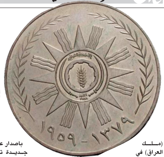
ملك العراق في

في مكان صورة الملك في الاصدارات السابقة بالنسبة للمسكوكات المعدنية فقد حصل بها بعض التغييرات التي جعلتها تختلف كثيرا عن الاصدارات السابقة وبالذات عن الاصدار الاخير الذي ظهر في عهد الملك فيصل الثاني . فقد الغيت المسكوكة النقدية من فئة ٢ فلس ، كما الغيت المسكوكة من فئة الاربعة فلوس (العانة) واستبدلت بمسكوكة جديدة من