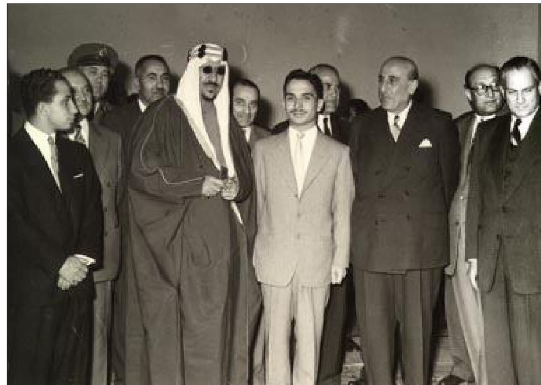
الملك فيصل الثاني وعدد من الزعماء العرب

الوقت ذاته جمعية الدفاع عن فلسطين التي طالبت بعقد مؤتمر عربي في بغداد يمثل الهيئات المدافعة عن فلسطين لتتسيق الموقف العربي .