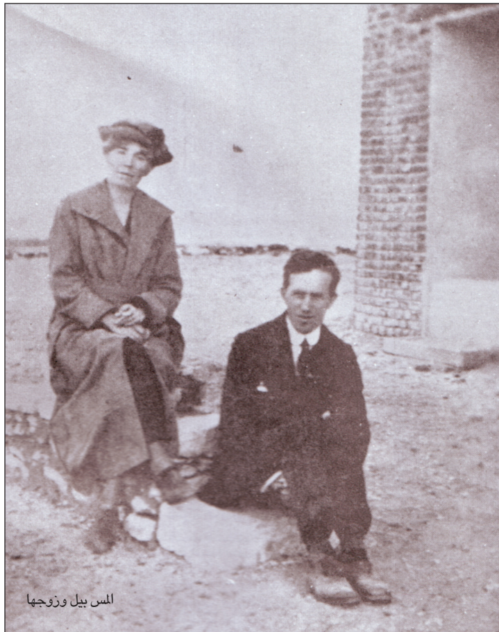
المس بيل وزوجها