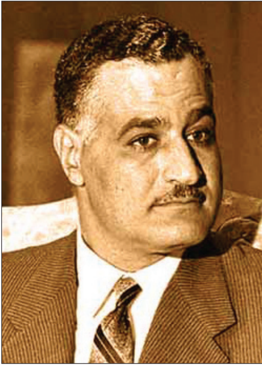
جمال عبد الناصر