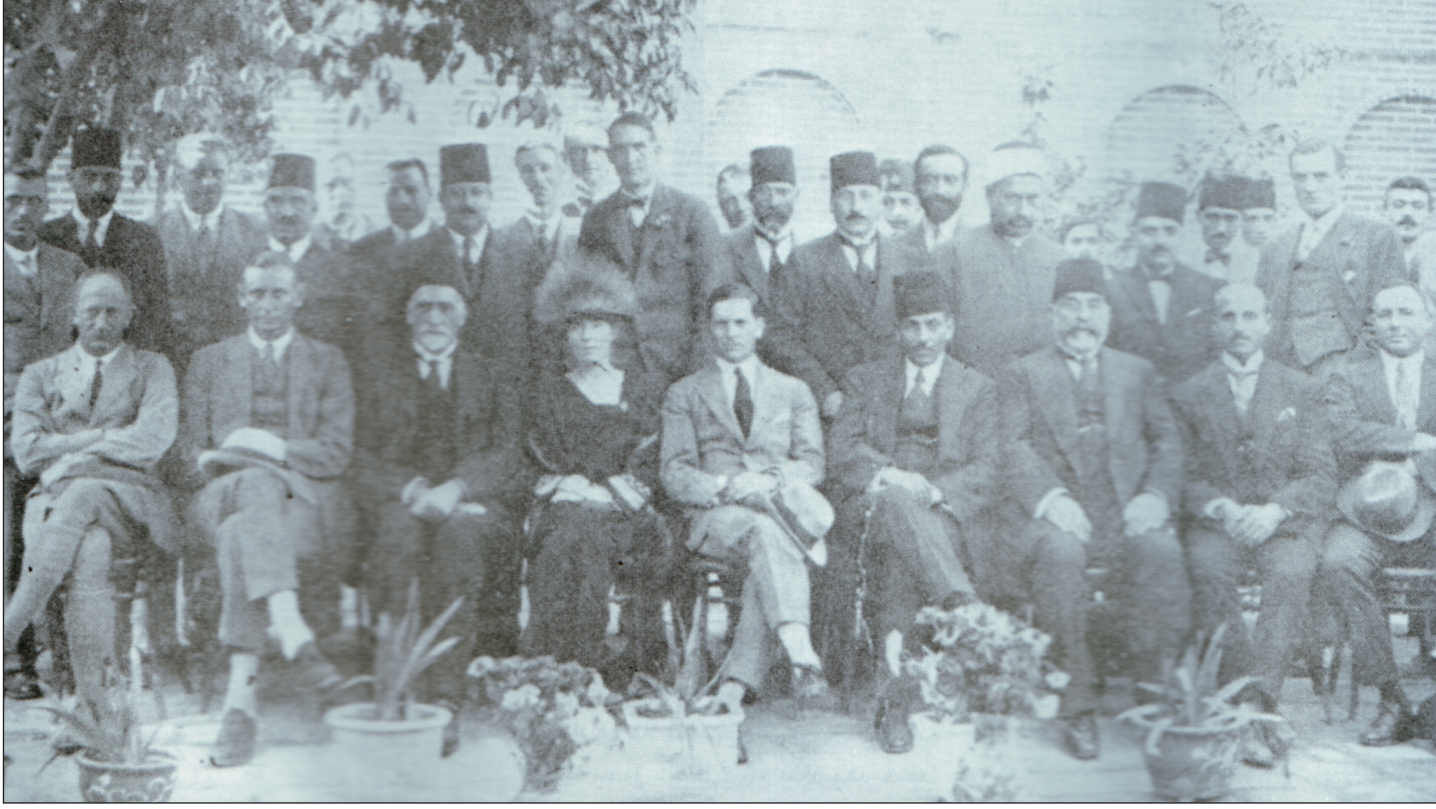
صورة تجمع عدد من الساسة العراقيين مع المس بيل