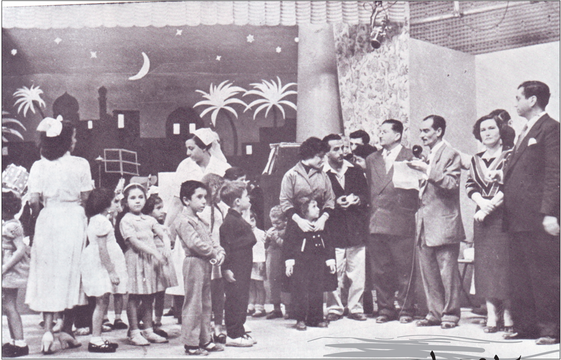
يوسف الجادرجي كما يبدو في برنامج عمو زكي