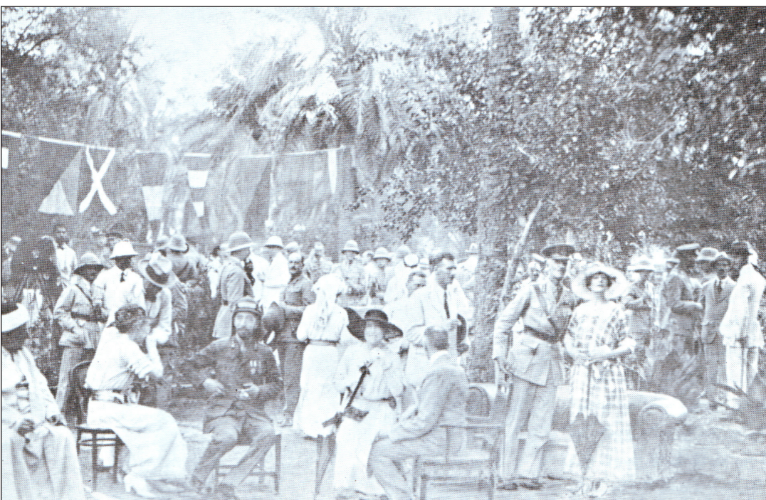
المس بيل والملك فيصل الاول

الطفل؟ الم ينفد بعد حليب امك في داخلك؟ ترجل من ظهر هذا الجواد الجميل، المسروق بلا ريب ودعني اعانك ايها الصبي التافه! اه اتعجز عن الترحل الا كما تفعل الدجاجة الكسيحة فوق كومة من الدمن؟