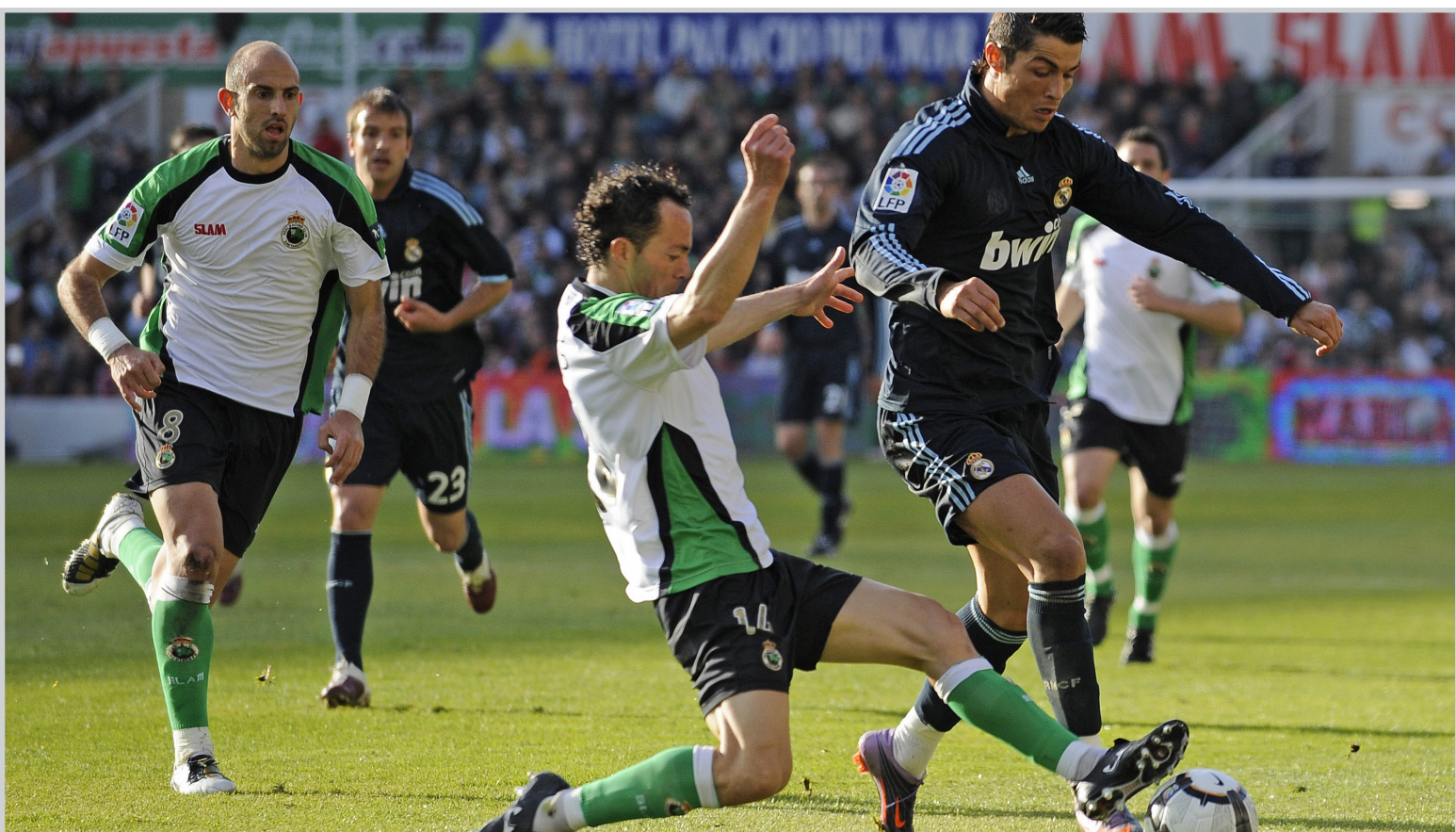
رونالدو سجل احد هدي الريال

الإبداع ، ولكنني سعيد بالصلاة التي أظهرناها اليوم». ووصف بيلغريني أداء فريقه خلال المباراة «بأنه عملي للغاية.. لقد وضعنا حلولاً للمشاكل التي عانيتنا منها في الدفاع وكنا دائماً متفوقين على راسينج». وفي وقت سابق ، عزز فريق فالنسيا موقعه في المركز الثالث بترتيب الدوري الإسباني بعد تغلبه على ضيفه أوساسونا بثلاثة أهداف نظيفة. وبيد فالنسيا بالفضل في هذا الفوز لمهاجمه الإسباني الدولي ديفيد فيا الذي أحرزه الهدفين الثاني والثالث للفريق قبيل نهاية المباراة. وسيطر بلنسية على مجريات اللعب منذ البداية وحتى النهاية أمام منافس نادرا ما خرج من منتصف ملعبه. وجاء الهدف الأول بعد مرور أربع دقائق من بداية الشوط الثاني عندما اخترق الواعد خوان ماتا من الناحية اليسرى ومرر الكرة إلى خواكين الذي سد كرة قوية بقدمه اليمنى عرفت طريقها للشباك. ولم يبد أن أوساسونا قادر على إرباك التعادل على ملعب ميستايا ، قبل أن يضيف فيا الهدف الثاني لأصحاب الأرض مستغلا تمريرة بابيلو. وتعرض فيا للتعرق داخل منطقة الجزاء من جانب حارس أوساسونا ريكاردو في الوقت بدل الضائع ليحصل فالنسيا على ركلة جزاء