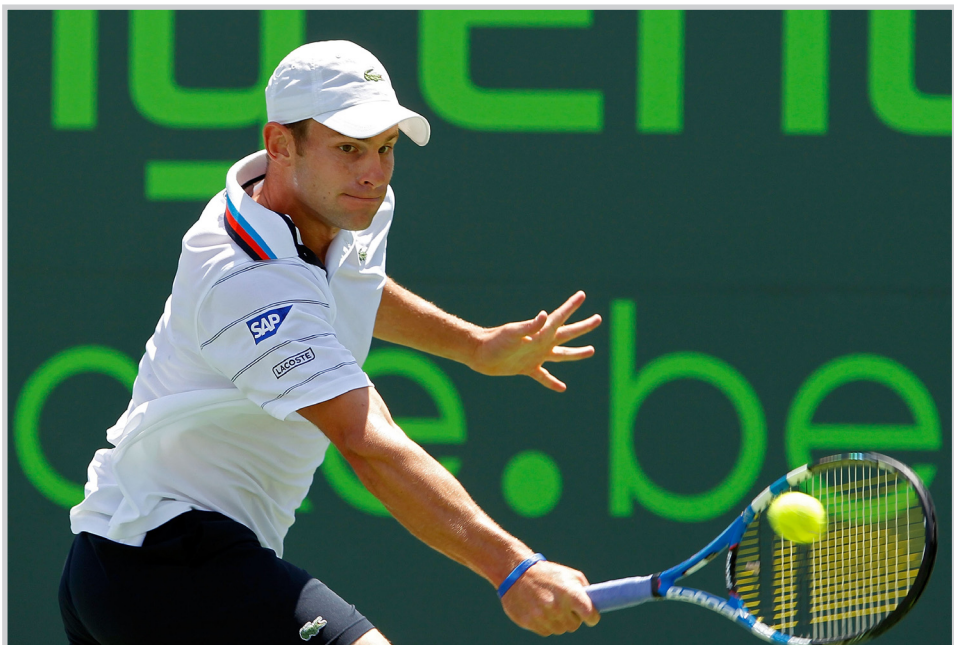
الأمريكي روديك يعود الى صفوف المصنفين

ميامي / وكالات واصل الأمريكي أندي روديك حملته للعودة إلى صفوف المصنفين الخمس الأوائل على مستوى العالم عبر الفوز بأول لقب له في بطولات أساتذة التنس منذ نحو أربعة أعوام عندما تغلب على التشيكي توماس برديتش ٥/٧ و ٤/٦ في المباراة النهائية لبطولة ميامي للأساتذة ليتوج بلقب البطولة التي تبلغ مجموع جوائزها تسعة ملايين دولار. وحقق روديك المصنف الثامن على إنديان ويلز للأساتذة بلقبه من بطولة ميامي في عام ٢٠٠٦. وعض روديك إخفاقه في إحراز لقب بطولة إنديان ويلز للأساتذة قبل نحو أسبوعين عندما خسر في المباراة النهائية أمام الكرواتي إيفان ليوبيسيتش. وقال روديك «إنه لقب كبير لي ، شعرت بقليل من الضغوط في طريق الفوز بهذا