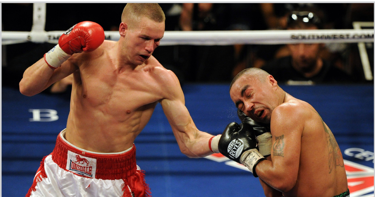
هاي يسدد لكمة منافسه روين

الثقل، وسأعمل على تقديم أفضل أداء لي في المواجهتين، لكنه لم يكن محتمسا لتكرار المواجهة مع فالوفيق بقوله: إذا عاد الخبر لي فلا أريد أن يكون نزالي التالي مع فالوفيق. سارتاح قليلا ثم تحدث بالامر. وتابع: كنت مرتاحا لادائي مع فالوفيف (٢١٨ م) حسب العقد الذي وقعه معه قبل المواجهة الأولى بينهما اواخر العام الماضي. وقال هاي: أريد الفوز باللقبين الآخرين في الوزن