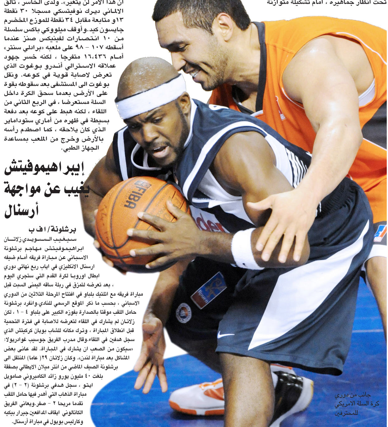
جانب من دوري كرة السلة الأمريكي للمحترفين

واشنطن / اف ب ضرب اوكلاهوما ثاندن عصقورين بحجر واحد عندما هزم دالاس مافريكس متصدر مجموعة الجنوب الغربي ١٢١ - ١١٦ وتأهل الى بلاي أوف دوري كرة السلة الأميركي للمحترفين في كرة السلة. فعلى ملعب «أميريكان إيرلاينز سنتر» في تكساس وأمام ٢٠,٣٢٩ متفرجا ، سقط مافريكس تحت أنظار جماهيره ، أمام تشكيلة متوازنة