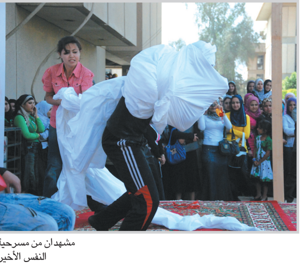
مشاهدان من مسرحية النفس الأخير