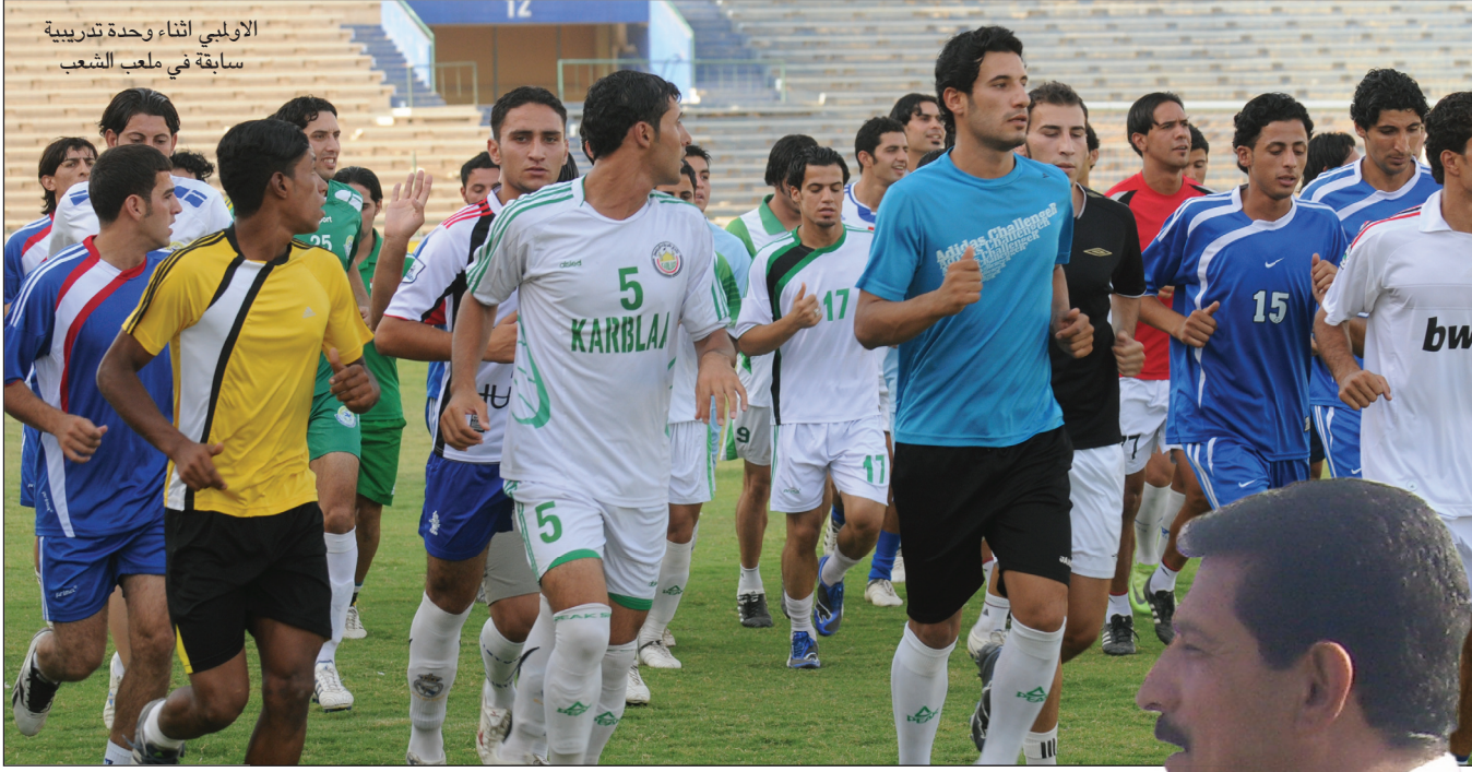
الاولمبي اثناء وحدة تدريبية سابقة في ملعب الشعب