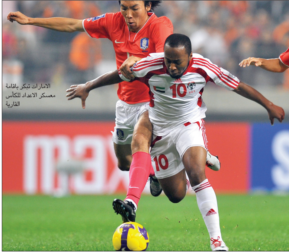
الامارات تبكر باقامة معسكر الاعداد للكأس القارية