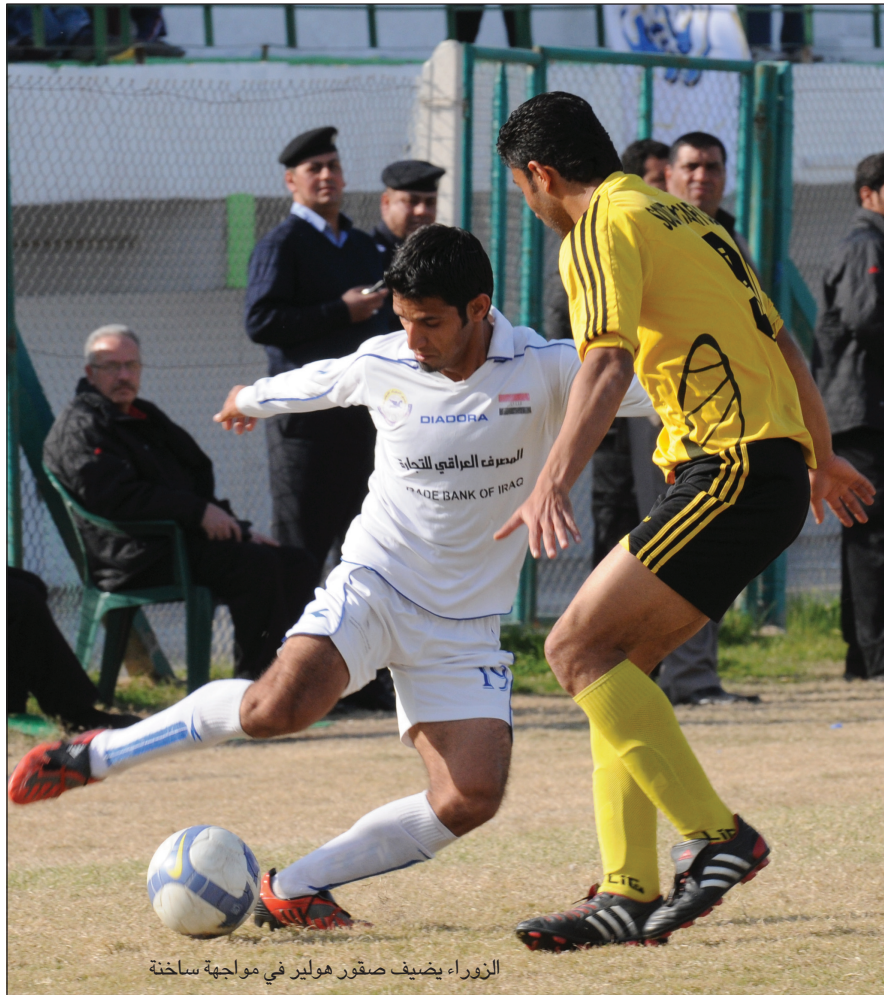
الزوراء يضيف صقور هولير في مواجهة ساخنة

ويلعب السماوة مع فريق الحدود على ملعبه في مباراة لتحسين المركزين لكلا الفريقين.. وتختتم منافسات اليوم المذكور بمباراة فريقي الميناء والناصرية على ملعب الاول.