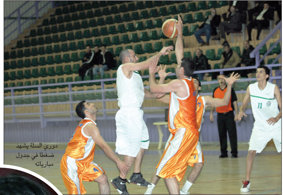
دوري السلة يشهد ضغطا في جدول مبارياته