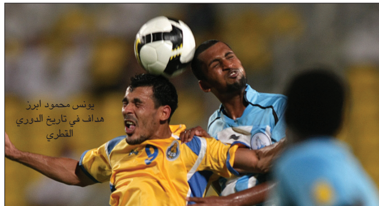
يونس محمود ابرز هداف في تاريخ الدوري القطري

من تحقيق انجاز كبير له وللنادي عندما احرز لوحده ثلاثة اهداف كبيرة في مرمى نادي السد وذلك في المباراة النهائية لبطولة كأس أمير دولة قطر.. وعماد محمد هو أحد افراد العائلة العراقية التي انتمت لنادي الغرافة وعكس هذا اللاعب امكانيات اكثر من رائعة في الملعب واعطى صورة ايجابية عن سلوك اللاعبين العراقيين الذين احترفوا اللعب في الأندية القطرية بعد ان فتحت هذه الدولة العربية صورا مسؤوليتها قبل ابوابها للرياضيين العراقيين في وقت سدت بوجههم جميع الابواب!!