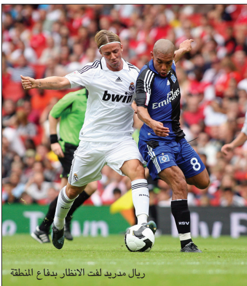
ريال مدريد لفت الانظار بدفاع المنطقة

أجمل ما في كرة القدم هي الخصوصية والتميز بين الفرق ومن خلال مشاهدتنا المستمرة لدوريات الأوروبية لاحظنا بان المدرب التشيلي بيليغريني مدرب فريق ريال مدريد قد جاء بمفهوم جديد او بطريقة لعب مميزة لفت أنظار الناقد والمحللين وهي طريقة الضغط على الفريق الخصم بمبدأ دفاع المنطقة المتقدم وحصر اللعب في مساحات معينة بحيث شاهدنا خلال المرحلة الأولى من الدوري الاسباني طريقة بيليغريني المدهشة في الحيازة على الكرة وفرض إيقاعه على الفريق الخصم، وقد عزز هذا المدرب نظرية الضغط على الخصم بأكثر من سبعة لاعبين وفي مساحات لا تتجاوز 10 X 10 يزداد شدة الضغط مع إيقاع اللعب وسرعته وطريقته باختصار هو عمل طوق عددي او كماشة على شكل منحى تكون من ثلاثيات او رباعيات وعند استحواذ الكرة يتم لعب الكرة على الفراغ المناسب مع تغيير اتجاه اللعب واستخدام انطلاقات رونالدو او كاكابو وسرع عالية وقد شاهدنا ثلاثيات (ديارال، كاكابو، الونسو، جرانيرو، رونالدو، هيغوين، بنزيمة وغوتي) مع الانتقال الفوري من 4-3-3 إلى 4-3-2 بوجود زيادة عددية بصعود الظهيرين اربيلوا وراموس، ويعتقد النقاد إن هذه الطريقة هي الأنسب للحد من خطورة البرسا وإن حظوظ النادي الملكي بالفوز بلبق الدوري عالية والفضل يعود إلى طريقة أسلوبه الجديد.