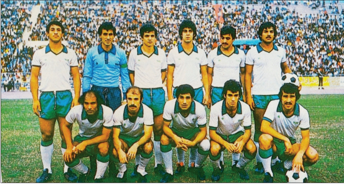
واثق اسود في فوز العراق بكأس الخليج ١٩٧٩