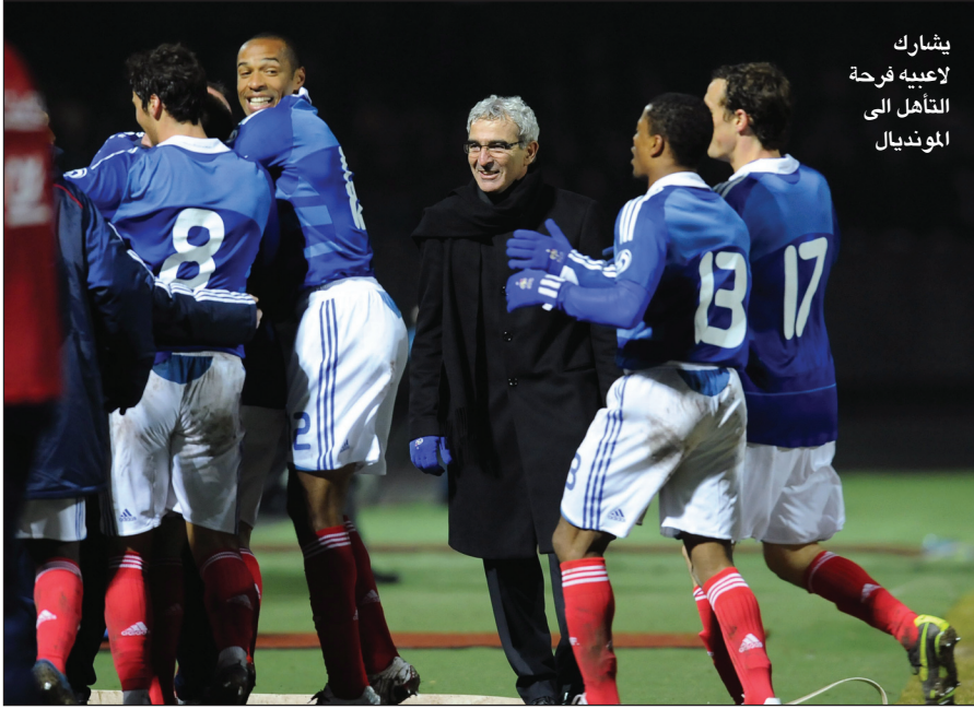
يشارك لاعبيه فرحة التأهل إلى المونديال