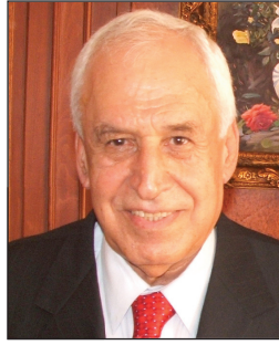
بقلم / مؤيد البدري