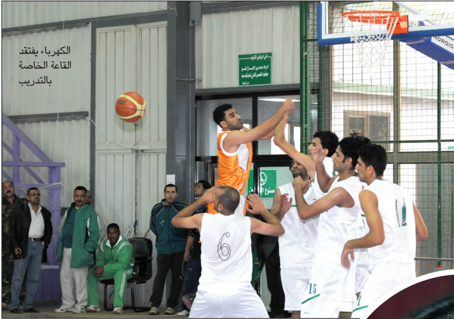
الكهرباء يفنقد القاعة الخاصة بالتدريب