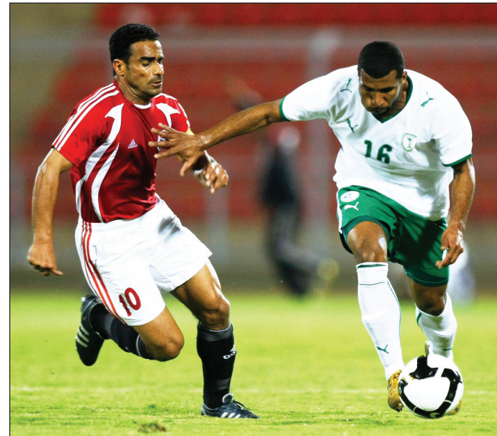
جانب من لقاء اليمن والسعودية في خليجي سابق