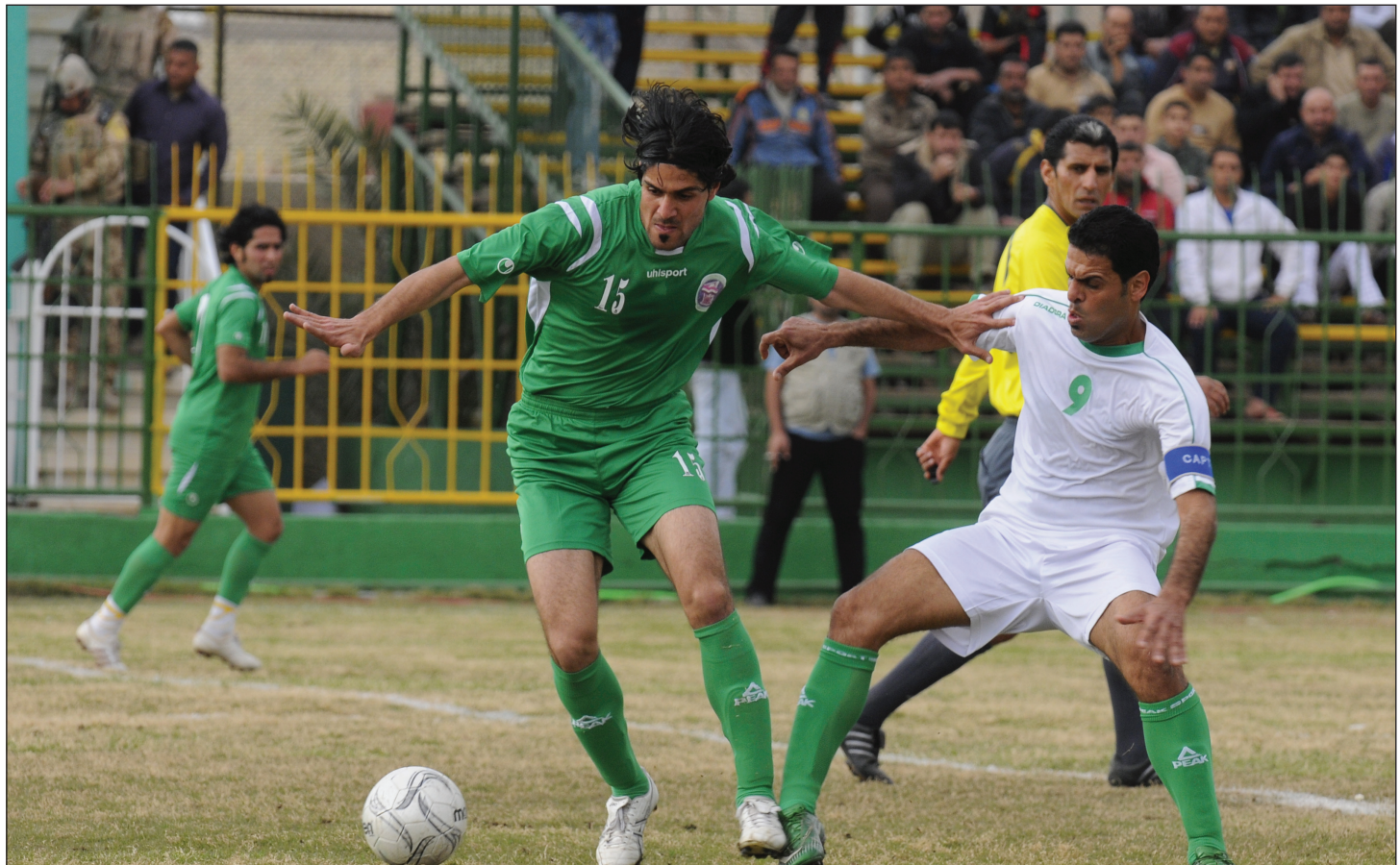
دوري الكرة يعاني تسلسل بعض المدربين الطارئین لفرقه

وتتحمل الاندية المحلية مسؤولية فسح المجال لبعض المدربين الأميين ان صح