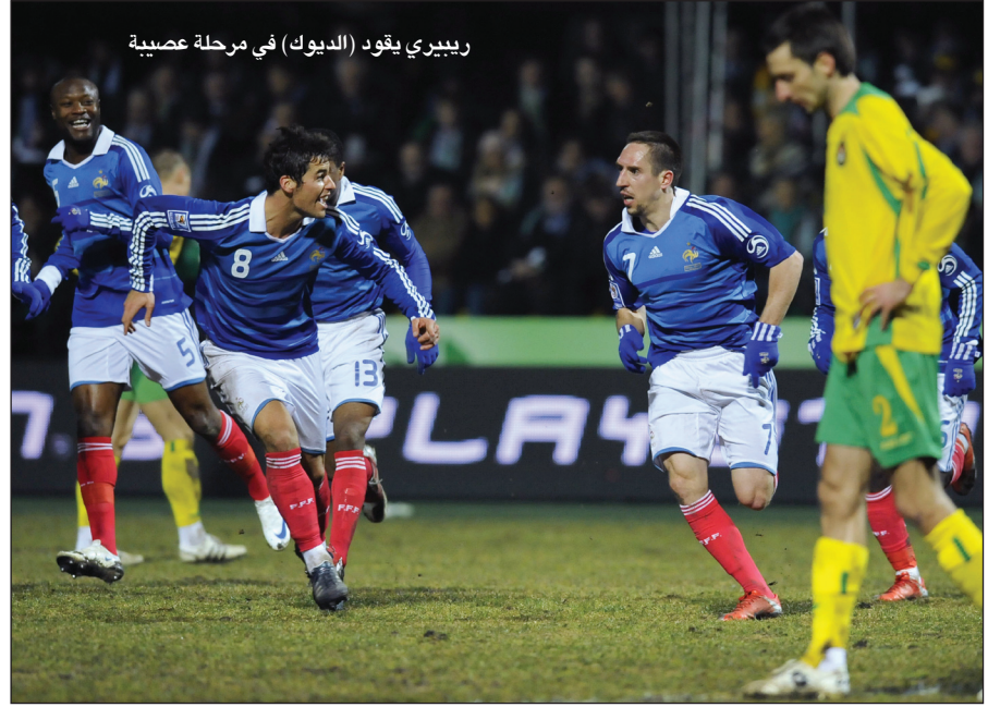
ريبييري يقود (الديوك) في مرحلة عصبية