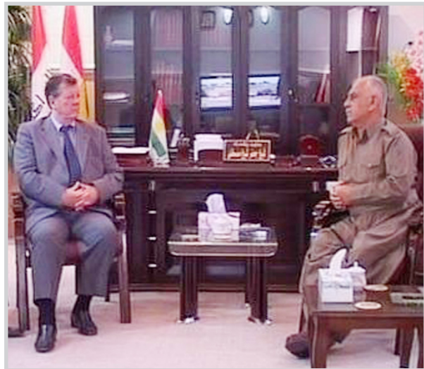
وزير البشمركة مع ممثل يوناني

السليمانية/ KRG بحث وزير البشمركة في إقليم كردستان شيخ جعفر شيخ مصطفي مع جبيري وايزكز نائب مسؤول اليونامي للشؤون السياسية في العراق والوفد المرافق له آخر التطورات بعد الانتخابات العامة لمجلس النواب، والمباحثات والمشاورات بين القوائم الفائزة، ومهمة قوات الجيش بعد تشكيل الحكومة الجديدة. ودعا وزير البشمركة من اليونامي الى أن تأخذ دورها في حل العقوات بين بغداد وإقليم كردستان، وخاصة تنفيذ المادة ١٤٠ من الدستور العراقي الدائم، وحل مشكلة البشمركة. من جهته أعلن نائب مسؤول اليونامي للشؤون السياسية بأنه يجب أن يتم التعاون بشكل أكثر، وأن اليونامي تدعم تطبيق وتنفيذ المادة ١٤٠.