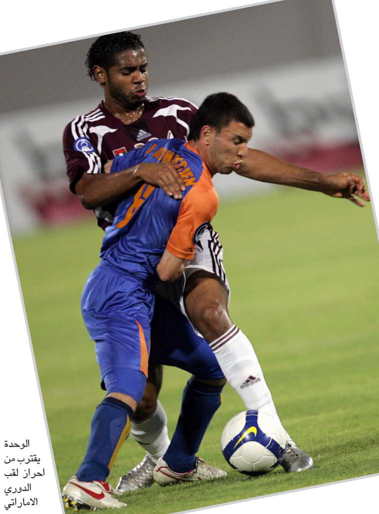
الوحدة يقرب من إحراز لقب الدوري الإماراتي