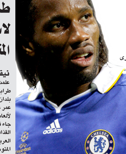
الموسم، ليس مؤكداً بعد ما إذا كانت ستجرى له عملية، ينكر أن ساحل العاج التي تأهلت للمرة الثانية في تاريخها إلى نهائيات المونديال، وقعت في المجموعة السابعة الصعبة وتضخم إلى جانبها البرازيل والسريلانكا وكوريا الشمالية التي قد تكون أضعف حلقاتها.

نيكوسيا / اف ب علمت وكالة «فرانس برس» أن العاصمة الليبية طرابلس قدمت ترشحها لاستضافة دورة ألعاب بلدان البحر الأبيض المتوسط لعام 2017. وأفاد عمر غويلبة المستشار الإعلامي للجنة الدولية لألعاب المتوسط أن ترشح العاصمة الليبية جاء في رسالة وجهها المهندس محمد معمر القذافي، رئيس اللجنة الأولمبية في الجماهيرية العربية الليبية إلى رئيس اللجنة الدولية لألعاب المتوسط الجزائري عمار العادي. وبذلك تكون العاصمة الليبية رابع مدينة تعلن ترشحها لاستضافة دورة المتوسط 2017. حيث قدمت مدن الإسكندرية (مصر) ورييكا (كرواتيا) و تاراغونا (إسبانيا) ترشحها لاستضافة دورة 2017. وسيتم اختيار المدينة التي ستستلم هذه الألعاب خلال الجمعية العمومية للجنة الدولية لألعاب المتوسط التي ستعقد عام 2011.