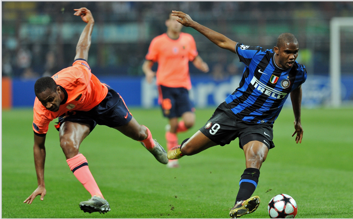
لظة من مباراة الإنتر وبرشلونة في ذهاب نهائي دوري الأبطال لاعي الفريق عانا من التعب، لكنني لست خبيراً طبيياً ولا أعرف كم تأثروا بسبب الرحلة، وقال مهاجم إنتر المقدوني غوران خسرنا الكثير من الكرات ولم نمرر بشيء، لم تكن أفضل مبارياتنا وإنتر يصعب عليك اللعب، وأضاف غوارديولا: «أعلم أن التعويض، النتيجة ليست جيدة، فقد

نيكوسيا / اف ب عوض لاعبو إنتر ميلان الإيطالي الدروس الفنية التي فرضها برشلونة الإسباني حامل اللقب في مواجهته الدور الأول من مسابقة دوري أبطال أوروبا لكرة القدم، وتمكن البرتغالي خوزيه مورينيو من الإطباق على مدرب برشلونة الشاب جوسيب غوارديولا بعد فوز بطل إيطاليا 1-2 في ذهاب نصف النهائي واعتبر مورينيو أنه راض حتى لو عجز فريقه عن التأهل إلى النهائي المقرر في مدريد: «أنا فخور بما حققناه، حتى لو لعبنا النهائي في مدريد أو عدنا من برشلونة مرفوع الرأس، طبعاً ستكون سعادة إذا تاهلنا إلى النهائي، لكن إذا فشلنا نعلم أننا نكون قد قمنا كل ما نملك، وأضاف مورينيو: «عندما وصلت إلى إنتر كنا نعاني بالتأهل من الدور الأول، كنا نخاف من هذه المسابقة والناس تقول أننا لا نقدر على اللعب في أوروبا، لكن الآن هزمنا أقوى فريق في العالم وإنتر أصبح فريقاً عظيماً في دوري الأبطال. إذا لم نحرز اللقب هذا العام، سنحرزه في العالم التالي أو بعد عامين، سنكون في نصف النهائي أو النهائي، لقد تغيرت الأمور، لكن مورينيو عاد إلى أسلوبه عندما وصف ما حصل في النصف المؤدي إلى غرفة الملابس بعد اللقاء: «أبيت لاعبي برشلونة يضغطون على الحكم، تعليقاتي الوحيد أن ذكرتهم قصيرة، لأن لاعبي فريقنا السابق تشلسي (الإنكليزي) أعانوا الموسم الماضي من تحكيم تاريخي سيئ من قبل أوفريو (الحكم النرويجي)، لماذا لا يتصرف برشلونة كالإبطال ويتقبل الخسارة أمام فريق لعب أفضل منه؟»