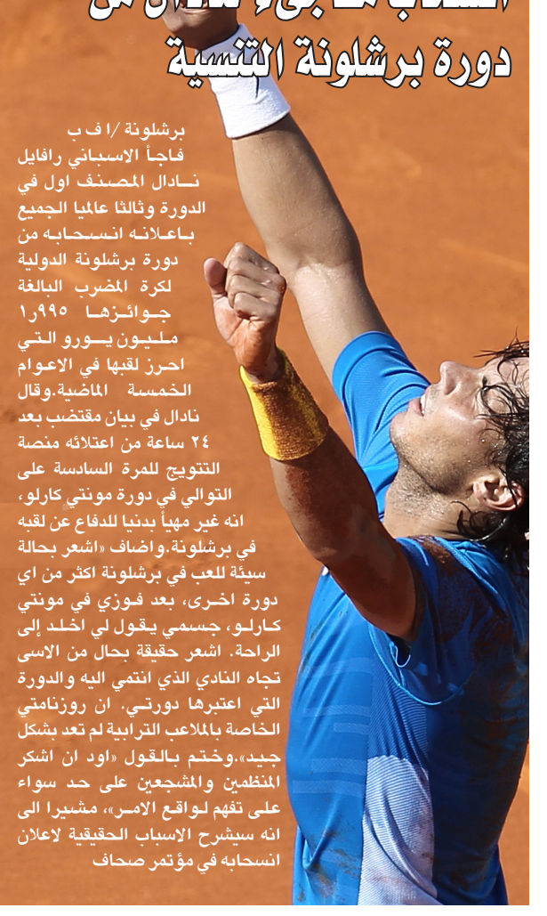
انسحاب مضاجيء لنادال من دورة برشلونه التنسية

أبو ظبي / اف ب يسعى الوحدة المتصدر إلى قطع خطوة إضافية نحو إحراز اللقب عندما يستضيف الإمارات بطل مسابقة الكأس يوم السبت المقبل، في مواجهة مخيرة ضمن مباريات المرحلة التاسعة عشرة من بطولة الإمارات لكرة القدم. وتنفق المرحلة اليوم، حيث الوصل مع العين الثالث والأهلي مع عجمان وبني ياس مع الظفرة، وتستكمل الجمعة ببقاء الجزيرة الثاني مع النصر، وتختتم السبت بمباراة المشاركة مع الشباب. وتكتسب مباريات الجولة أهمية استثنائية قبل أربع مراحل من ختام الدوري، حيث تسعى الفرق لعدم فقدان أي نقطة في صراعها من أجل اللقب والتمسك بمراكز الوسط وتغادي الهبوط إلى الدرجة الأولى. برغم فارق الترتيب بين الوحدة المتصدر برصيد 46 نقطة) وضيئه الإمارات الحادي عشر (14 نقطة)، فإن مواجهتهما ستكون غاية في الندية، خصوصاً أن الفريقين يرغبان في الفوز الذي يقرب أصحاب الأرض من الفوز باللقب ويحیی أسأل الفريق الضيف بالبقاء في صفوف أندية المحترفين. ويريد الوحدة التمسك بمرتبة الجولمة الماضية عندما أدى فوزه على العين 1-0 صفر وتعاليم الجزيرة والشارقة 1-1 إلى ابتعاده بفارق خمس نقاط عن أقرب مطارديه، لذلك فإن تخطفه للإمارات السبت سيجهله يقرب أكثر من إحراز اللقب الغائب عن خزائنه منذ عام 2005. ويملك الوحدة النصر لم يخسر في الدوري في آخر 12 مباراة منذ سقوطه أمام الوصل صفر-1 في 8 تشرين الثاني/ الماضي، كل الإمكانيات الفنية لتخطي منافسه، بوجود البرازيليين اندريه بنغا ومارسيو مغازو والدوليين اسماعيل مطر صاحب هدف الفوز على العين وسعيد الكثيري ومحمد الشني ويعقوب الحوسني ومحمود خميس. ويفتقد الوحدة لأكثر من لاعب مؤثر في صفوفه حيث يستمر غياب