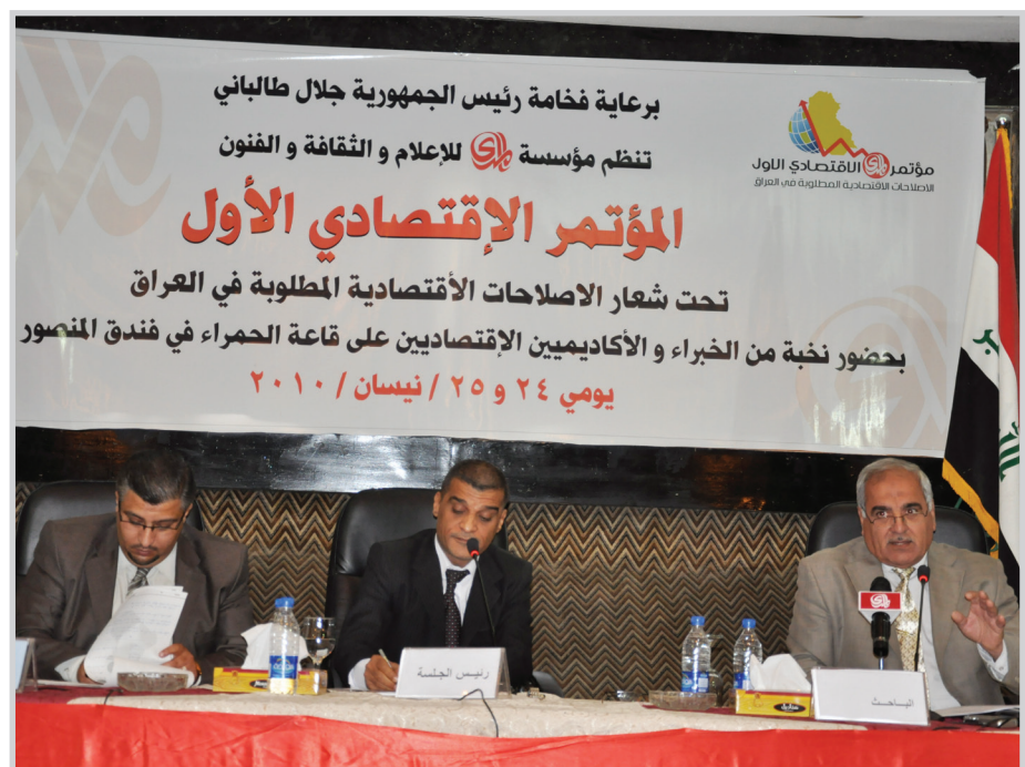
ندوة في اليوم الختامي

التعامل مع هذه الحقيقة بالتحوط وزيادة الميل للاسراع من الموارد الإضافية. ولفت المؤتمر الى اهمية الالتفات الى الاختلالات الاقتصادية والاجتماعية عند تطبيق بعض توصيات الصندوق الاقتصادي في العراق وحشد السياسات الاقتصادية النقدية والمالية والمؤسسية والتشريعية بما يساهم في زيادة مساهمة الاستثمار الوطني والاجنبي، خصوصا في زيادة مساهمة القطاعية لرفع مساهمته في الناتج المحلي الاجمالي. والتركيز على الاستثمار في البنية التحتية وضرورة اعتماد الاستثمار بطريقة البناء والتشغيل ونقل الملكية) التخفيف من الضغط على الموازنة الاستثمارية في إنشاء البنى التحتية وخاصة في مشاريع الطرق والكهرباء.