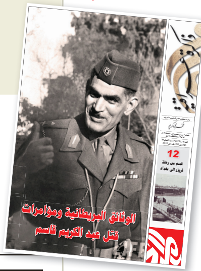
الوفاء البريطانية ومؤامرات قتل أحد الكويت باسم