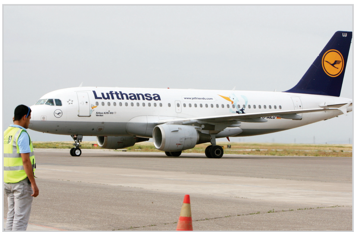
هبوط اول طائرة المانية في مطار اربيل منذ ٢٠ عاماً.