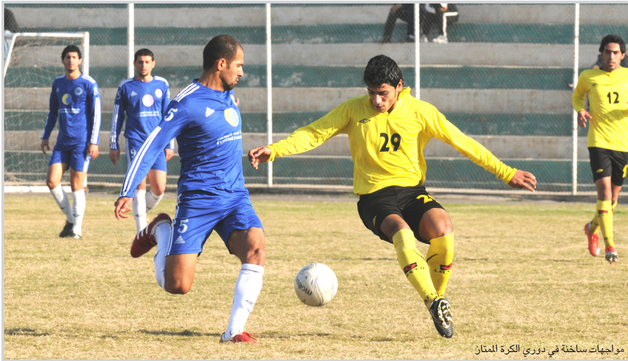
مواجهات ساخنة في دوري الكرة الممتاز

تتجه الانظار اليوم الى واحدة من ابرز مواجهات الجولة العشرين لبطولة الدوري العراقي لكرة القدم عندما يخوض فريق نادي الطلبة مواجهة ساخنة ومرقبة امام الكرخ اليوم ضمن المجموعة الثانية التي يجد فيها الصناعة فرصة مثالية وسهلة للاحتفاظ بصدارة الترتيب عندما يقابل صاحب المركز الأخير نغف ميسان. وفي قراءة سريعة للمباراة الأولى نجد ان هناك أكثر من عامل يجعلها مواجهة مرشحة للإثارة والندية والصراع بل ستكون واحدة من المباريات المثيرة وفي مقدمة هذه الاسباب ان الكرخ يدخل هذه المواجهة برغبة تجديد الفؤز واثبات جدارته ان خلف فوراً مهما وثمينا من نادي الشرطة في الجولة الماضية عندما اسقطه بهدف دون رد وكان من الممكن ان ترتفع حصيلة الكرخ لو كان هناك متسع من الوقت. وفي الجانب الآخر يخوض الطلبة صاحب المركز الرابع برغبة تحطف ثلاث نقاط ثمينة رغم ادراكه حجم صعوبة المهمة امام الكرخ المتحضر لفوز جديد فان على التوالي خصوصاً ان الطلبة اجتازن مواجهته الاخيرة في الجولة الماضية بصعوبة امام الحدود. ويأمل الصناعة الذي يدخل مباراته امام نغف ميسان برصيد 14 نقطة في مواصلة صدارة الترتيب في الوقت