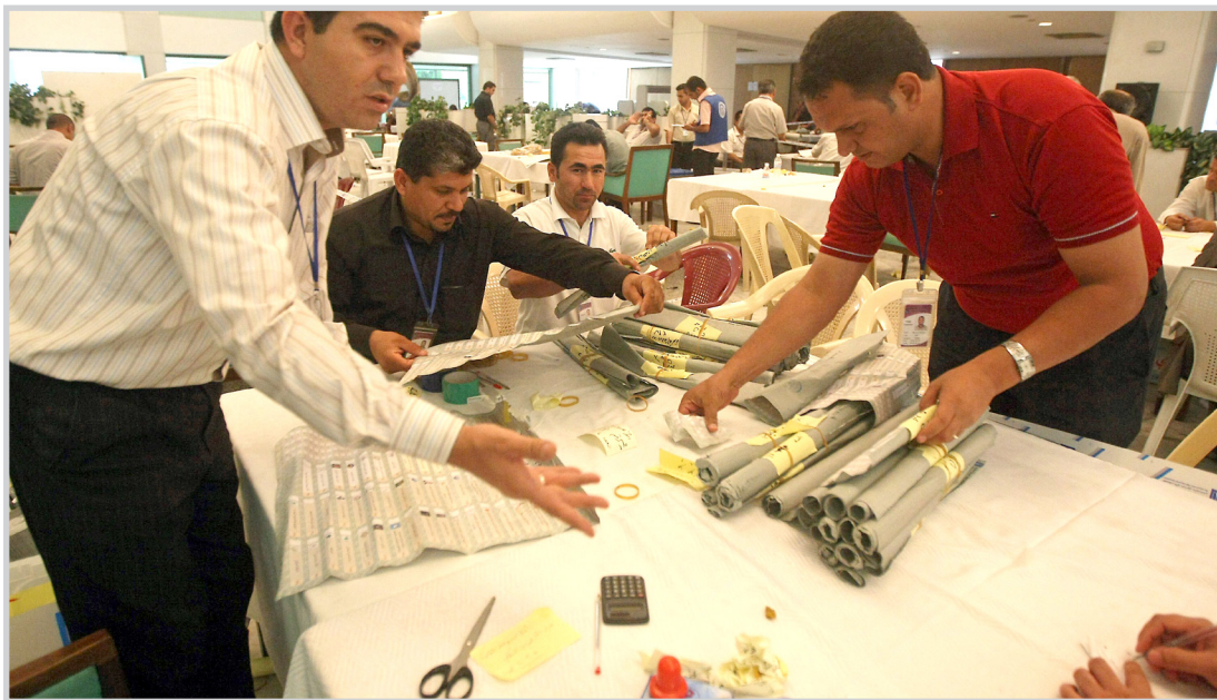
الايام الاخيرة لإعادة للعد والفرز