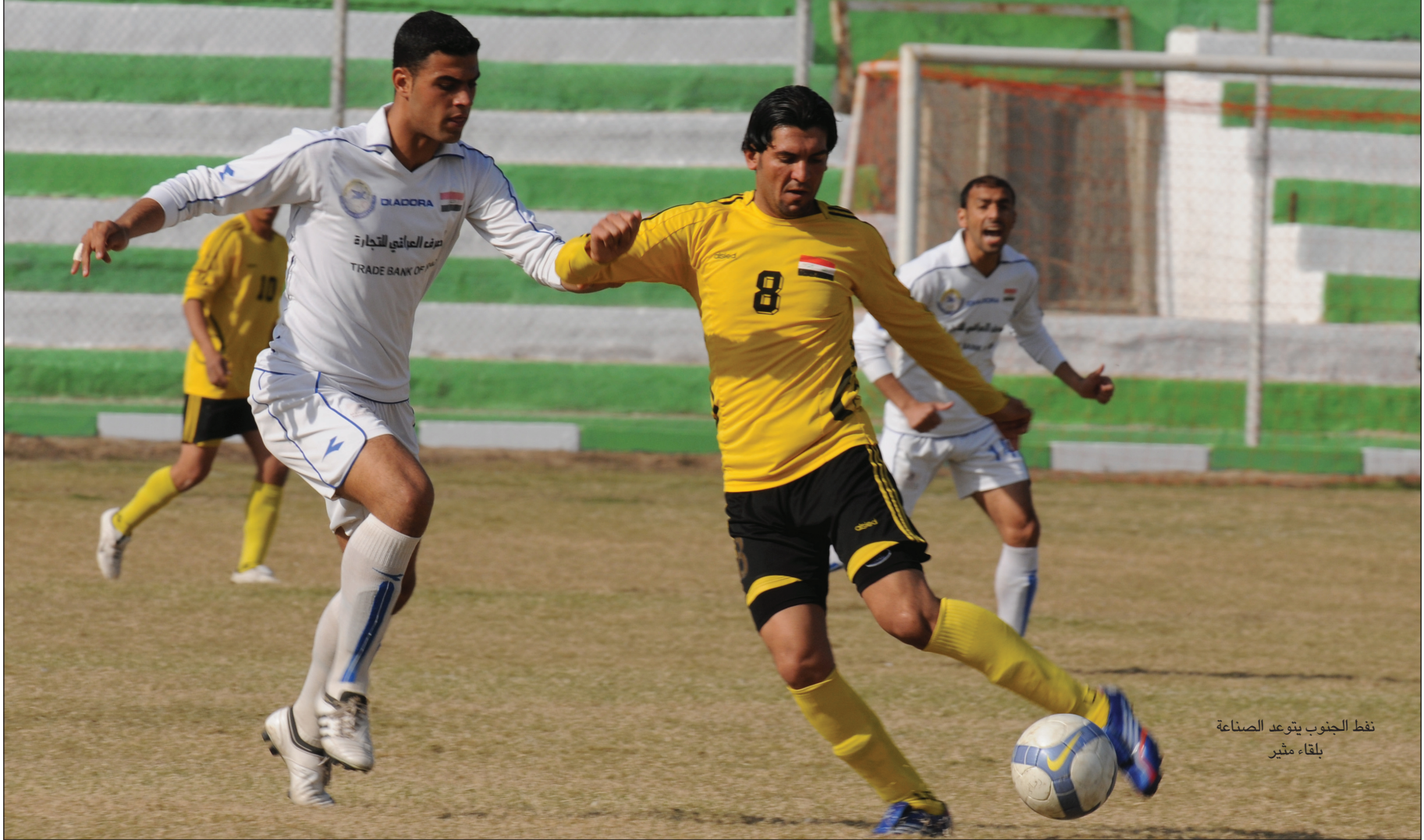
نفط الجنوب يتوعد الصناعة بلقاء مثير

فقدتهما في المباراة الاخيرة امام كركوك. وتقام خمس مباريات في منافسات المجموعة الجنوبية اهمها مباراة فريقي الشرطة وكربلاء على ملعب الاول حيث تعتبر مهمة لكلا الفريقين وخاصة الثاني الذي يسعى الى معاودة التربع على صدارة المجموعة معولا على خسارة الصناعة المتصدر امام نفط الجنوب في حين يأمل فيه الشرطة الى اضافة ثلاث نقاط ثمينة الى رصيده ومصالحه جماهيره من اجل خطف الوصافة منه. ويلعب الاتصالات مع السماوة على ملعب الاخير في مباراة لتحسين المراكز بين صاحبي المركزين السادس عشر والسابع عشر من فرق المجموعة والا بتعاد عن شبح الهبوط الذي يلاحقهما. ويواجه نفط ميسان فريق الكوفة على ملعب الكوت بينما يحل فريق النجف ضيفا على فريق الناصرية.