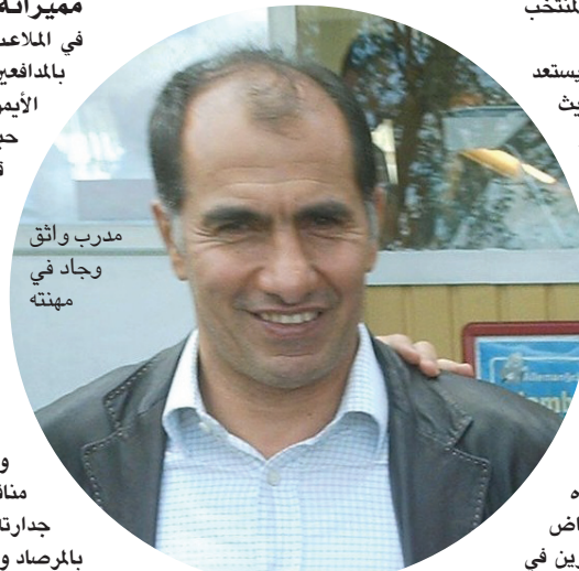
مدرب واثق وجاد في مهنته

أسهم أيوب أوديشو في حصول الطلبة على لقب بطولة الدوري ثلاث مرات في ثمانينيات القرن الماضي، كما أسهم في فوز منتخبنا الوطني بالميدالية الذهبية في دورة الألعاب الآسيوية التاسعة التي جرت في الهند عام ١٩٨٢، وساهم أيضا في تأهل منتخبنا الأولمبي إلى نهائيات دورة لوس أنجلس الأولمبية، حيث كان مع الفريق في التصفيات التمهيدية، فضلا عن ذلك كان من أبرز نجوم منتخبنا الوطني في خليجي (٦) في الإمارات عام ١٩٨٢. إن أن منتخبنا كان قريبا من إحراز اللقب لولا القرار السياسي الذي صدر للقب في اللحظات الأخيرة من عمر الدورة ليندب إلى الكويت.