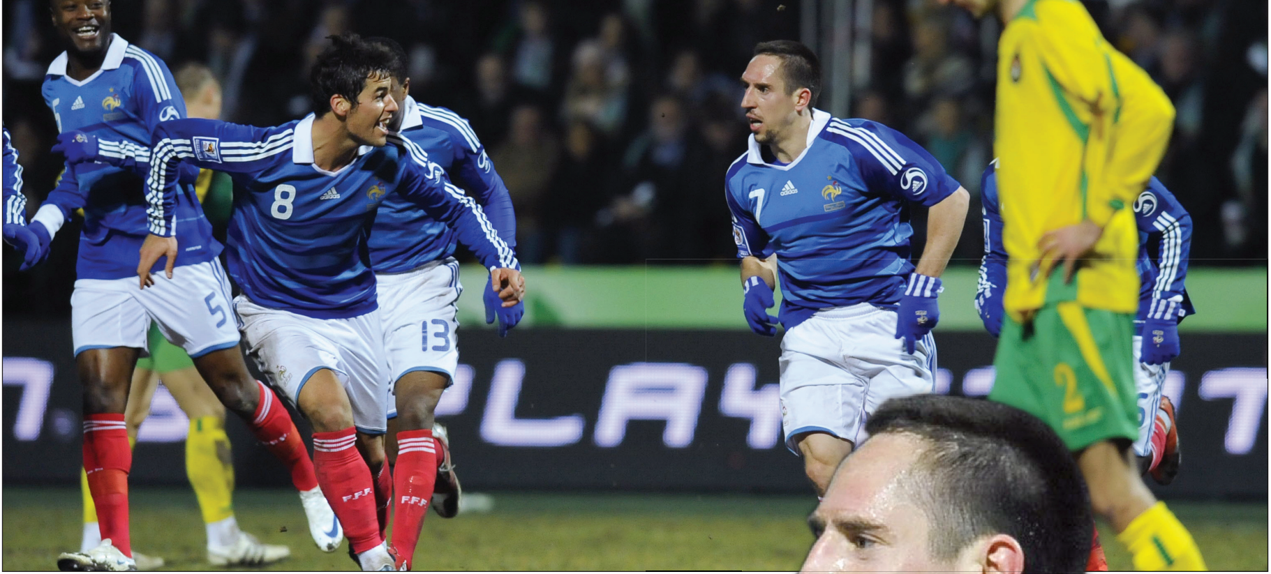
ريبييري يتربق انطلاق المونديال باهتمام بالغ

أصبح النجم الفرنسي فرانك ريبيري حالياً مطمعاً للكثير من الأندية، ولا يكاد الحديث يتوقف عن احتمال مغادرته لقلعة بايرن ميونيخ العريقة للعب في أحد الأندية الأجنبية، ويجد اللاعب الفذ نفسه مضطراً للإجابة على التساؤلات بهذا الشأن كل يوم.