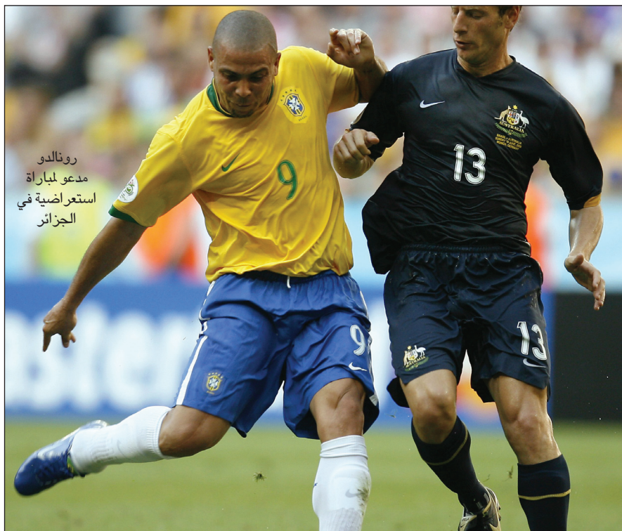
رونالدو مدعو لمباراة استعراضية في الجزائر

المباراة ستقام في ملعب ٥ يوليو الأولمبي بالجزائر بحيث يتم التغيير بين اللاعبين كل ١٠ دقائق من المباراة من قبل الجانبين لكي يشارك الجميع في المباراة، وسيتم تخصيص ربع هذه المباراة لصالح منظمة (اس أو اس للأيتام).