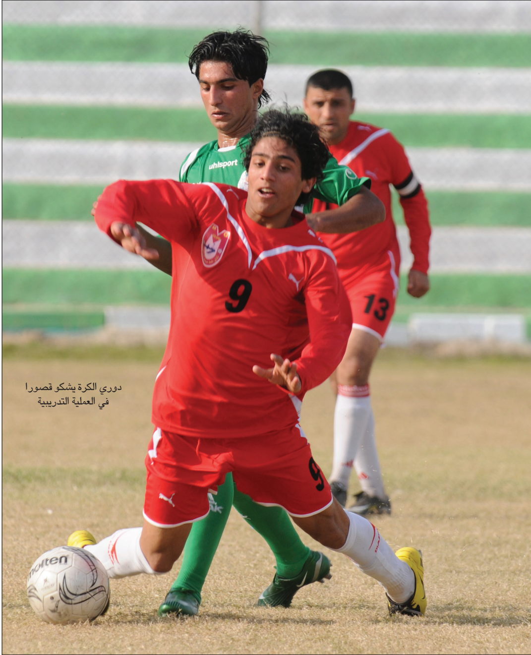
دوري الكرة يشكو قصورا في العملية التدريبية

كلما تقدم دور من منافسات الدوري زادت صعوبات الأندية المادية، وأثقلت كاهلها باعباء إضافية لا تستطيع تحملها لاسيما عندما تجري المباريات في ملاعب خارج محافظة النادي، ولان اغلب الأندية غارقة في بحر المديونية، فانها تفكر بجديفة في الانسحاب من الدوري وعدم تكملة مشواره، لغياب الدعم المادي عنها من الحكومات المحلية بعد انضاح