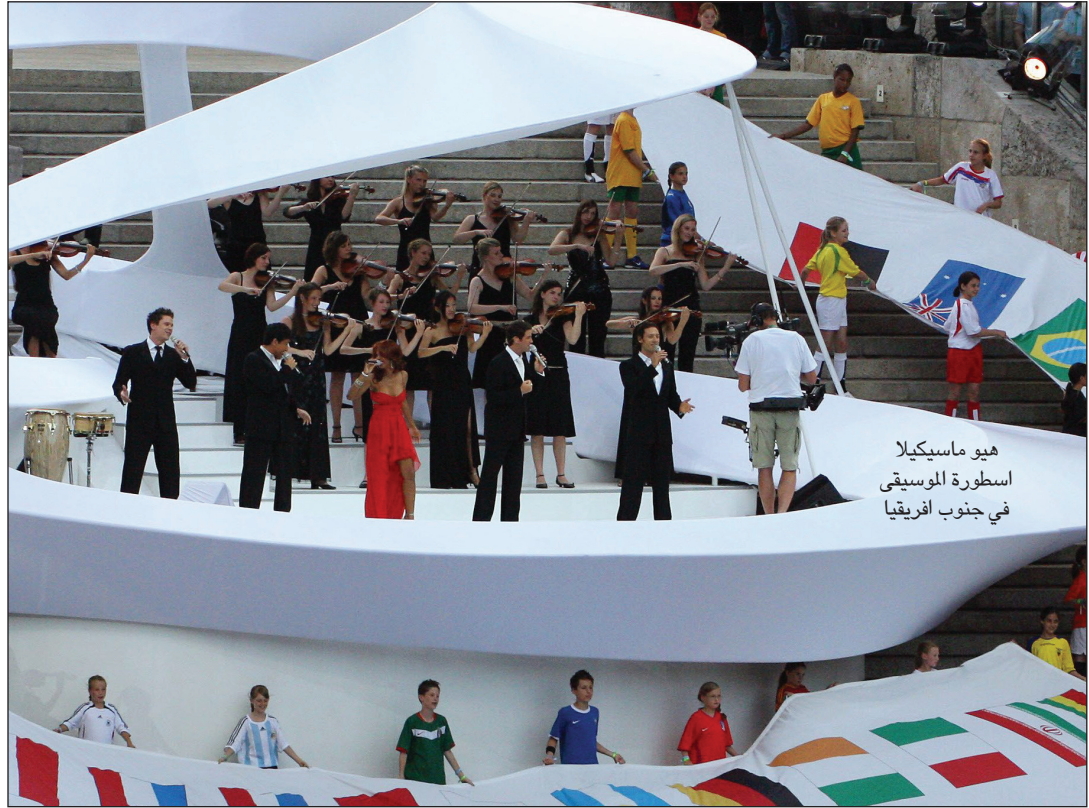
هيو ماسيكلا أسطورة الموسيقى في جنوب أفريقيا

التأكد من وصول هذا الحدث إلى ملايين الناس من خلال التلفزيون والراديو في جميع أنحاء