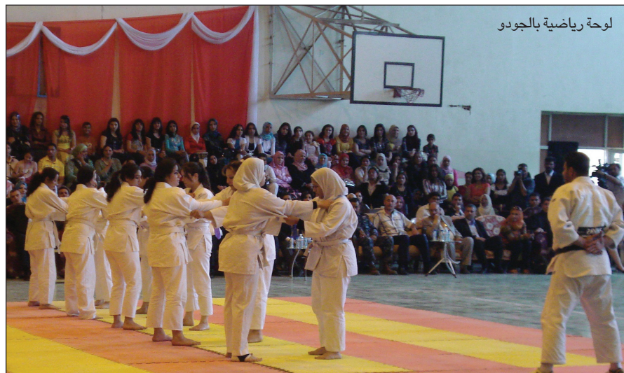
لوحة رياضية بالجودو

ووجه بعدها جاسم محمد جعفر وزير الشباب والرياضة رسالة الى المشاركين في الاحتفال قال فيها: اقدم شكري وتقديري الى كلية التربية الرياضية للبنات والى شخص عميدة الكلية الدكتورة نوال العبيدي بيوم الكلية الأغر ونحن سعداء بالانشطة النسوية التي نشاهدها والتي تحتضنها الكلية وسنعمل على دعم جميع الانشطة