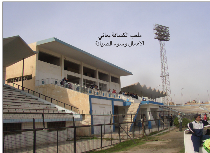
ملعب الكشافة يعاني الإهمال وسوء الصيانة

بدلاً من التركيز على توفير الوسائل الضرورية للرياضة وكرة القدم العراقية، يركز هؤلاء الذين أكسدا على انهم ليسوا مسؤولين ويستحقون هذه المناصب القيادية في الرياضة العراقية يركزون على قضايا (تافهة) يمكن أن تكون مورد (رزق) لهم ومن أبرز(التوافه) التي يركزون عليها هو البحث عن عقود تجارية مع الشركات العالمية لتزويد منتخباتنا بالملابس