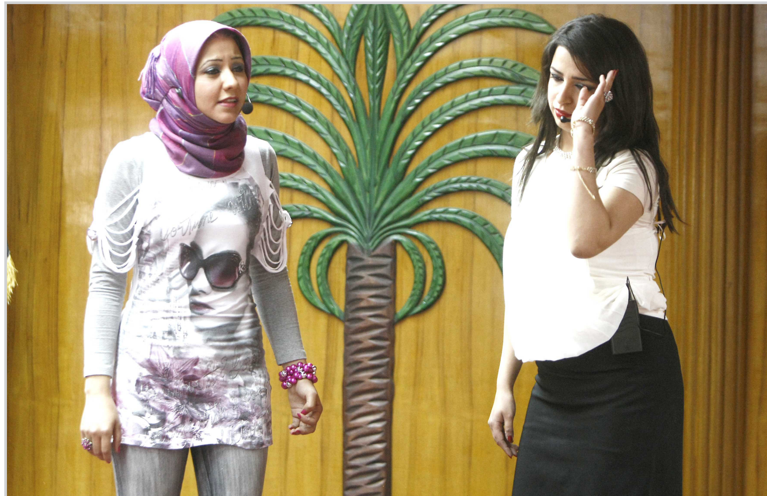
عرض مسرحي باللغة العربية في جامعة بغداد / كلية الفغات... أف ب