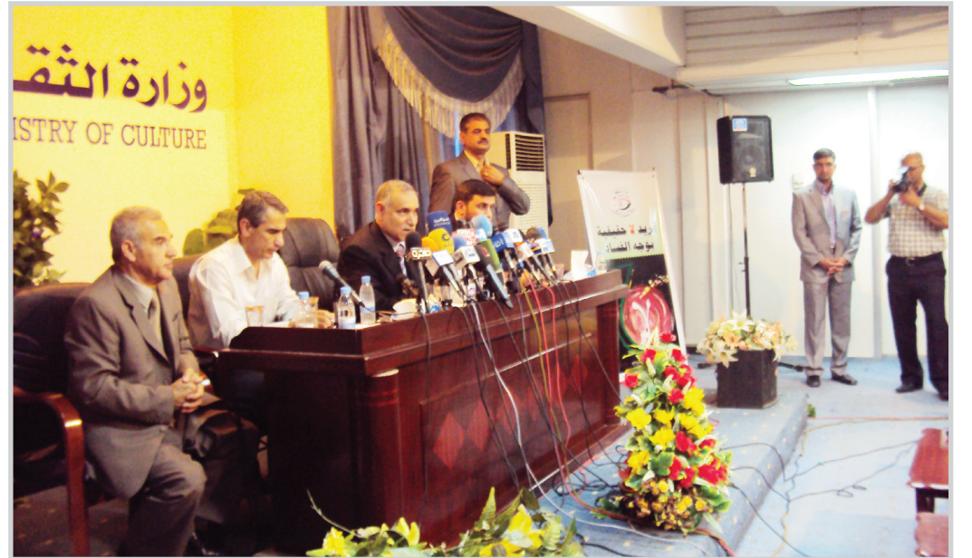
جانبا من المؤتمر

أكدت اللجنة الخاصة باستعادة الوثائق العراقية انها زجعت بإقناع الولايات المتحدة الأمريكية لاسترجاع الأرشيف الذي استولت عليه الولايات المتحدة الأمريكية ومنها الأرشيف الخاص بيهود العراق وحزب البعث، وأشار أعضاء اللجنة الثلاثية في مؤتمر صحفي عقده في مبنى وزارة الثقافة، ان مفاوضاتهم الأخيرة مع الأطراف الأمريكية تبعث على التفاؤل، بالرغم من وجود العديد من العوائق اللوجستية والتقنية والفنية، والعمليات تجري حاليا لتقييم هذه الوثائق بعد عملية تجفيفها، كما أوضح الوفد العديد من التفاصيل الخاصة بنقل هذه الوثائق المهمة والحساسة التي تخص استيلاء الـ(CIA) على وثائق تخص علاقة صدام حسين بالقاعدة وأسلة الدمار الشامل.