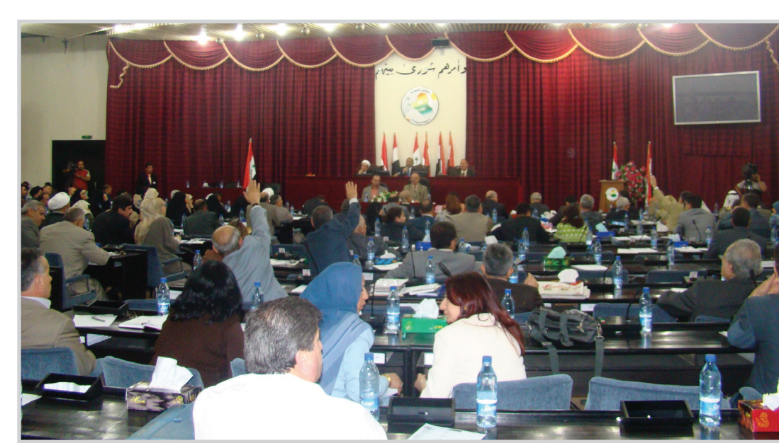
الصراع على السلطة