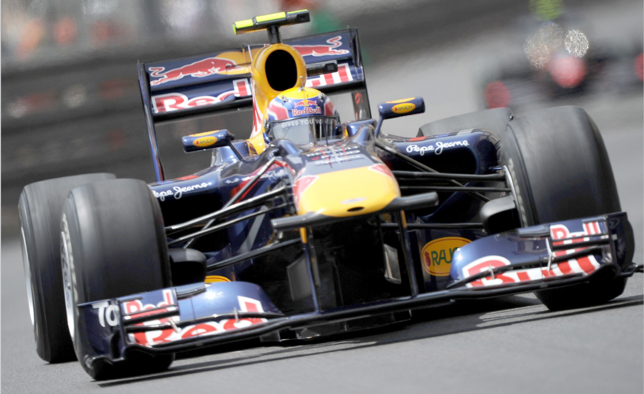
الاسترالي ويبر اثناء السباق

مونتري كارلو / ا ف ب سيكون الاسترالي مارك ويبر (رد بول-رينو) اول المنطلقين في سباق جائزة موناكو الكبرى، المرحلة السادسة من بطولة العالم لسباقات فورمولا واحد، بعد حلوله في المركز الاول للتجارب التأهيلية تقدم ويبر على سائق رينو البولندي روبرت كوبيتسا، وزميله في رد بول-رينو الألماني سباستيان فيتيل. وواصل فريق رد بول تألقه في التجارب التأهيلية بعد ان كان ثنائي الفريق سيطر على المركز الاول عند خط الانطلاق في المراحل الخمس الاولى من البطولة. وهي المرة الثانية على التوالي التي يتخطى فيها ويبر من المركز الاول والرابعة في مسيرته، وكان قد انتزع المركز الاول في سباق كاتالونيا الاسباني الاحد الماضي امام الاسباني فرناندو الونسو سائق فيراري، وزميله فيتيل.