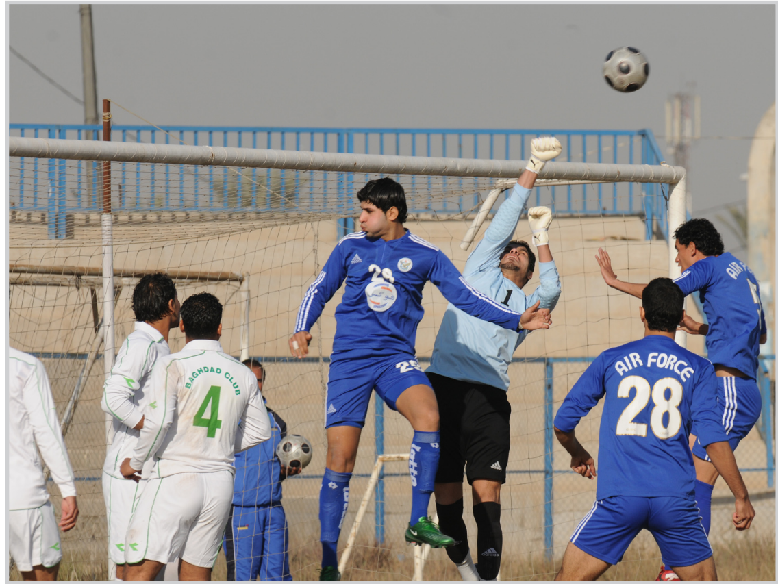
دهوك يسعى لانتزاع ثلاث نقاط ثمينة من الجوية

بغداد / المدى تنتظر فريق نادي سامراء لكرة القدم الذي يواجه موسما سيئا مهمة صعبة على ملعب مضيفه الزوراء اليوم السبت ضمن الجولة الثالثة والعشرين من مسابقة الدوري المحلي في اطار المجموعة الاولى التي تتجه فيها الانتظار اليوم أيضا الى ملعب دهوك حيث يحل الجوية ضيفا على صاحب الأرض والجمهور في مواجهة مرتقبة يتوقع ان تكون واحدة من ابرز مباريات المرحلة لما تحتوي عليه من حساسية للفرقين اللذين يسعيان للخروج منها بفوز ثمين يعني لهما الكثير على ملعب الزوراء حيث يتسلح اصحاب الأرض بالسنادة والمؤازرة فضلا عن افضلية الأرض يحاول النوراس المضي بمسلسل النتائج الجيدة التي تحققت خلال الجولات الأربع الماضية ودخول دائرة صراع مراكز المقدمة في المباريات المقبلة ان يدخل الزوراء مباراته اليوم برصيد ٣٥ نقطة في المركز السادس، فضلا عن رغبته في التواجد ضمن المراكز المؤهلة الى منافسات النخبة يرغب الزوراء في بلوغ صراع الصدارة اذا ما تعرضت فرق المقدمة الى سيناريوهات غير متوقعة وفي المقابل يأمل سامراء ان يقف بوجه ضيفه وان لا يكون صيدا سهلا بل يسعى للدفاع عن مهمته في هذه المواجهة وعدم السماح لصاحب الأرض ان يذهب بطموحاته الى ابعد ما يمكن خصوصا ان لاعبي سامراء يجدون