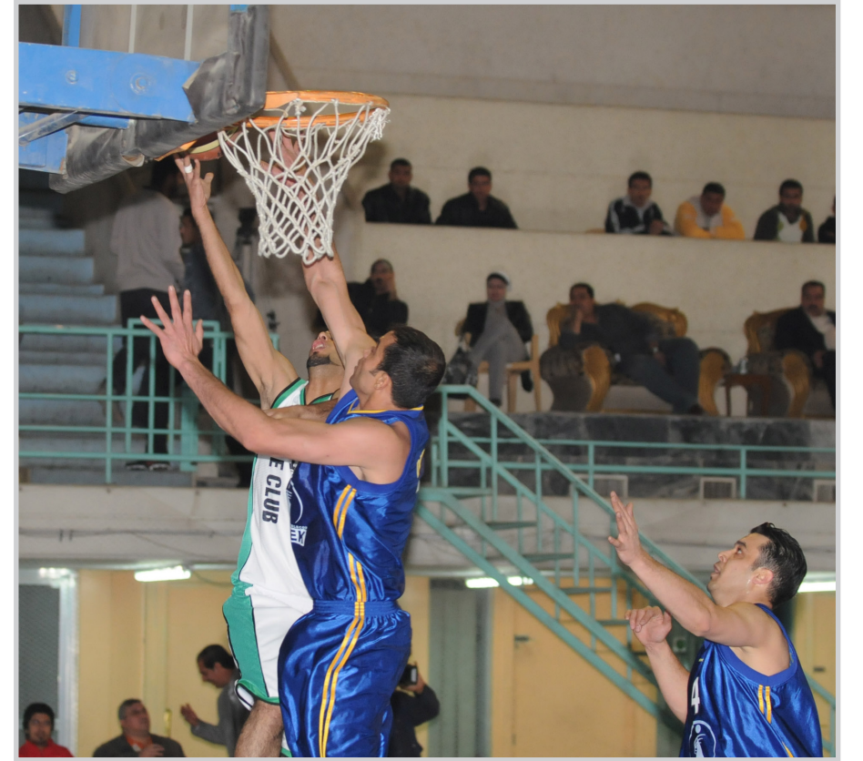
قاعة الكرخ ترتقب موقعة سلية بين الكهرياء والشرطة