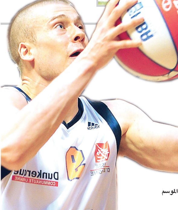
دعواته في هذا الموسم

، فإن ذلك سيكون شيئاً رائعاً ، إنها مجموعة صعبة حقاً ، لذا سنرى ما الذي سيحدث.؛ وقام إريكسون بتدريب المنتخب الإنكليزي بين عامي 2006 و 2010 قبل أن ينتقل لتدريب المنتخب المكسيكي موسم 2008/2009 ، وقام بتدريب العديد من الأندية الأوروبية قبل أن يتعاقد على تدريب المنتخب الإفريقي في 21 آذار