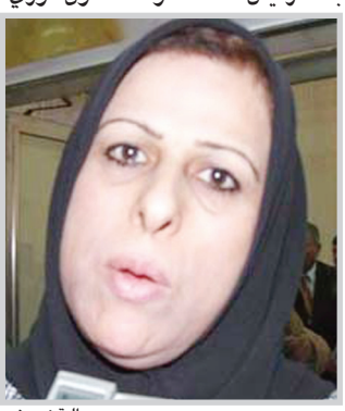
لرئاسة الحكومة أكد القيادي في حزب الدعوة وعضو

وقالت نصيف بحسب (الوكالة الاخبارية للانباء): بالرغم من ترحيب علاوي المستمر بلقاء رئيس ائتلاف دولة القانون نوري