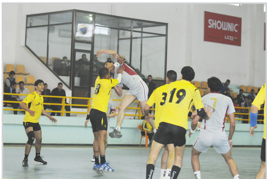
جانب من منافسات كرة اليد لاختيار عناصر المنتخب