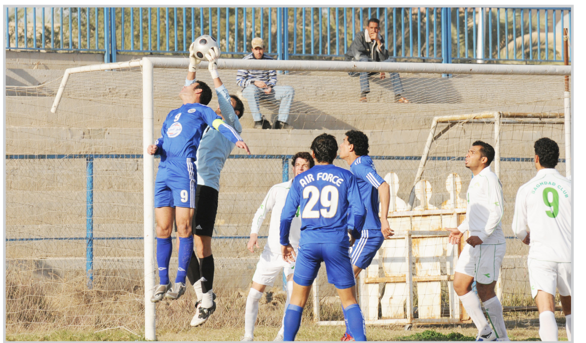
الصقور تغرب ديبالي بخماسية نظيفة