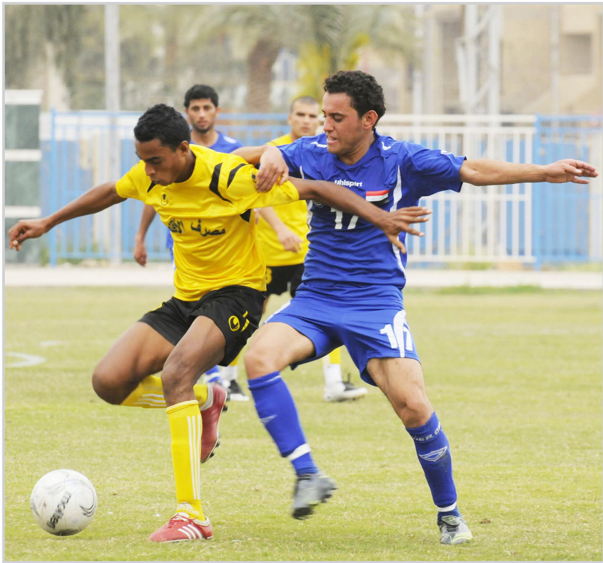
دوري الكرة الممتاز يتواصل بالتزامن مع المونديال