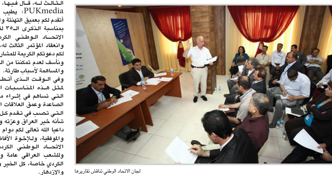
لجان الاتحاد الوطني تناقش تقاريرها

ولجنة الاستراتيجية، ولجنة الانتخابات. وأعلنت بعض اللجان الانتهاء من أعمالها أمس الجمعة، وستستمر اللجان الأخرى في عملها بعقد جلسة مساءً لإنتاج وتوضيح تقاريرها التي يؤمل الانتهاء منها اليوم السبت وعرضها على أعضاء المؤتمر لإغنائها بملاحظاتهم وإقرارها والمصادقة عليها. وقدم الدكتور برهم أحمد صالح نائب الأمين العام للاتحاد الوطني