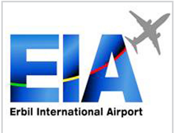
شعار مطار أربيل الجديد

وعلى مستوى العالم. وأضاف: ان فرص التوسع ستزداد مع افتتاح الإدارة الجديدة للمطار المبني على طراز عالمي، صحي وأمن مع زيادة كبيرة في التعامل مع شركات عالمية ومن المتوقع ان تقوم (EIA) بدور محوري في تحفيز نشاط الاقتصاد وخلق