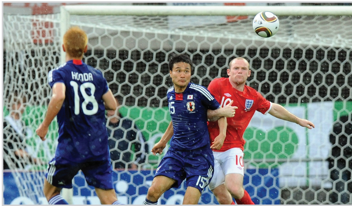
اليابان يقول على الحارفي

هل يستطيع الصمود أمام ميسي المنتخب الاكثر مشاركة في التصفيات حيث تصدر المجموعة من دون خسارة ويمك هيمنة كبيرة على كرة القدم الآسيوية من خلال الظهور الكبير في بطولاتها ، وتكرر حضوره سبع مرات في مونديال كأس العالم بهدف الصعود الى دور الـ 16 وتقديم المستوى الرابع واحداث المفاجآت الكروية ، برغم تواجده مع مجموعة قوية شملت : الأرجنتين ونيجيريا وكوريا الجنوبية واليونان. وبعد ان قاد المنتخب الكوري في مونديال 2002 و 2006 مديراً هولندياً ، سبقوه في هذا المونديال المدرب الهولندي هو جونغ - مو الذي يمتلك خبرة كبيرة في كأس العالم وله علاقات طيبة مع لاعبيه . أبرز لاعبي كوريا الجنوبية نجم مانشستر يونانيد براك شو يونغ الذي سجل خمسة أهداف بمساعدة موهوبين هما براك شو يونغ ولي كون هو . ومن خلال قراءة المجموعة التي تضمه مع الأرجنتين ونيجيريا واليونان يمكن القول ان اللقاء الأهم هو مواجهة الأرجنتين منطلقة بالدرب الجيد مارادونا (قائد منتخب) له وزنه في المونديال لكن السؤال الأهم