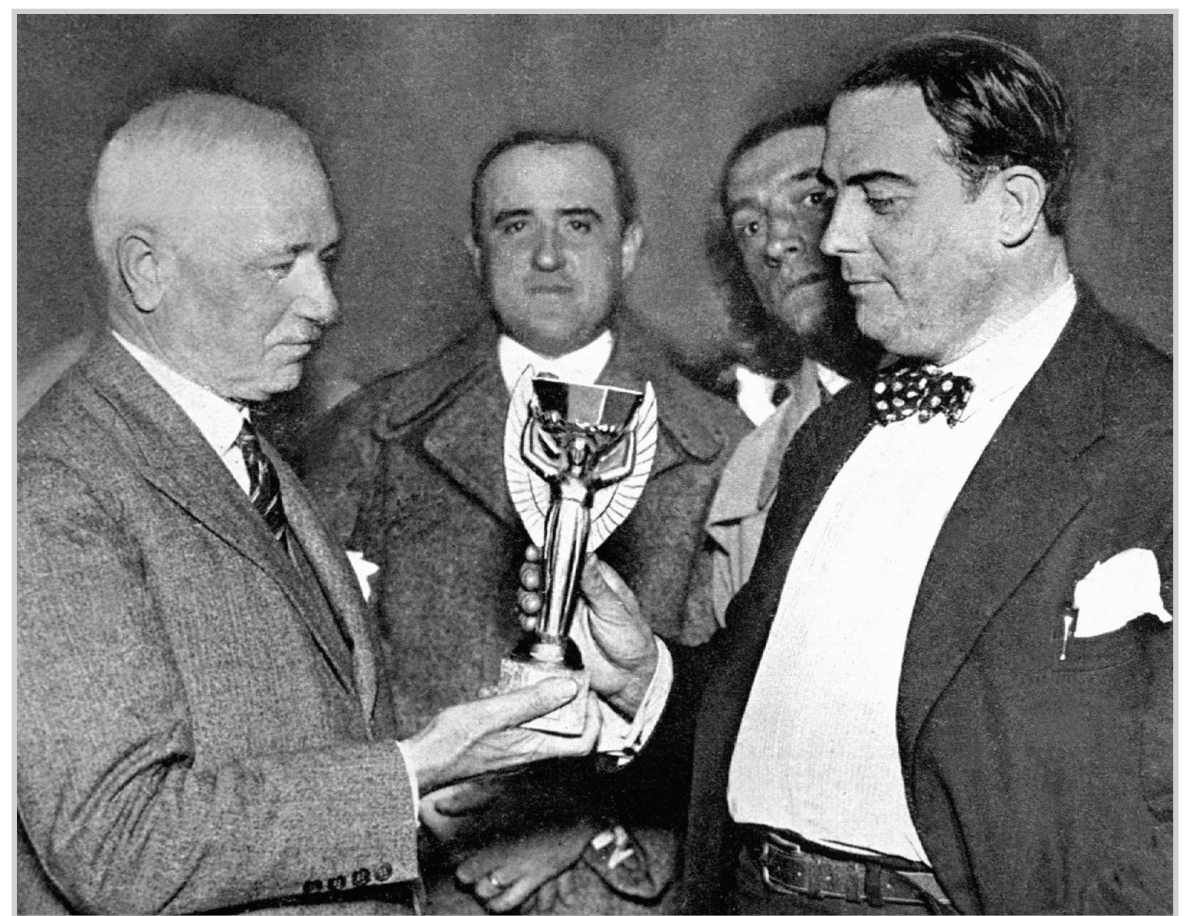
جول ريميه يسلم الكأس للبطولة

القدم. وشكل الفرنسي رئيس الاتحاد الدولي لكرة القدم آنذاك جول ريميه لجنة لدراسة إقامة بطولة عالمية خاصة بكره القدم، وقدم رئيس اللجنة والأمين العام للاتحاد الفرنسي هنري ديلوناي تقريره النهائي خلال دورة الألعاب الأولمبية التي أقيمت في أمستردام في عام ١٩٢٨، مؤكدا إمكانية إقامة البطولة المنشودة للمرة الأولى في عام ١٩٣٠. وبعد عام واحد اختيرت الأورغواي لتضيف أول بطولة لكأس العالم، وكلف أبل لافير بمهمة تصميم جائزة تقدم للفائز بهذا الحدث وأطلق على عمله الفني اسم (كأس جول ريميه). ولم يحظ اختيار الأورغواي لاستضافة هذا الحدث -يفضل فوزها بمسابقة كرة قدم في دورتين أولمبيتين متتاليتين فضلا عن احتفالها بالذكرى المئوية لإنشائها- بترحيب كبير بين الدول الأوروبية التي أبدت قلقها بسبب تكاليف الرحلة والفترة الزمنية التي يحتاجها اللاعبون للوصول إلى اميركا الجنوبية. وأقيمت هذه البطولة على أساس توجيه الدعوات لجموعة من الدول للمشاركة بها لكن الكثير من هذه الدول رفضت لاستمرار فرصة اللعب في أول بطولة عالمية