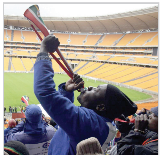
أحد مشجعي جنوب افريقيا

مشجعاً تعرضوا لأصوات الأوباق في ملعب سعته 30 ألف متفرج أوضحت معاناتهم من تدهور وأصبح في قوة السمع.. وأوضح سوانيبول إنه برغم أن التأثير بدأ مؤقتاً إلا ان التعرض لهذه الضوضاء بعيداً عن هوس أطول قد يؤدي إلى تلف دائم.. وهناك حاجة للزمن من الدراسات لكن من غير المحتمل ان يؤدي ذلك إلى الصمم التام. وتابع سوانيبول: (إذا) تعرضت للضوضاء التي تقنا بقياسها لمدة 10 أو 15 أو 20 دقيقة متواصلة فإنك بشكل مؤكد تعرض نفسك لخطر فقدان جزء من حاسة السمع بسبب الضوضاء.. ويصح ملعب سوكر سيتي في جوهانسبرغ لضوضاء شدتها 80 ديسيبل من دون واق للأذن لكن الدراسة أظهرت