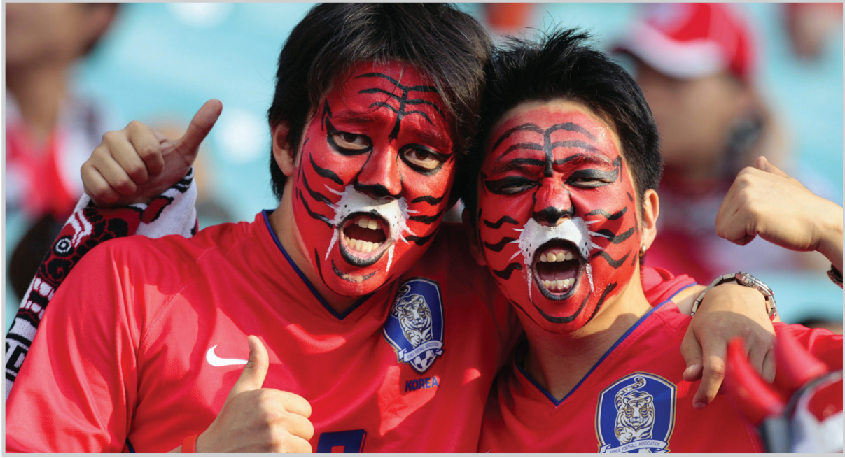
مشجعان كوريان يبتغان لمنتخبهما

يستعد المباريات من عشاق كرة القدم في جميع أرجاء العالم لانطلاق منافسات كأس العالم 2010 التي تقام في جنوب أفريقيا. وستستقبل نهائيات هذا العام بمقابلة جماهيرية ضخمة سواء عبر المحطات التلفزيونية المختلفة، أو أنظمة البث الحديثة والتي تشمل الإنترنت والهواتف التي تنقل آخر التطورات في كل مباراة. وللمرة الأولى في تاريخ كأس العالم سيتم نقل مباريات كأس العالم بتقنية "ثلاثية الأبعاد - 3D" وذلك على عدد من المحطات في أرجاء مختلفة من العالم ومن بينها قناة الجزيرة الرياضية إلى جانب محطات في كوريا الجنوبية والولايات المتحدة وإسبانيا. ويتوقع أن يحقق الاقتصاد الدولي لكرة القدم أرباحاً تقدر بنحو 2,5 مليار دولار من البث التلفزيوني، في حين يتوقع أن يكون إجمالي الدخل الذي ستحققه القنوات الناقلة حوالي 2,5 مليار دولار. وخلال السنوات الماضية تسارقت العديد من المحطات التلفزيونية على شراء حقوق بث مباريات كأس العالم، حيث كان من الواضح اهتمام جميع