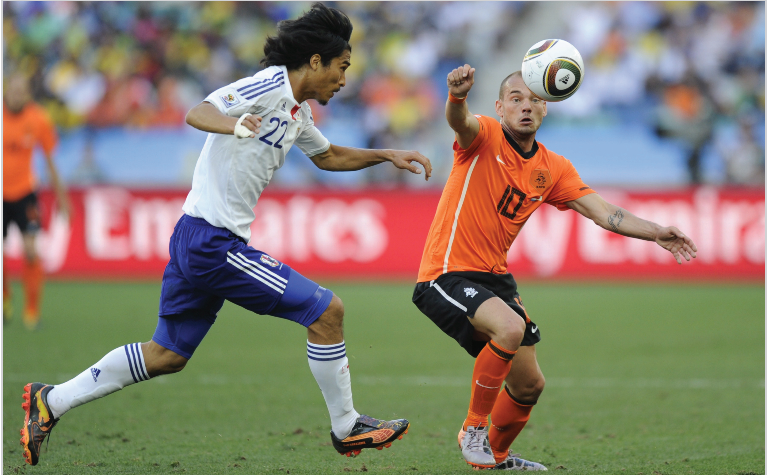
شنايدر يعزز آمال الطاحونة الهولندية في المجموعة الخامسة ... أ ف ب

الأمر سيان على الجميع، أنا راؤض تماما عن تطور أداء فريقى .. وأوضح أستطيع القول بان ٧٠ من المئة من لاعبي الفريق جاهزون من الناحية البدنية ، وعندما يتحسن مستوى الآخرين، فإننا نسجل أهدافا ونخلق المزيد من الفرص ... لا داعي للقلق على الإطلاق ."