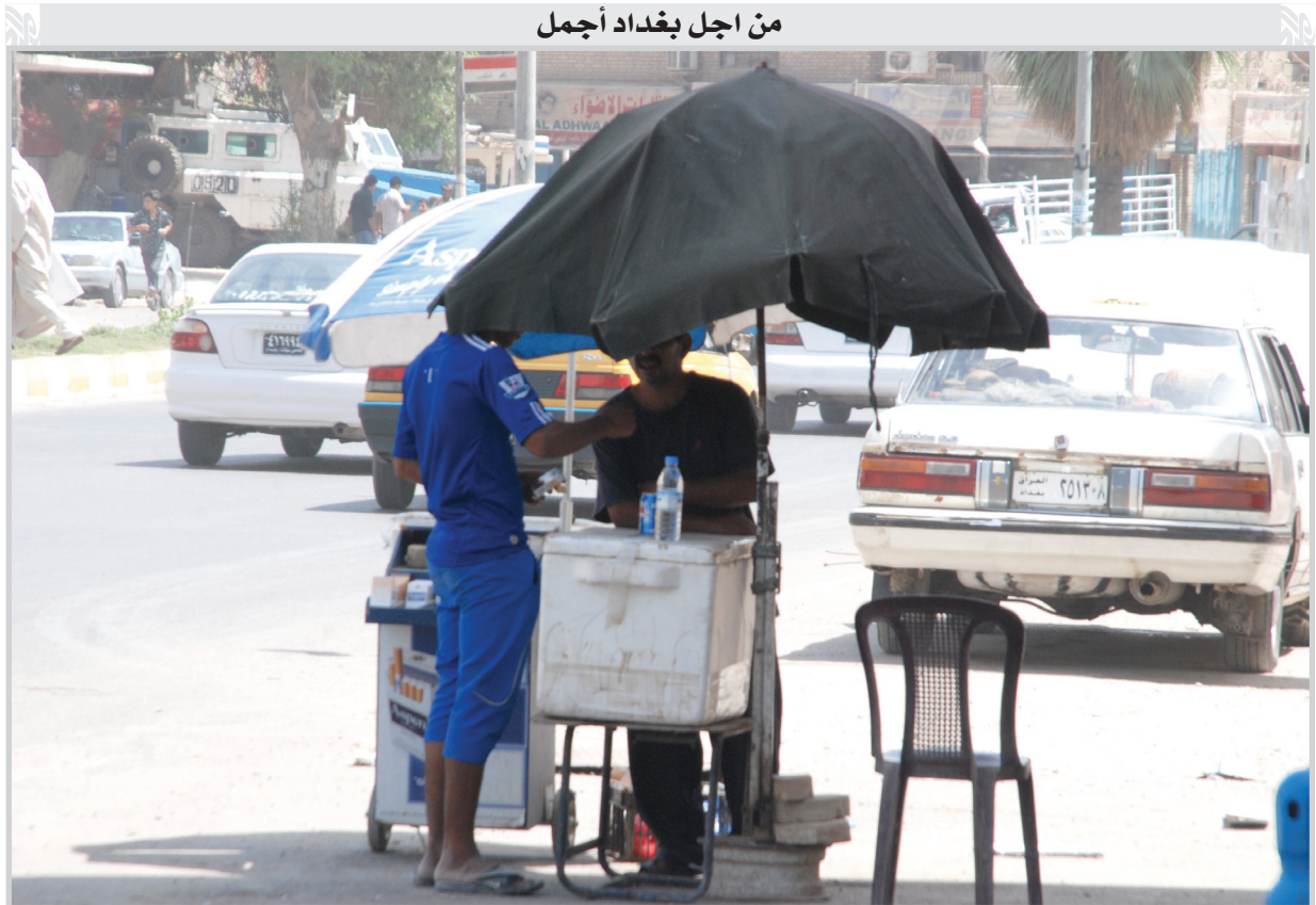
من اجل بغداد اجمل