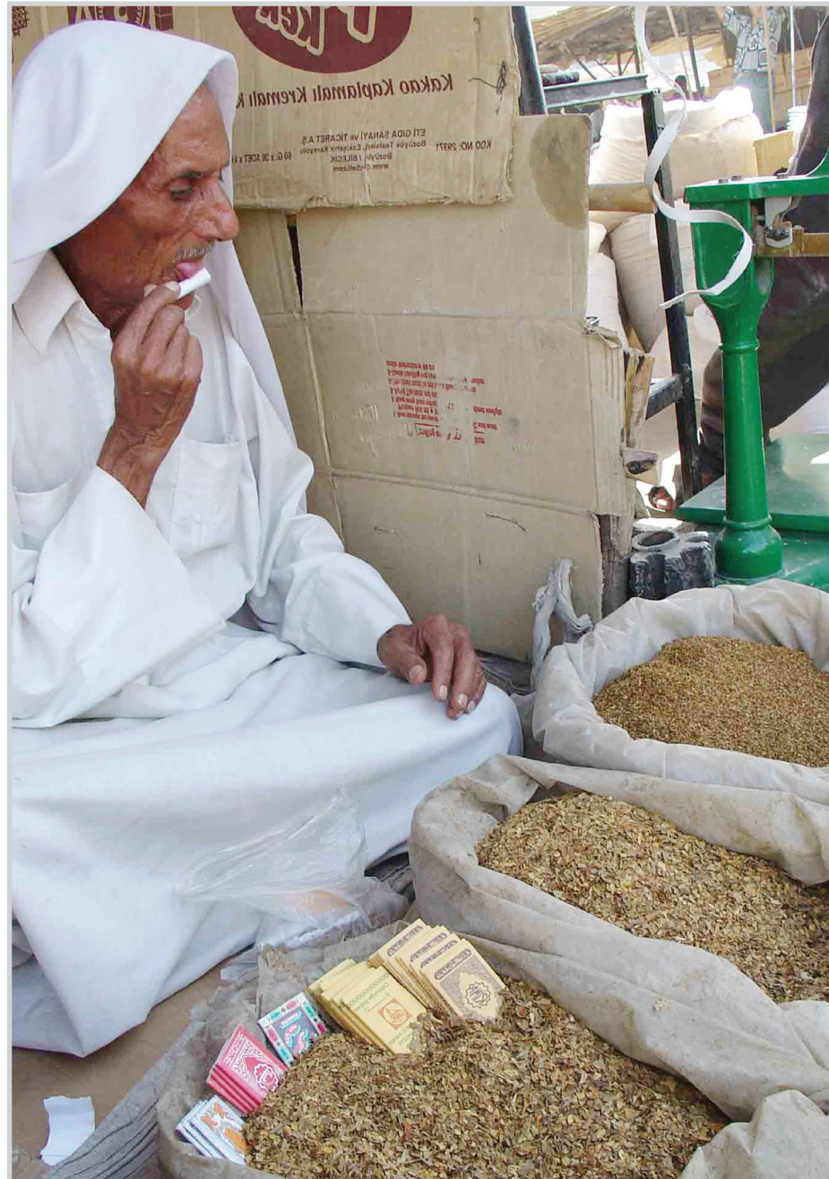
مهنة قديمة مازالت حتى اليوم