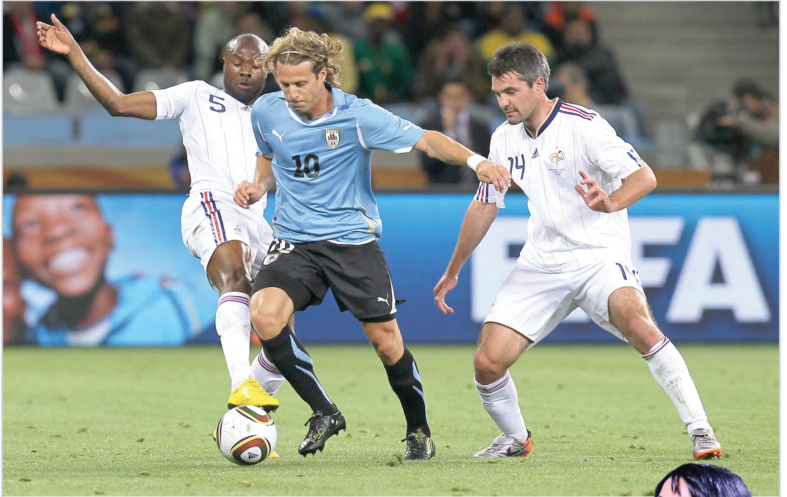
الأورغواي تسعى لوضع قدم لها في نصف النهائي

الفكرة التي سبق وجربت في بطولة الدوري الأوروبي ، مؤكداً أن يأتي الحل من داخل مكان اللعب من دون تقديم حيز كبير للتكنولوجيا. من جهته اعتبر مهاجم منتخب غانا جيان اسامواه ان الأورغواي مرشحة للفوز، وقال انه من المهم أن تكون أفريقيا وراء فريقه. وفي حال فوز غانا على الأورغواي ستصبح أول دولة من القارة الأفريقية تلعب نصف النهائي في تاريخ المسابقة. وتواجه المنتخب الهولندي في بطولة العالم عامي 1930 و 1950 إلى الدور قبل النهائي لبطولة كأس العالم منذ 40 عاماً كما غابت عن ثلاث من آخر أربع نسخ للبطولة. إن منتخبه يستمد الحافز من نفسه حيث أن التاريخ الذي يستلهمه هو نفسه هذا الفريق وليس الإنجازات التي حققتها أورغواي في الماضي فتلك لايد من تركها في موضعها وعدم المساس به. واعرب مدرب أورغواي عن تأييده لإرجاء (غزو التكنولوجيا) لعالم الكرة واقترح من أجل تقليل الأخطاء إضافة حكيم آخرين وهي