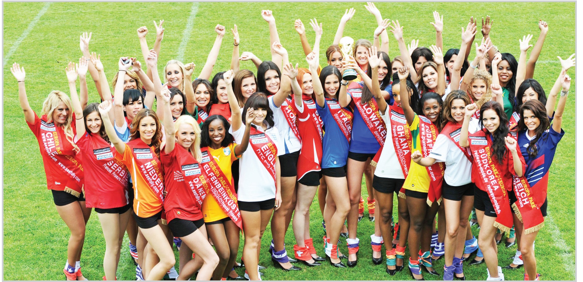
الشجعان الجميلات يسرقن الأنظار من نجوم المونديال

حيث شرحت ماى قائلة إنه بعد أن يخرج أي منتخب من البطولة، فإن مثلته هنا تغادر البلاد أيضا. وأضافت طالبة كلية السياحة التي تعمل أيضا، عارضة أزياء: «إننا نقوم بإقصاء بعضنا، فإذا انتهى مشوارنا، وكانت تلك من أجمل الأمور التي سأغادر أنا أيضا. لكن ربما أبقى حتى موعد المباراة النهائية، يقول الكثيرون إن المنافسة ستكون صعبة جدا، لم تستح لي الفرصة المتابعة جميع مباريات ألمانيا التي ستواجهها الأرجنتين، لكن فريقي بمنتخب بلادي كبيرة، فإبنا مارادونا يلعبون بشكل جيد وكلنا أمل بأن يحرزوا النصر. هذه هي المرة الأولى التي تسافر فيها ماى خارج الأرجنتين وقد سحرتها