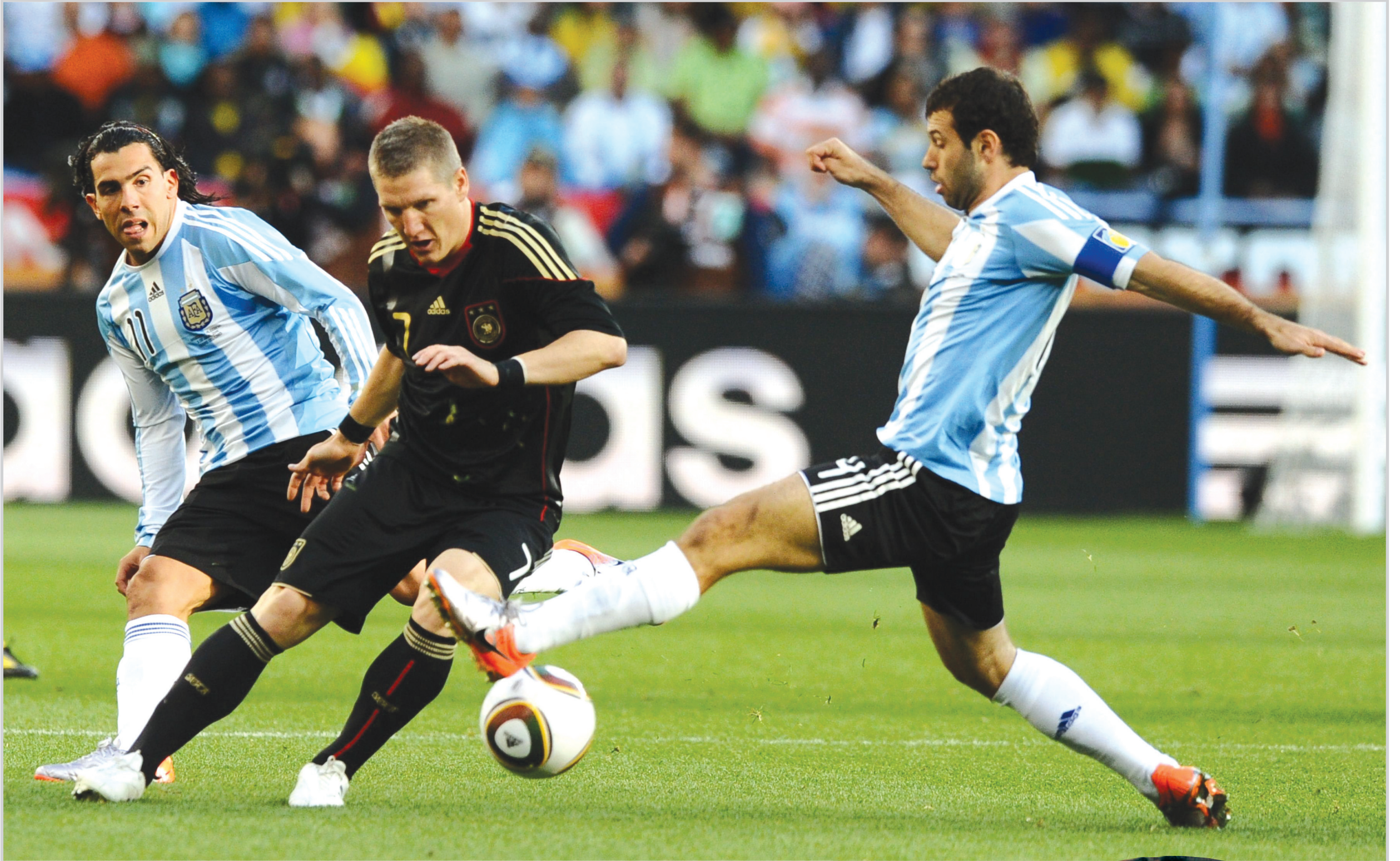
المنشآت تقهر التانغو من جديد...