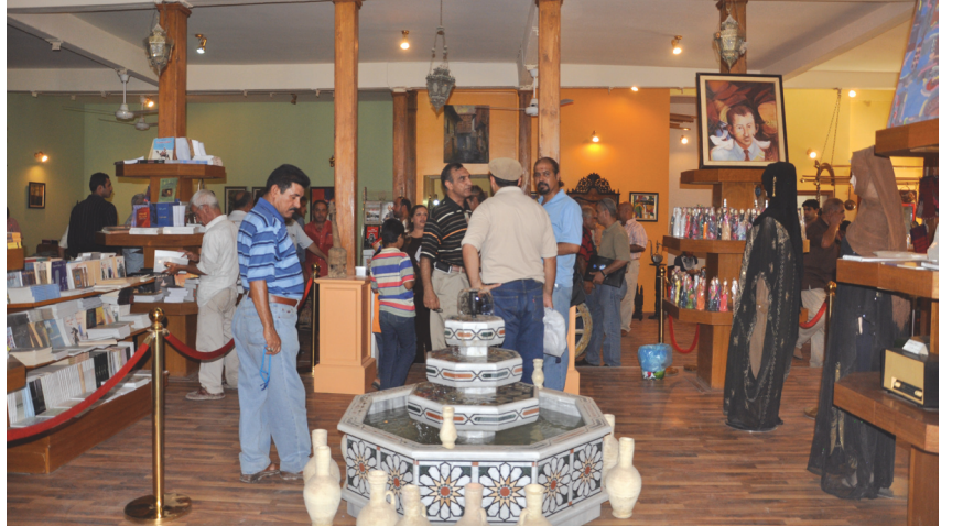
قاعة بيت المدى