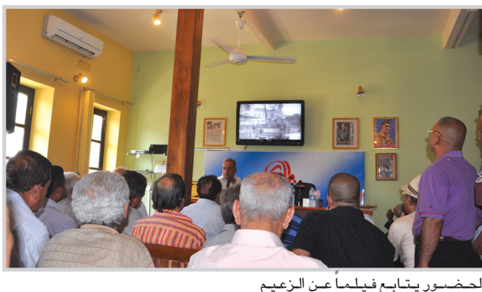
الحضور يتابع فيلماً عن الزعيم