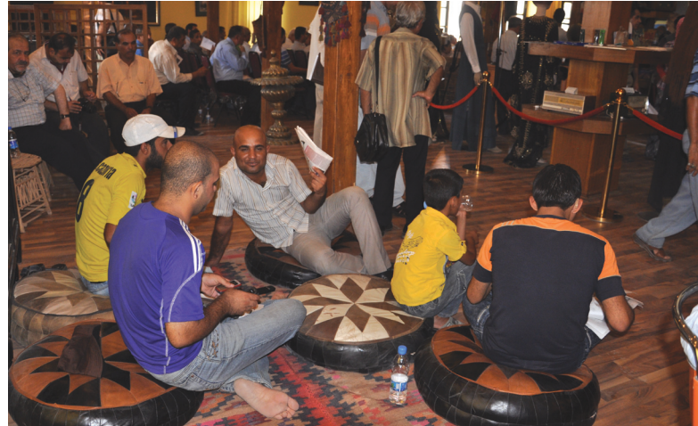
استراحة في بيت المدى