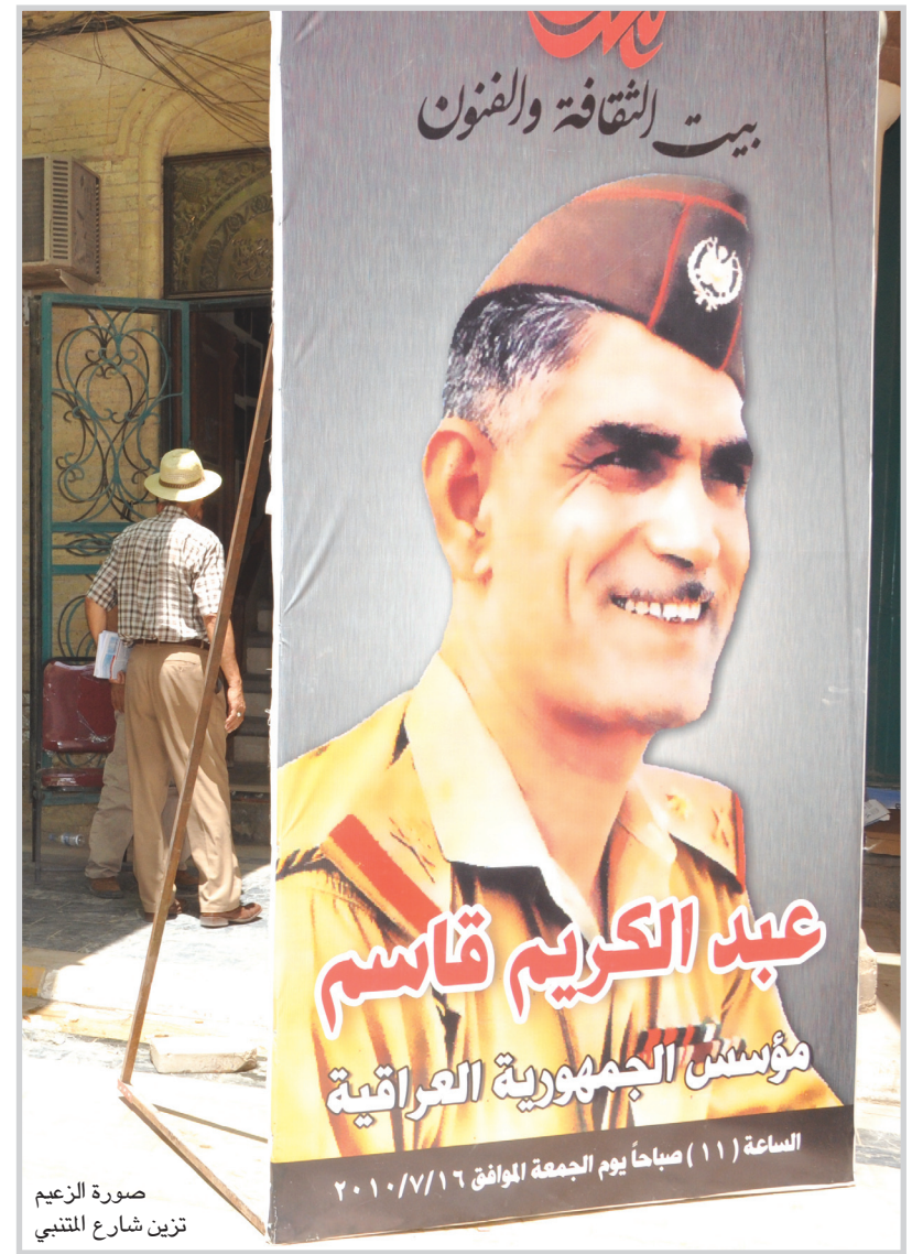
صورة الزعيم تزين شارع المتنبي

كان معلماً رئيسياً في نقل العراق من المجتمع المتشطي العشائري إلى الدولة المركزية. هذا النقل هو ليس مجرد نقل بالهبة والشكل التنظيمي للدولة وإنما لتأسيس الدولة وفق سياقات متعددة، عقدت عقداً اجتماعياً بينها وبين المكونات الاجتماعية لألسف الشديد لم يكن هذا العقد الذي يتماشى مع الواقع العراقي فجاءت ثورة تموز لتغير بنية ومحتوى ومضمون هذا العقد الاجتماعي، وأضاف الناصري قائلاً: من الذين تأثر بهم قاسم هناك ثلاثة أنواع أو أربعة أولاً الشخصيات التاريخية التي لعبت في حياة الأمة العربية والحياة الإسلامية بصورة رئيسية كان علي بن أبي طالب أحدهم هذه الشخصية لعبت دوراً جدياً كبيراً في حياته عندما سئل لماذا أعفيت