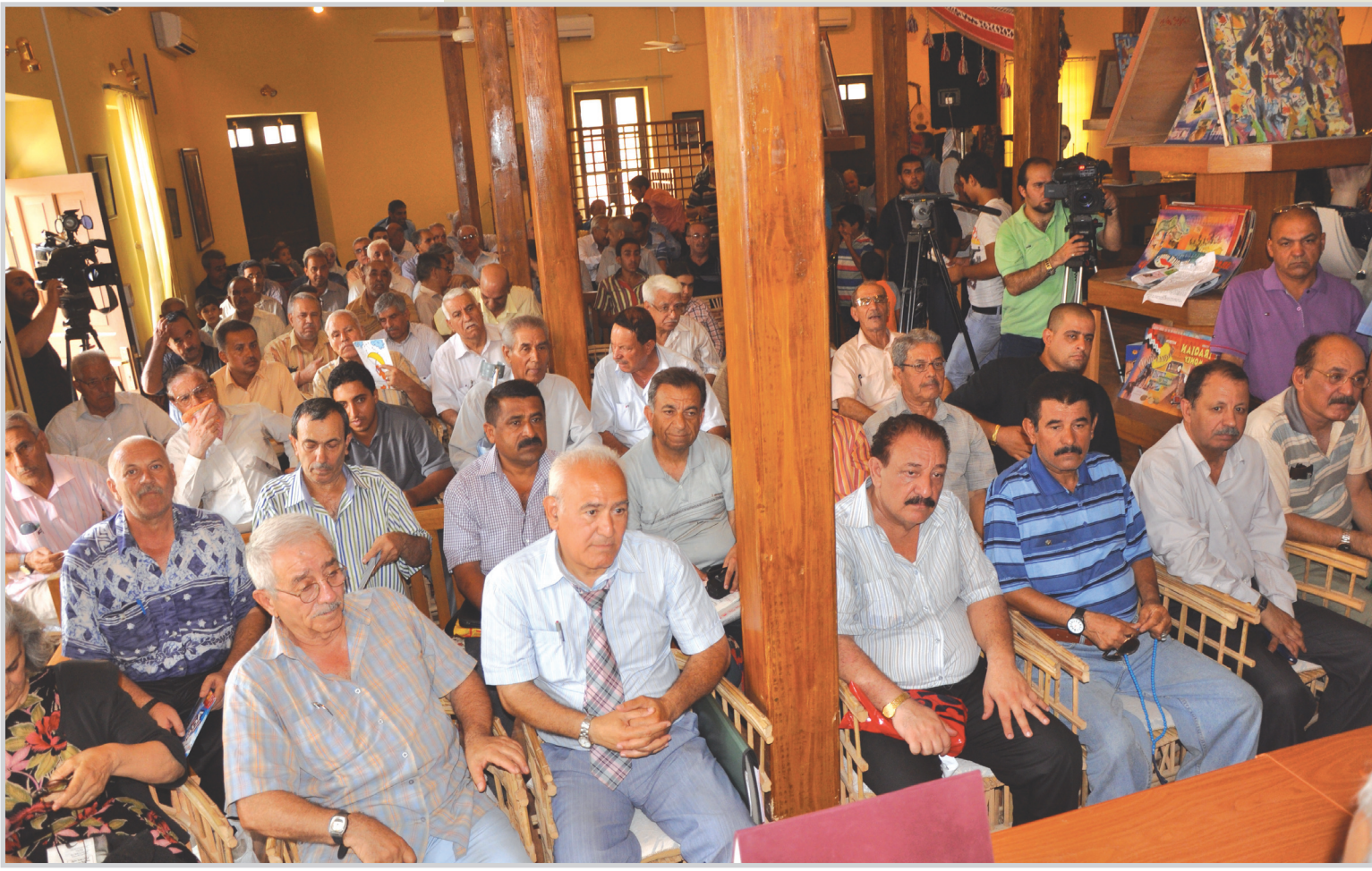
جاناب من الحضور الكبير

أقامت المدى بيت الثقافة والفنون حفلاً استذكاريًا صباح أمس بمناسبة الذكرى الثانية والخمسين لثورة الرابع عشر من تموز عام ١٩٥٨، وأقيمت في الحفل كلمات أشادت بدور الثورة وزعيمها عبد الكريم، وعرض فيلم بعنوان "رجل الحلم" من إنتاج مؤسسة المدى، ركز على أهم المحطات في حياة الزعيم والمنجزات التي قام بها. وافتتح الحفل مقدمه رفعت عبد الرزاق، بكلمة أشاد فيها بالثورة وقائدتها وعادا اياهما منجزا للفقراء والمعوزين.