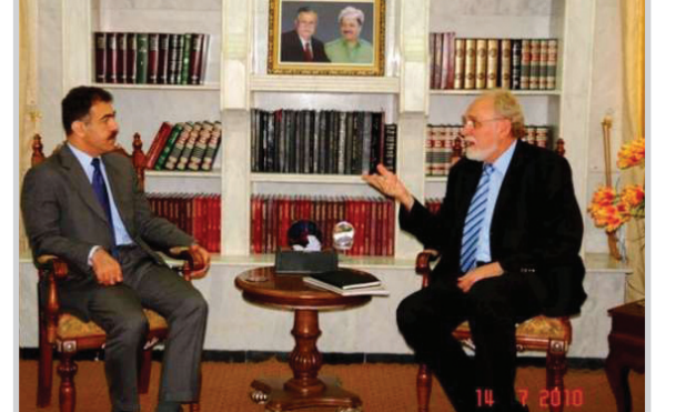
نشاطات المنظمة الألمانية تكافئ في تطوير الدراسة المهنية والاهتمام بمستوى وطاقت المهنيين في إقليم، وأشار خلال استقباله في

قيد وزير التربية في حكومة إقليم كردستان سفين محسن نزيي عالياً