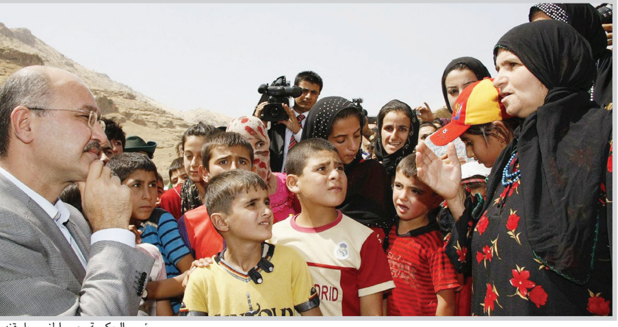
رئيس الحكومة مع مواطني جبل قنديل

بحث وزير الزراعة والموارد المائية في حكومة إقليم كردستان جميل سليمان حيدر مع القنصل العام الألماني الاتحادي الجديد في الإقليم ستيفان باتيل العلاقات بين حكومتي الإقليم وألمانيا على الصعد كافة. وأوضح القنصل الألماني أن أهداف زيارته وزارة الزراعة والموارد المائية تكمن في تعزيز التنسيق والتعاون من أجل تنفيذ بعض المشاريع الإروائية وحث الشركات الألمانية المستثمرة للمشاريع في تطوير النظام الإروائي في الإقليم، مؤكداً بحسب ما أورده الموقع الحكومي للإقليم أن جميع الظروف مهيأة من حيث استقرار الأوضاع الأمنية