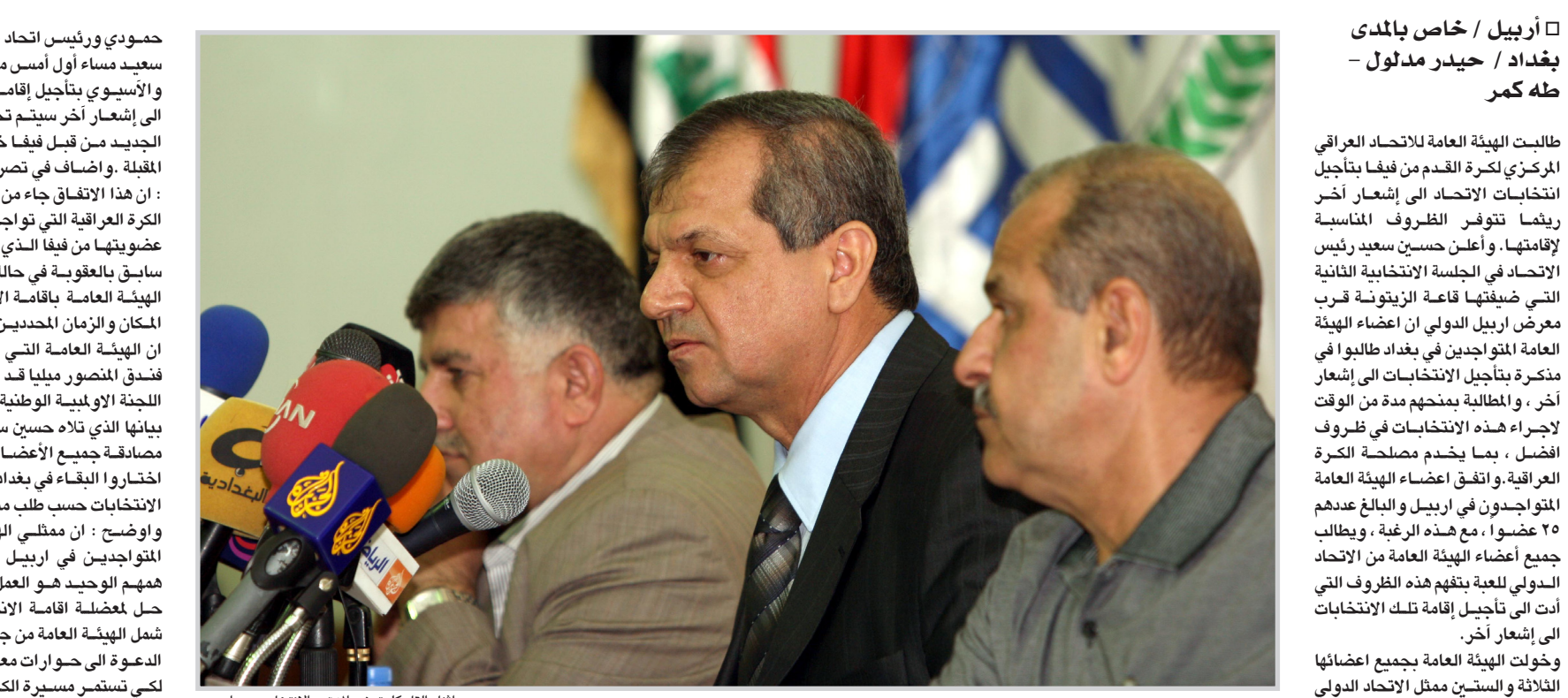
حسين سعيد أثناء كلمته في المؤتمر الانتخابي يوم امس...