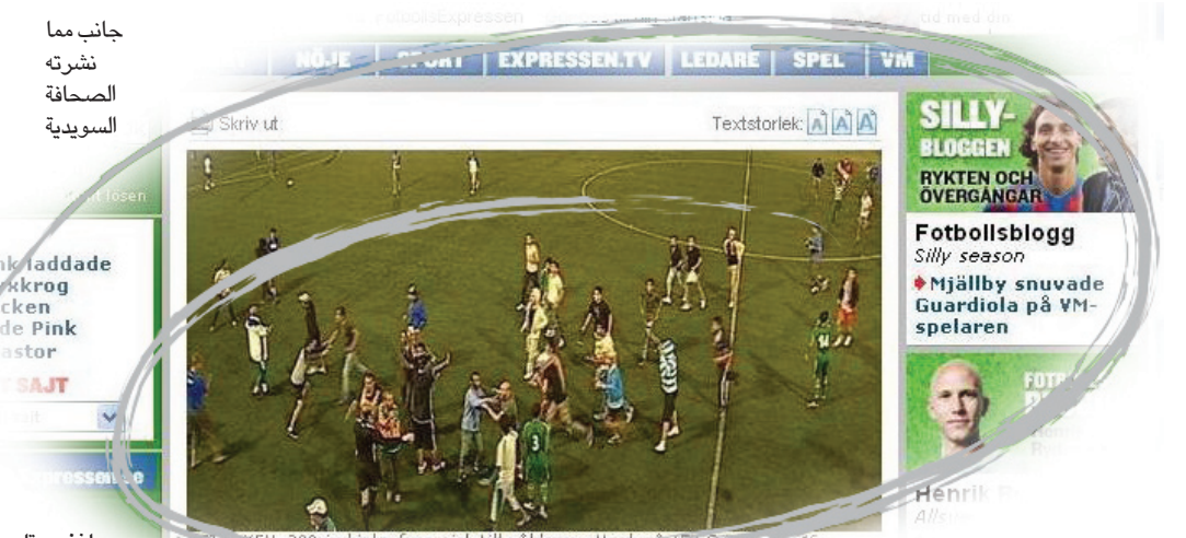
ويتيبوري / علي التميمي ويلن بوتل النمسواوي بغارق ركلات الجزاء

فرق أكاديمية المدينة في دائرة الهجرة اللاعبين الثلاثة مدة أقصاها ٢ أب القادم من أجل عودتهم إلى الوفد وهو موعد تاريخ نفاذ الفيزا الممنوحة لأعضائه وبعدها سيتم توزيع أسمائهم وإرسال بصمات الأصابع العشرة إلى مكتب الانتربول الدولي (الشرطة العالمية) وذلك وافر الهجرة في أوروبا وتزويدهم بالمعلومات كافة عن هؤلاء بغية تسليمهم إلى الأمن السويدي بصفتهم البلد الذي منحهم تأشيرة الدخول إلى الاتحاد الأوروبي علما بان اللجنة المنظمة كانت قد طالبت الوفد العراقي بضرورة تقديم تعهد خطي من قبل أولياء اللاعبين أو من أي جهة رسمية تتعهد بضمان عودتهم إلى العراق بعد المشاركة خوفا من تقديم طلبات اللجوء الإنساني في السويد أو الاتحاد الأوروبي بعدما أصدر الأخير قرارا يقضي بعدم منح العراقيين حق اللجوء والإقامة مع تطبيق قرار العودة الإنزامية عبر الطائرة العراق.