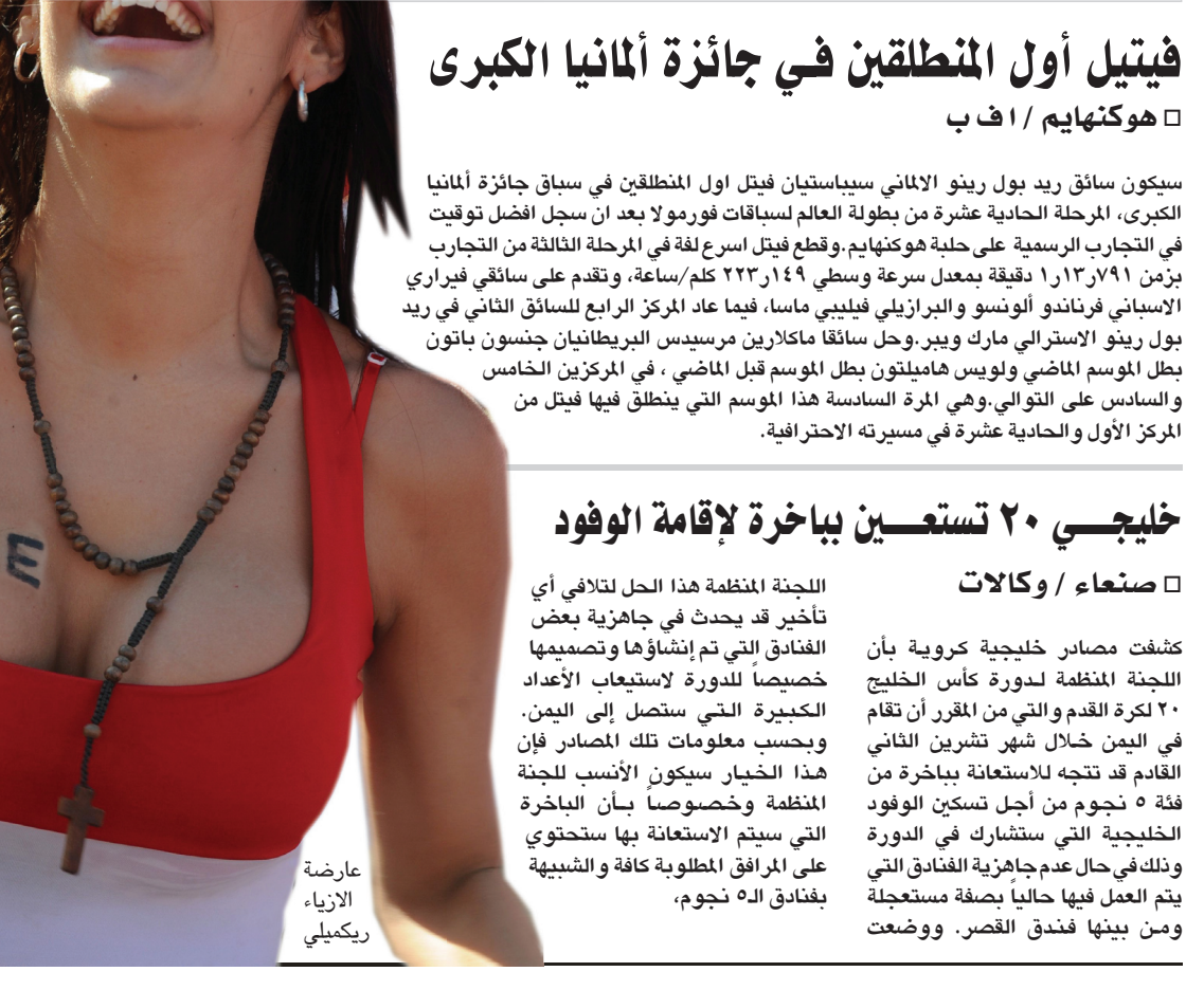
عارضة الأزياء ريكليمي

تصدر بطل التنس السويسري روجيه فيدير قائمة أئرى الرياضيين في العالم وأعلامه مثلا من خارج الولايات المتحدة، وهي اللاحة التي تصدرها مجلة "سپورتس الستيدي". وتربع بطل الغولف الأمريكي تايفير وودز على عرش أثرياء الرياضة الأمريكيين براتب يصل إلى ٩٠.٥ مليون دولار سنويا. وحصل فيدير على دخل سنوي يقدر بـ ٦٢ مليون دولار، واحتل النجم الأرجنتيني ليونيل ميسي المركز الثاني بـ ٤٤ مليون دولار، متفوقا على الإنكليزي ديفيد بيكهام والبرنغالي كريستيانو رونالدو، اللذين تقاسما المركزين الثالث والرابع بدخل سنوي بلغ ٤٠ مليون دولار.