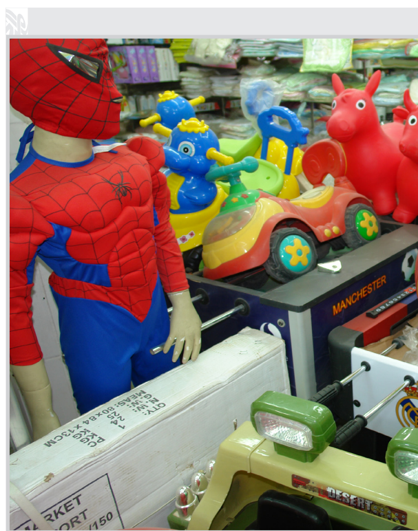
يلاحظ المتجول في أسواق بغداد انحساراً كبيراً في اللعب البرينة للأطفال، وانتشاراً كبيراً في اللعب المحرصة على العنف، والتي شاعت بفعل الظروف المعروفة التي عاشها العراقيون.. الأمر منوط بأولياء الأمور فهم الوجه الأول والأخير لأبنائهم.

حل نزاعات الملكية العقارية تسري أحكام قانون هيئة حل النزاعات الملكية العقارية على الكليات الواقعة على العقارات المشمولة به خلال الفترة الواقعة من 17 تموز 1968 ولغاية 9 نيسان 2003 وتشتمل ( حسب ما جاء في المادة 4 ) من القانون أعلاه مايلي :- 1. العقارات المصادرة والمحوزة لأسباب سياسية أو عرقية أو على أساس الدين أو المذهب أو لأي حالات أخرى تمت نتيجة لسياسات النظام السابق في التهجير العرقي والطائفي أو القومي . 2. العقارات المستولى عليها بدون بدل أو المستلمه بغبن فاحش أو خلافاً للأجراءات القانونية المتبعة في الاستملاك ويستثنى من ذلك العقارات المستولى عليها وفق قانون الإصلاح الزراعي وقضايا التعويض العيني والاستملاك لأغراض المنفعة العامة . 3. عقارات الدولة المخصصة بدون بدل أو يبدل رمزي لأزلام النظام السابق . وأما المادة ( 5 ) من هذا القانون فقد جاء في الفقرة ثانياً منها: (على جميع المحاكم العراقية أحالة الدعاوى المشمولة بأحكام هذا القانون على اللجان القضائية في الهيئة ولغاية انتهاء تقديم الطلبات).